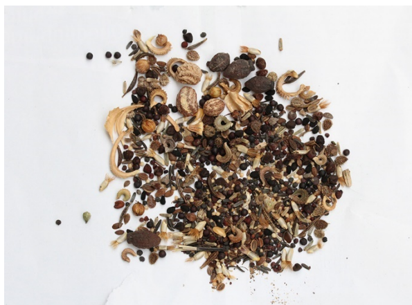
Abb. 3: Inhalt einer Samenmischung für eine Schmetterlingswiese aus einem Baumarkt (Mülheim, 28.04.2018,).