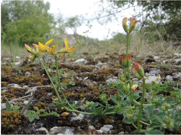
Abb. 19: Lotus corniculatus (Gewöhnlicher Hornklee) in einem stillgelegten Steinbruch bei Geseke/Kreis Soest (12.06.2015,).