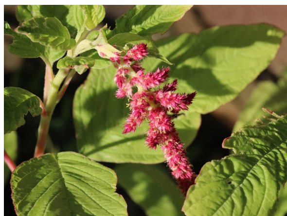
Abb. 6: Amaranthus caudatus (Garten-Fuchsschwanz) (Bochum, 30.07.2018,).