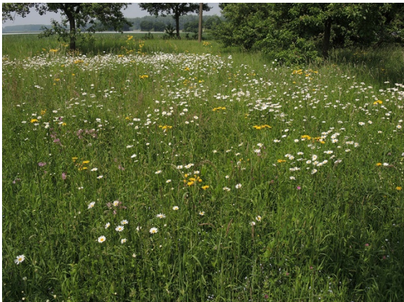
Abb. 31: Blühender Wiesenstreifen aus einer Ansaat in einer Obstwiese in Köln-Worringen (19.05.2018,).