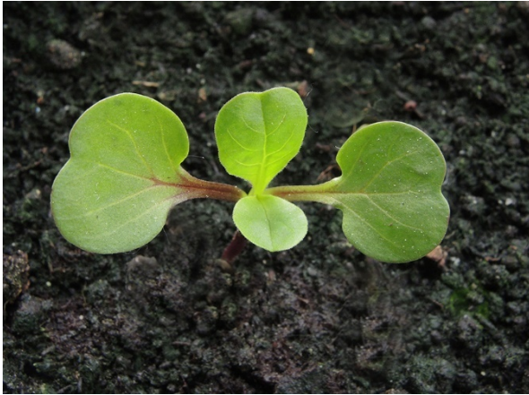
Abb. 11: Keimling von Convolvulus tricolor, verkauft als Ipomoea tricolor, wobei es sich um eine andere Art, nicht um ein Synonym handelt (11.03.2018,).