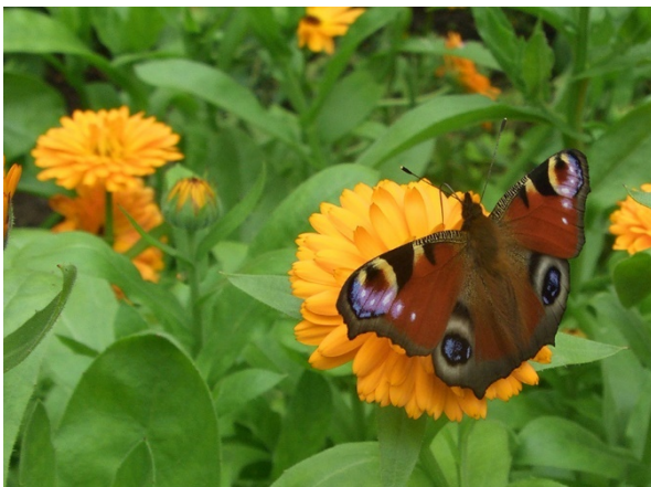
Abb. 27: Calendula officinalis (Garten-Ringelblume) mit Tagpfauenauge ( Aglais io) in einem Vorgarten in Bochum (25.07.2008,).

Dies kann kaum pauschal beantwortet werden, da gerade faunistische Gefüge sehr komplex sind. Festzustellen ist allerdings, dass gerade in den wenigen Wochen des Hauptblühaspekts zwar viele Insekten an den Blüten solcher Aussaaten zu finden sind, es sich jedoch in der Regel um häufige Arten ohne besondere Ansprüche handelt wie z. B. Tagpfauenauge (Abb. 27), Kleiner Kohlweißling und die allgegenwärtige Honigbiene (Abb. 28). Hier wäre also lediglich ein positiver Effekt auf die absolute Biomasse an Insekten nachvollziehbar. Betrachtet man jedoch die Arten der Roten Listen, wird klar, dass es sich bei den stark gefährdeten und vom Aussterben bedrohten Insektenarten mehrheitlich um auf bestimmte heimische Pflanzenarten stark spezialisierte Arten handelt, die auf intakte Artengemeinschaften, natürliche Lebensräume und traditionelle Bewirtschaftung angewiesen sind.