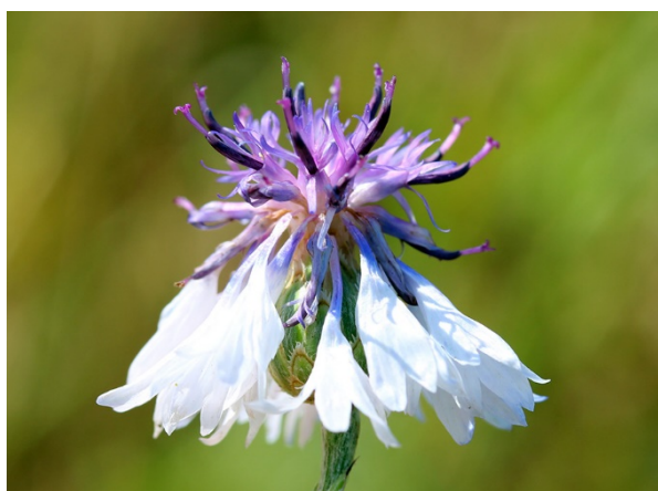
Abb. 5: Centaurea cyanus (Kornblume) mit weißen Randblüten (Mülheim/Ruhr, 18.08.2018,).