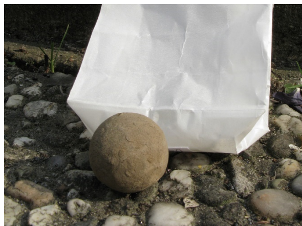
Abb. 4: Seedbomb im Rahmen des Guerilla Gardening „für eine buntere Stadt“ (Bochum, 20.05.2011,).