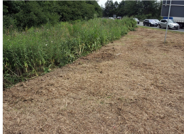
Abb. 2: Gemulchter Straßenrand in Witten-Annen/Ennepe-Ruhr-Kreis (21.07.2018,).

Allerdings spielt die aktuelle Medienpräsenz des „Insektensterbens“ dem Naturschutz in gewisser Weise auch in die Karten: Es sind dadurch grundsätzliche Sachverhalte bereits im Bewusstsein der Bevölkerung verankert und es herrscht eine hohe Bereitschaft, aktiv zu werden. Doch während es offensichtlich seitens des ehrenamtlichen und behördlichen Naturschutzes oft noch an Orientierung, einheitlichem Rat und Kommunikationsstrategien mangelt, haben Marktwirtschaft und Politik die Zeichen der Zeit rasch erkannt: In so gut wie jedem Baumarkt, Discounter, aber auch auf Werbeveranstaltungen sind mittlerweile Samentütchen für „die Bienen“ erhältlich, die sich entweder für verhältnismäßig teures Geld oder aber als Maßnahme für einen ökologischen Anstrich von Firmen und Parteien gut unter die Leute bringen lassen. Ansprechende Namen wie „Schmetterlingswiese“, „Bienenschmaus“ und „Hummelmagnet“ auf einem attraktiven Cover mit bunten Blumen halten jedoch ihr ökologisches Versprechen nur selten.