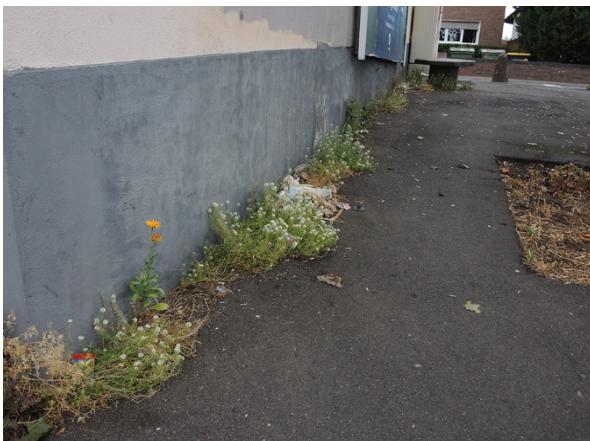
Abb. 13: Lobularia maritima (Strand-Silberkraut) und Calendula officinalis (Garten-Ringelblume) auf einem Bürgersteig in Köln-Worringen (18.09.2016,).

Seit einiger Zeit wird von Botanikern eine auffällige Häufung von Funden neuer Arten in der Landschaft gemeldet (vgl. BOCHUMER BOTANISCHER VEREIN 2014–2019a & 2014–2019b, Abb. 13–16). Zunächst fielen diese als „exotische“ Arten auf, die mit gängiger Literatur oft gar nicht bestimmt werden konnten. Die Ansprache erforderte also eine mehr oder weniger aufwändige Recherche, teils auch den Blick in Bestimmungsbücher der Mittelmeerflora. Es wurde schnell deutlich, dass diese Funde in Zusammenhang mit dem Vertrieb der einschlägigen Samentütchen und dem „Insekten-Hype“ stehen. Die Vorkommen dieser Arten im Gelände stammen entweder direkt von Menschen, die gut gemeint die Landschaft zum Schutz der Insekten ökologisch aufwerten wollen, oder aber sie treten bereits aus solchen Ansaaten verwildernd auf.