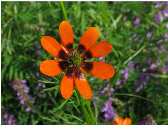
Abb. 9: Adonis aestivalis (Sommer-Adonisröschen), ein in Deutschland stark gefährdetes Ackerunkraut (Thüringen, 06.06.2010,).

Wenn die Arten nicht auf dem Tütchen aufgelistet sind, kann der Inhalt ohne Konsequenzen variieren. Aber auch auf die Aussaat von Samen aus definiertem Saatgut mit nur einer Art ist nicht unbedingt Verlass. So enthielt eine Samentüte nicht das auf dem Cover angegebene, in Deutschland seltene und stark gefährdete Ackerunkraut Sommer-Adonisröschen ( Adonis aestivalis , Abb. 9, vgl. BFN 2018), sondern das im Mittelmeergebiet heimische Herbst-Adonisröschen ( Adonis annua , Abb. 10), das in Deutschland als unbeständiger Neophyt auftritt (FLORAWEB 2018). Ähnliches passierte auch gattungsübergreifend bei Ipomoea purpurea (Purpur-Prunkwinde) und Convolvulus tricolor (Dreifarbige Winde), verkauft als Ipomoea tricolor . Beide lassen sich aber schon aufgrund der Keimblätter deutlich unterscheiden (Abb. 11 & 12).