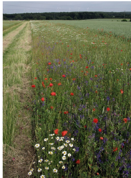
Abb. 32: Blühender Ackerrandstreifen auf Kalk mit Feld-Rittersporn in Geseke/Krs. Soest (30.06.2013,).