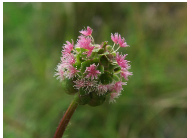
Abb. 22: Sanguisorba muricata subsp. balearica (Höckerfrüchtiger Wiesenknopf) aus einer Ansaat in Bochum-Weitmar (07.03.2005,).