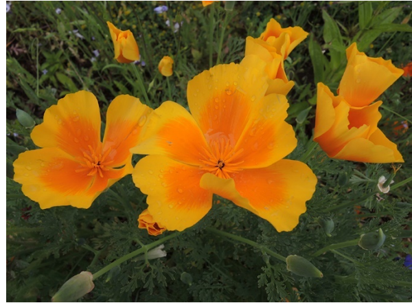
Abb. 8: Eschscholzia californica (Kalifornischer Kappenkraut) (Bielefeld, 29.05.2016,).

Vermutlich wurden vor allem Arten ausgewählt, die sich effektiv vermehren und deren Samen sich entsprechend kostengünstig herstellen lassen. Möglicherweise stammt ein nicht unerheblicher Teil in den Samenmischungen sogar aus Überschüssen sonstiger Produktionen, die sich in den undefinierten Mischungen noch gut vermarkten lassen.