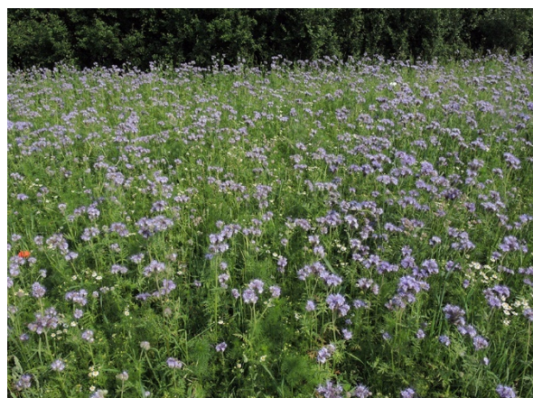
Abb. 26: Einjährige „Bienenweide“ mit Phazelle als Zwischensaat auf einem Acker (Geseke/Krs. Soest, 05.06.2016,).

Eine Saatmischung mit einjährigen Arten, die zudem noch im Hochsommer blühen, ist für die Nutzung als Mähwiese somit eine denkbar ungeeignete Wahl. Aber auch ohne Mahd wachsen einjährige Pflanzenarten, sofern sie nicht aus mitteleuropäischem Klima stammen, im nächsten Jahr kaum mehr nach. Es muss also nicht nur eine neue Tüte gekauft werden, sondern für eine erneute Einsaat auch der Boden umgebrochen werden – der Tod für alle Insekten, deren Larven in abgestorbenen Halmen oder in Bodennähe überwintern.