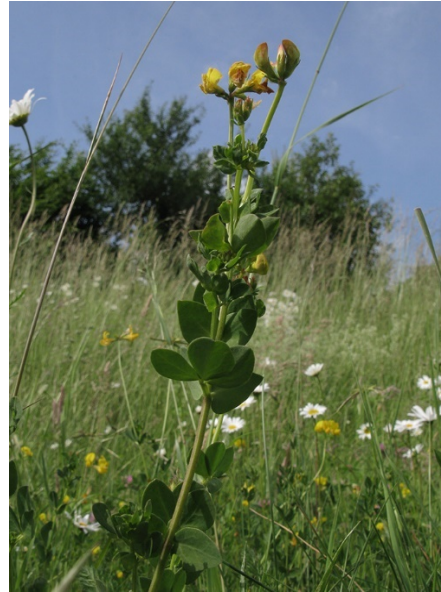
Abb. 20: Lotus sativus (Saat-Hornklee) an einer Böschung bei Augustdorf/Kreis Lippe (15.06.2013).