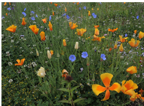
Abb. 25: „Einjährige Wiese“ aus der Samentüte mit verschiedenfarbigem Kalifornischem Kappensmohn, Bart-Nelke und Lein (Bielefeld, 05.06.2016,).