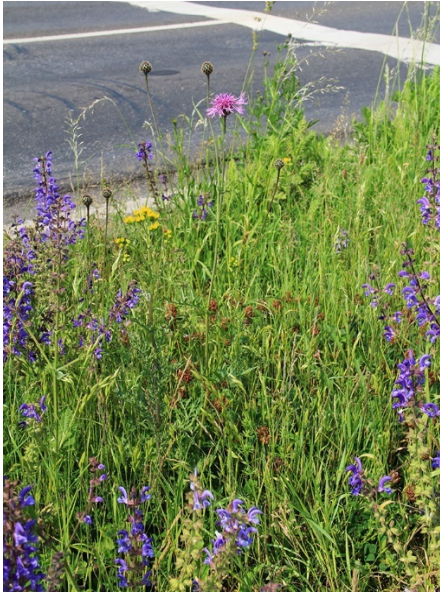
Abb. 1: Bunt blühender Straßenrand in Duisburg (28.05.2016,).