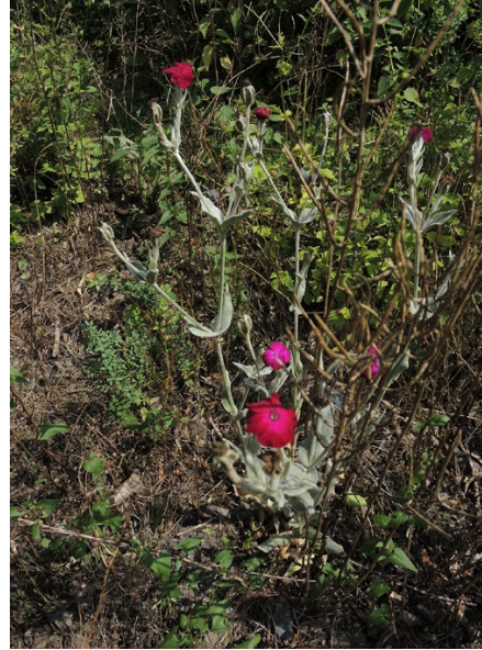
Abb. 16: Lychnis coronaria (Kronen-Lichtnelke) auf einer Brachfläche in Unna (09.07.2017,).

Ein deutliches Zeichen für gezielte, direkte Ansaaten in der Landschaft ist das Vorkommen von gleich mehreren typischen „Bientütchen-Arten“ an einem Ort. In solchen Fällen kann davon ausgegangen werden, dass der Standort Opfer einer Guerilla Gardening-Aktion wurde. In vielen Fällen bleibt dies jedoch völlig unklar, z. B. wenn nur einzelne Arten bzw. Pflanzen auftreten oder diese an schlecht zugänglichen Orten wachsen.