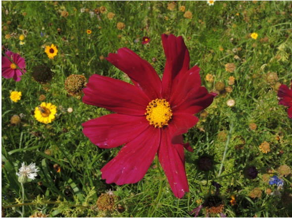
Abb. 7: Cosmos bipinnatus (Schmuckkörbchen) (Bochum, 18.07.2018,).