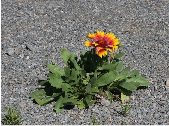
Abb. 15: Gaillardia aristata (Prärie-Kokardenblume) auf der Halde Rheinelbe in Gelsenkirchen (21.07.2017,).