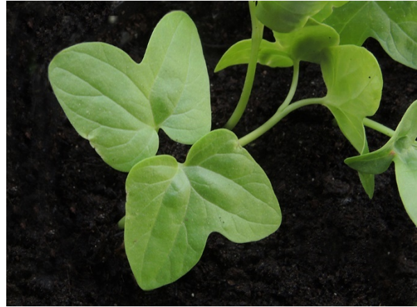
Abb. 12: Ipomoea -Keimling mit typischen Keimblättern, hier Ipomoea purpurea 'Blue Star' (16.05.2018,).