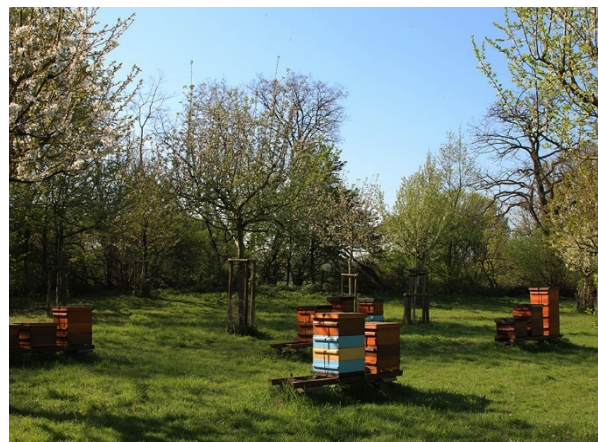
Abb. 30: Bienenstöcke auf einer Obstwiese im blütenarmen Grünland (Duisburg, 18.04.2018,).