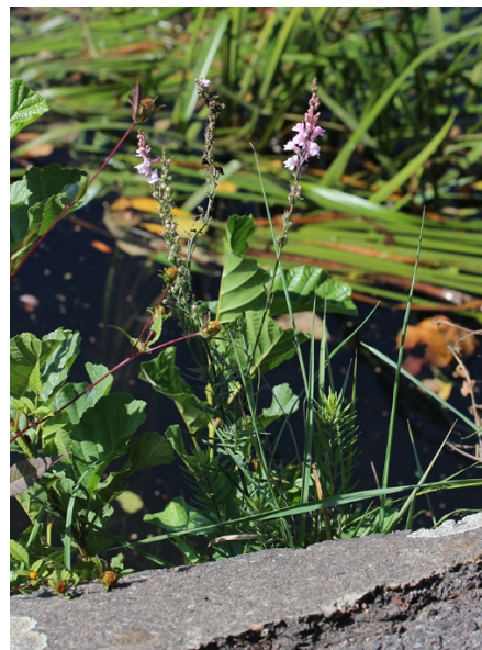
Abb. 14: Linaria purpurea (Purpur-Leinkraut) in einer Uferbefestigungsmauer der Ruhr in Mülheim/Ruhr (08.09.2018,).