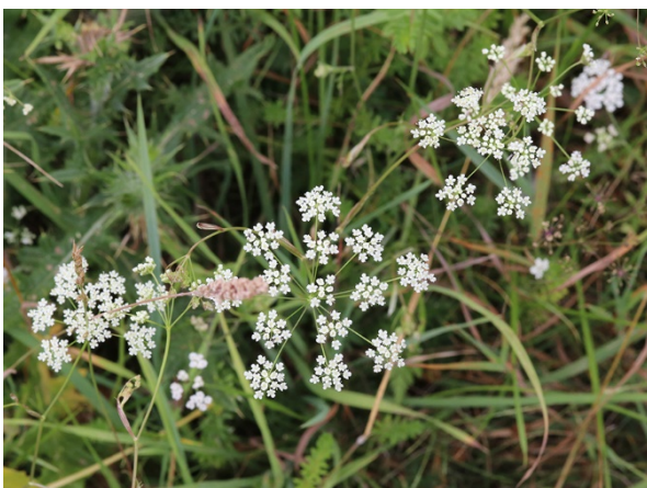
Abb. 23: Die heimische Kleine Bibernelle ( Pimpinella saxifraga) in der Pöppelsche im Kreis Soest (29.07.2018,).