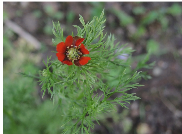
Abb. 10: Adonis annua (Herbst-Adonisröschen) aus einer Samentüte mit der Aufschrift „Adonisröschen, Blutströpfchen ( Adonis aestivalis)“ (04.08.2018,).