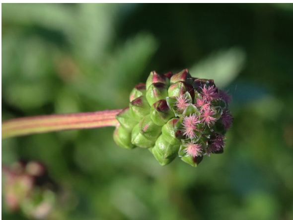
Abb. 21: Sanguisorba minor subsp. minor (Kleiner Wiesenknopf) in einer Obstwiese in Bochum (20.04.2019,).