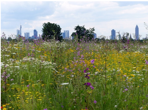
Abb. 17: Angesäte „Wildwiese“ in Frankfurt/Main (26.06.2016,).