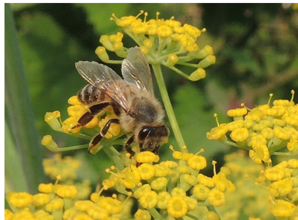
Abb. 28: Apis mellifera (Honigbiene) an Fenchel ( Foeniculum vulgare) in einem Schrebergarten in Bochum (21.07.2018,).