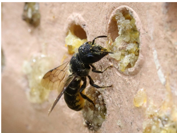
Abb. 29: Die Gewöhnliche Löcherbiene ( Osmia trunco-rum) an einer Insekten-Nisthilfe (Bochum, 30.07.2018,).

Der durch die deutlich angestiegene Nachfrage ausgelöste, allgegenwärtige Verkauf von Wildbienen-Nisthilfen (Abb. 29), sog. „Bienenhotels“, in Discountern und Baumärkten, die häufig mit ungeeigneten Füllmaterialien produziert wurden, ist neben dem Verkauf von Samentütchen ein weiteres Beispiel für die Kommerzialisierung des Themas. Sie können zwar im Sinne von Umweltbildung zielführend sein, sind aber für Wildbienen nur dann geeignet, wenn sie fachgerecht hergestellt wurden.