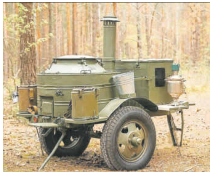
Eine Feldküche der roten Armee