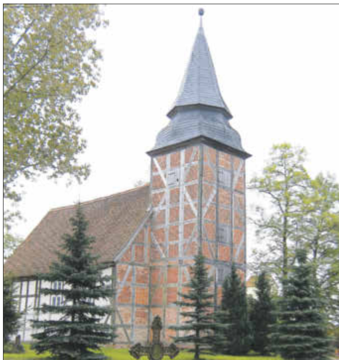
Die alte Fachwerkkirche in Rehberg

Nach langer Pause geht es nun wieder auf Exkursion zu den Schönen, die am Wege stehen - den alten Dorfkirchen. Zumeist aus Feldsteinen errichtet, mit oder ohne Turm, trotzen sie seit Jahrhunderten den Zeitläufen. Ihnen und den „Schätzen“, die sie bergen, gilt diese Fahrt.