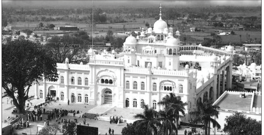
Takhat Sri Kesgarh Sahib, Sri Anandpur : Birthplace of the Khalsa