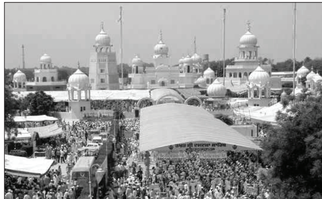
ਗੁਰਦੁਆਰਾ ਦਮਦਮਾ ਸਾਹਿਬ ਵਿਖੇ ਵਿਸਾਖੀ ਜੋੜ-ਮੇਲਾ

ਉਂਵ ਸਿੱਖ-ਧਰਮ ਨਾਲ ਵਿਸਾਖੀ ਦਾ ਚਿਰੋਕਣੇ ਸਮੇਂ ਤੋਂ ਹੀ ਘਣਾ-ਘਨਿਸ਼ਟ ਸੰਬੰਧ ਹੈ। ਭਾਵੇਂ ਵਿਸਾਖੀ ਦਾ ਪਹਿਲਾ ਤਿਉਹਾਰ ਤੀਸਰੇ ਪਾਤਸ਼ਾਹ ਸ੍ਰੀ ਗੁਰੂ ਅਮਰਦਾਸ ਜੀ ਦੇ ਕਹਿਣ ਤੇ ਡੱਲਾ ਨਿਵਾਸੀ ਭਾਈ ਪਾਰੋ ਨੇ ਗੋਇੰਦਵਾਲ ਸਾਹਿਬ ਵਿਖੇ ਮਨਾਉਣਾ ਸ਼ੁਰੂ ਕੀਤਾ ਪਰ ਇਤਿਹਾਸ ਦਸਦਾ ਹੈ ਕਿ ਇਸ ਤੋਂ ਪਹਿਲੋਂ ਪਹਿਲੇ ਪਾਤਸ਼ਾਹ ਬਾਬਾ ਨਾਨਕ ਜੀ ਨੇ ਵਿਸਾਖੀ ਦੇ ਮੇਲੇ ਉੱਤੇ ਹੀ ਹਰਿਦੁਆਰ ਵਿਖੇ ਕਰਤਾਰਪੁਰ ਵੱਲ ਪਾਣੀ ਸੁੱਟਕੇ ਪੰਡਤਾਂ ਦਾ ਭਰਮ ਜਾਲ ਤੋੜਿਆ ਸੀ, ਤੇ ਇਸੇ ਦਿਨ ਹੀ ਆਪ ਜੀ ਨੇ ਧਰਤ ਲੋਕਾਈ ਨੂੰ ਸੋਧਣ ਲਈ ਉਦਾਸੀਆਂ ਦੀ ਸ਼ੁਰੂਆਤ ਕੀਤੀ ਸੀ। ਸੰਨ 1665 'ਚ ਮੱਖਣ ਸ਼ਾਹ ਲੁਬਾਣਾ ਜੀ ਨੇ ਬਾਬਾ ਬਕਾਲੇ ਸ੍ਰੀ ਗੁਰੂ ਤੇਗ ਬਹਾਦਰ ਸੰਬੰਧੀ 'ਗੁਰੂ ਲਾਧੇ ਰੇ' ਦਾ ਪੱਲਾ ਇਸੇ ਦਿਨ ਫੇਰਿਆ ਸੀ। ਵਿਸਾਖੀ ਦੇ ਦਿਨ ਹੀ (ਸੰਨ 1675) ਦਸਮ ਪਿਤਾ ਜੀ ਗੁਰ-ਗੱਦੀ ਸੰਭਾਲਦੇ ਹਨ