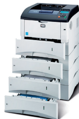
Abbildung enthält Optionen.

KYOCERA MITA DEUTSCHLAND GmbH – Otto-Hahn-Str.12 – D-40670 Meerbusch Infoline: 08 00 8 67 78 76 – Fax: +49 (0) 21 59 9 18 - 106 – www.kyoceramita.de