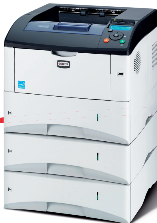
Abbildung enthält Optionen.