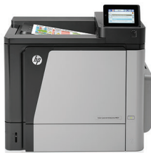
HP Color LaserJet Enterprise M651dn Drucker

Leistung, auf die Sie sich verlassen können: professionelle, beidseitig bedruckte Farbdokumente in hohen Auflagen und mit herausragender Zuverlässigkeit. Effizientes Drucken per Direkttaste, mobile Druckoptionen und die einfache Verwaltung sorgen für produktives Arbeiten, egal wo Sie sich gerade befinden.