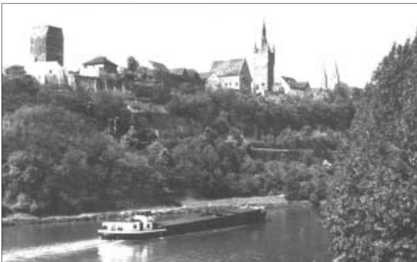
Bad Wimpfen, y dref hynafol y ffodd Doli iddi, lle y bu'n byw am gyfnod