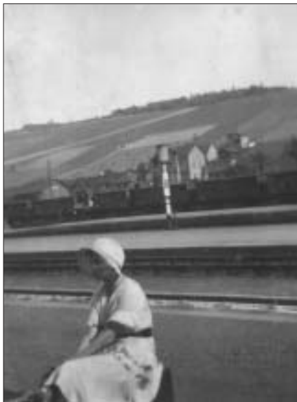
Ar daith: disgwyl mewn gorsaf