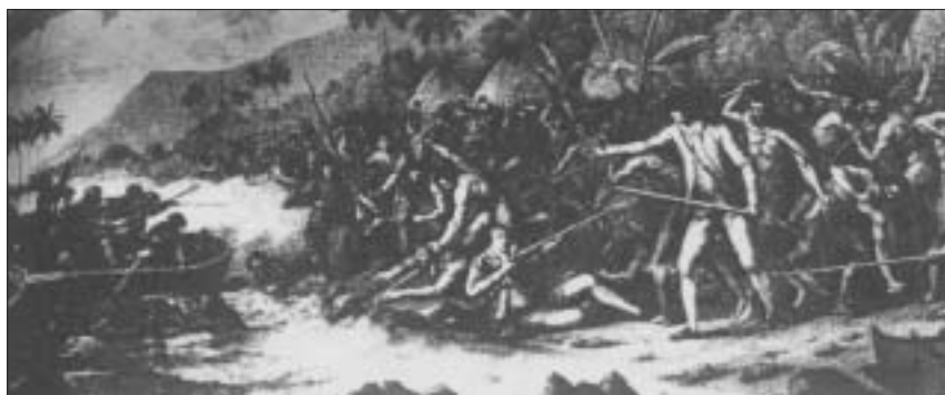
Artist cyfoes yn darlunio Capten Cook yn cael ei ladd.