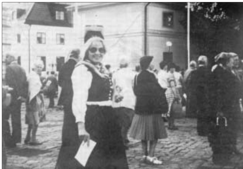
Dydd Gŵyl y Genedl yn Uppsala: merch mewn gwisg genedlaethol.