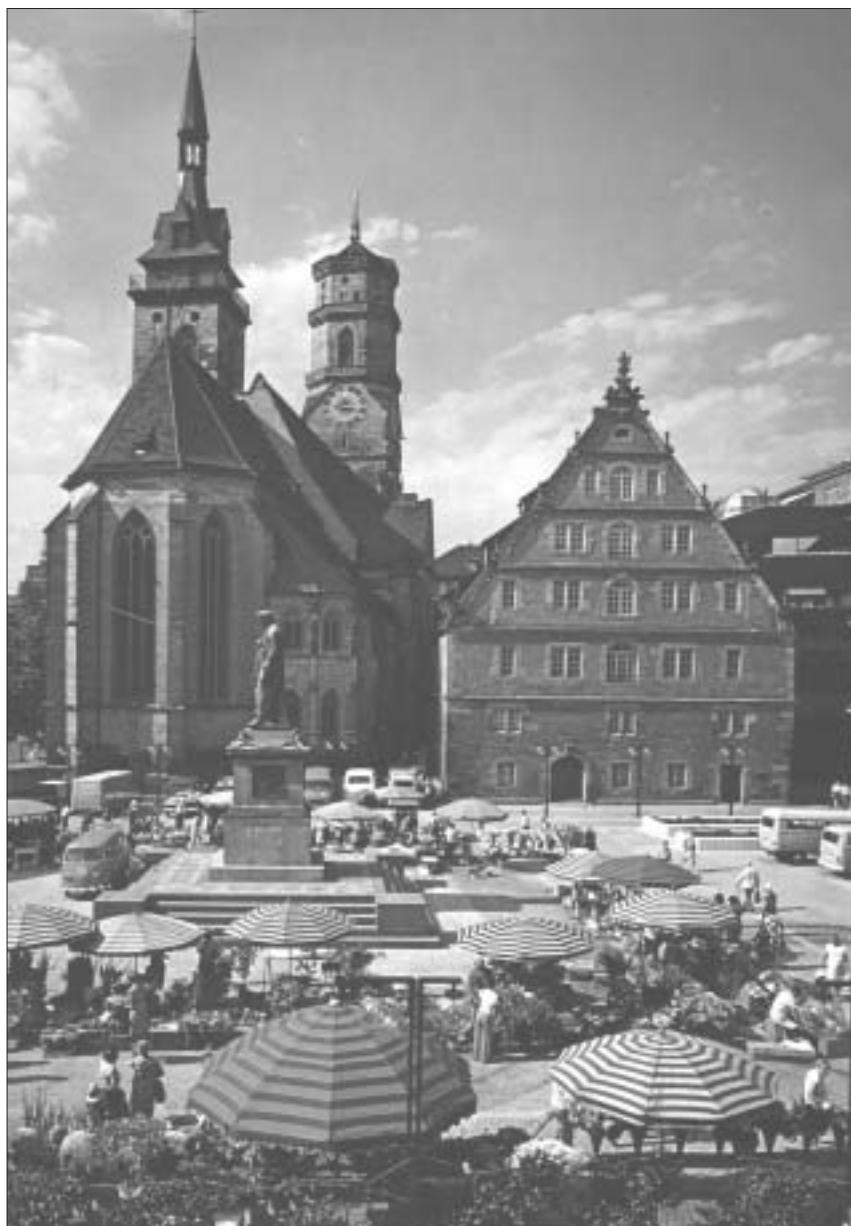
Sgwâr Schiller, Stuttgart