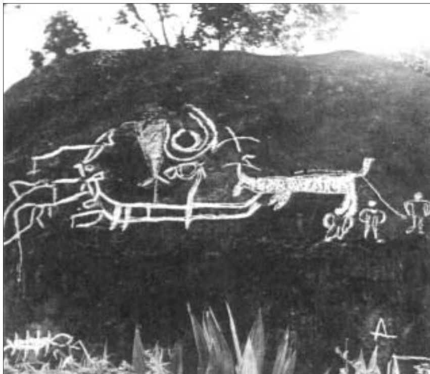
Petrogluffau ar un o glogfeini Ynys Lanâi. Darlunnir llong ac anifeiliaid a dynion.