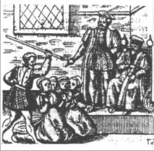
Y Brenin James yn holi menywod a gyhuddwyd o fod yn wrachod, ym 1590. Ym 1597 argraffwyd llyfr o'i eiddo, Demonology, sy'n ceisio profi bod 'rheibio' ar gael.

Hyfforddied Ialus ar ysprydion a Elwir tylwyth teg. Rhaid orllewgu'r galw ar ysprydion god yr bur lamweth a chydach wedi ei ddiarwng ar lawr neu ar naws yngalch i troedfodd oddiwrth y culch neu sefyll ar lawr a bod lws i'w neu o'i adroen arall wedi ei rortio yn ddiarwng a chwyd neu ddargyl wen fechan ai llond o ddwr glan Cadedog a hanner Pint o Sec mewn Botel a chwant o gwrw De a feint o hyspan mewn Drogel yr hwn fudd yr y gwneud hyspan yr ydymadodd yfarch ag yr mawr Cyffyllgar Iwanthir uch Dymonied yr Thau hwn lloff yr Dyphlan ni chwrddant ar Culch wrth ei galw mawr yr raid nich gwedi ymmolchid yr lan ag y'n hardd