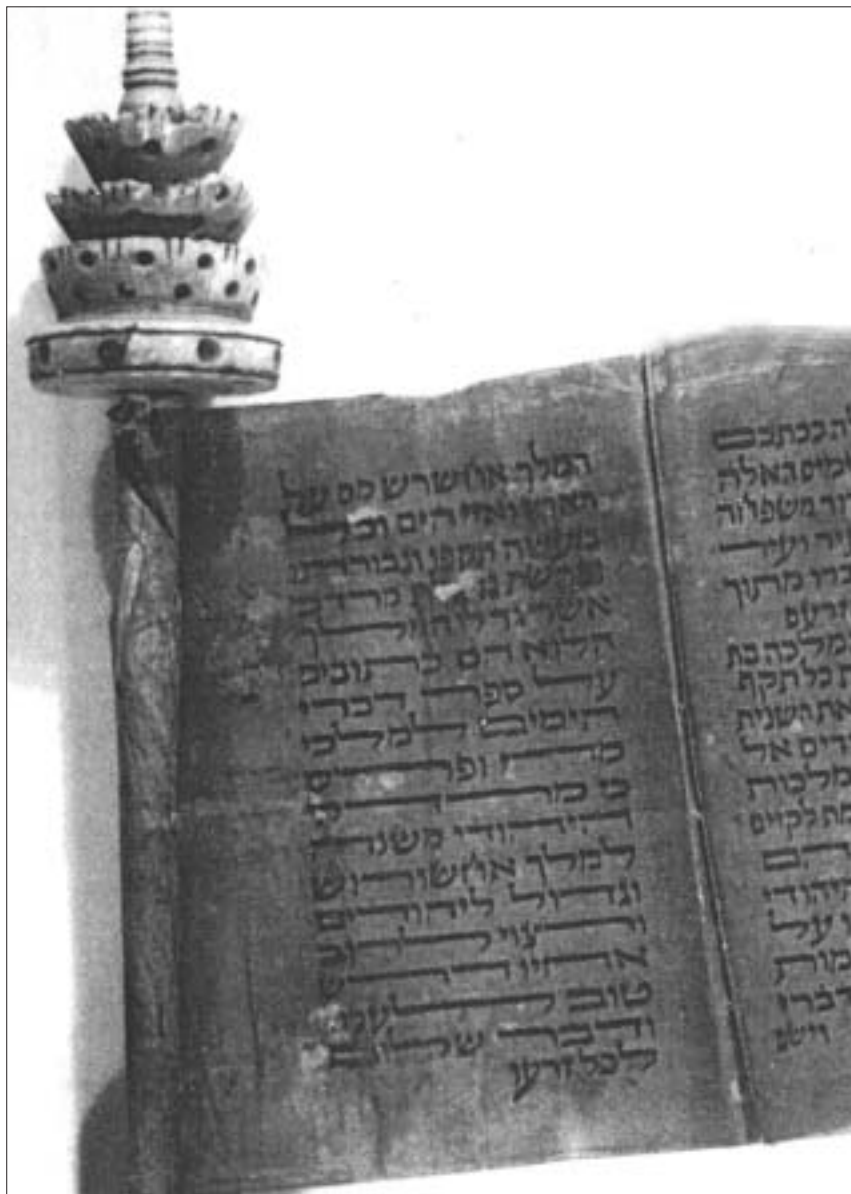
Sgrôl memrwn gydag ysgrifen Hebraeg yn yr Amgueddfa Eifftaidd yng Ngholeg y Brifysgol, Abertawe.