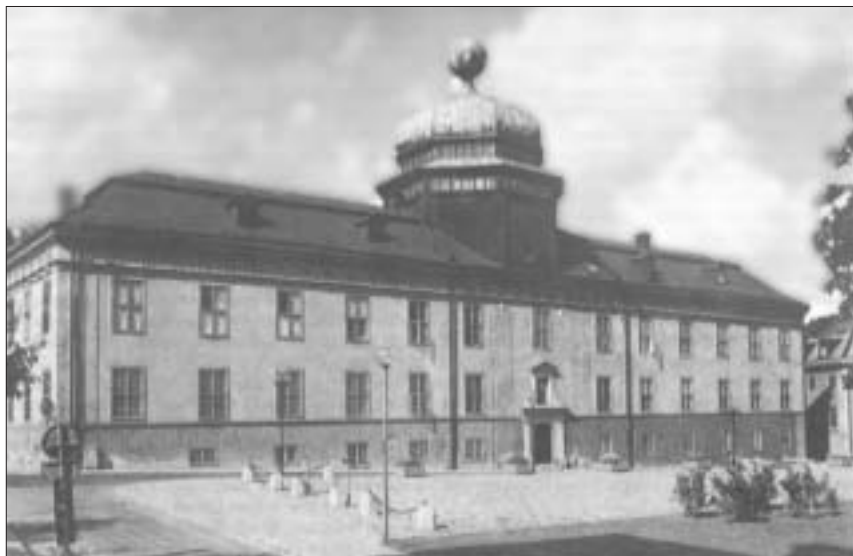
Prif adeilad yr hen Brifysgol, y Gustavianum, yn Uppsala