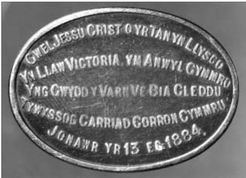
Y fedal a luniodd Dr William Price ar achlysur amlogi ei fab yn 1884.