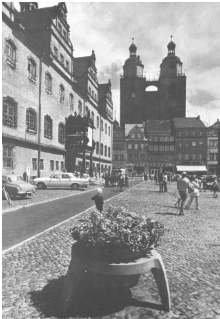
Sgwâr y Farchnad, Wittenberg