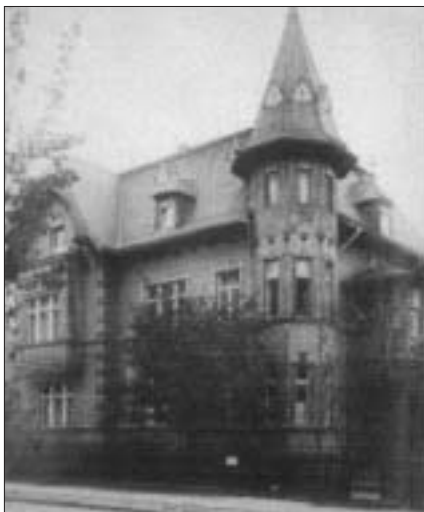
Cartref y teulu: y Klinik Bosse