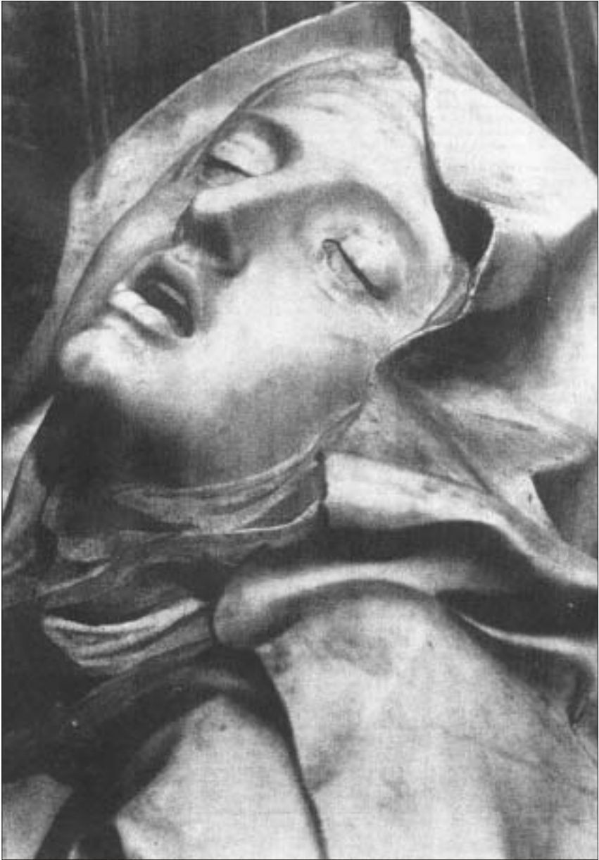
'Gorfoledd y Santes Teresa' – cerflun Bernini