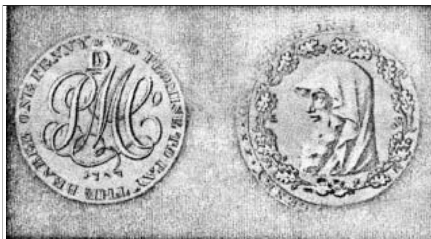
Ceiniog Mwynglawdd Parys, Mon, 1787, gyda phen derwydd.