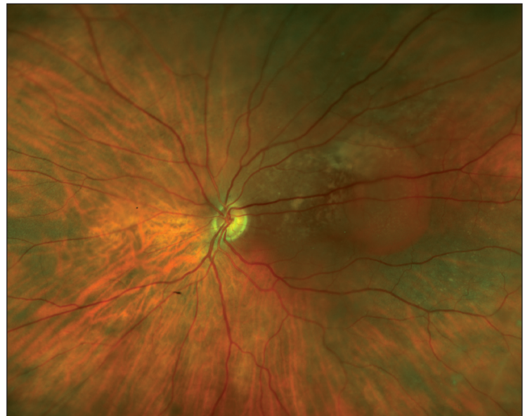
Figure 1. Hémangiome choroïdien circonscrit.

L'angiographie à la fluorescéine ( figure 2 ) montre généralement une hyperfluorescence des vaisseaux sanguins de la tumeur dans la phase préartérielle ainsi qu'une coloration tardive diffuse de la masse. L'angiographie au vert d'infra-rouge révèle un remplissage précoce de la lésion et un « lavage » caractéristique de l'hyperfluorescence aux temps tardifs. L'échographie en mode B montre