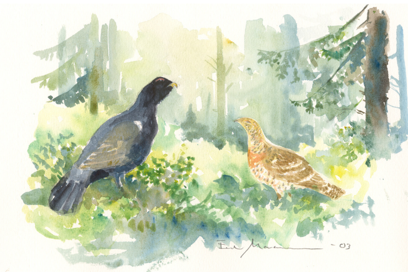
Tjäderpar