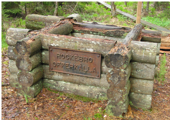
Botanikspången i Rockebro (t v). Rockebro offerkälla glänser fortfarande av mynt. Inte många vågar stjäla dem. Evig olycka är straffet. (t h)

I Rockebro, mellan Laxå och Askersund, har inlandsisen skapat ett spännande och märkligt landskap med åsryggar, kullar och sänkor. Flera dödisgropar finns i området. Dessa uppkom då isblock bröts loss från huvudisen och bäddades in i grusavlagringar. När de senare smälte bildades stora gropar. Den största gropen är i dag en sjö – Gropsjön. Andra är vattenfyllda vissa tider av året.