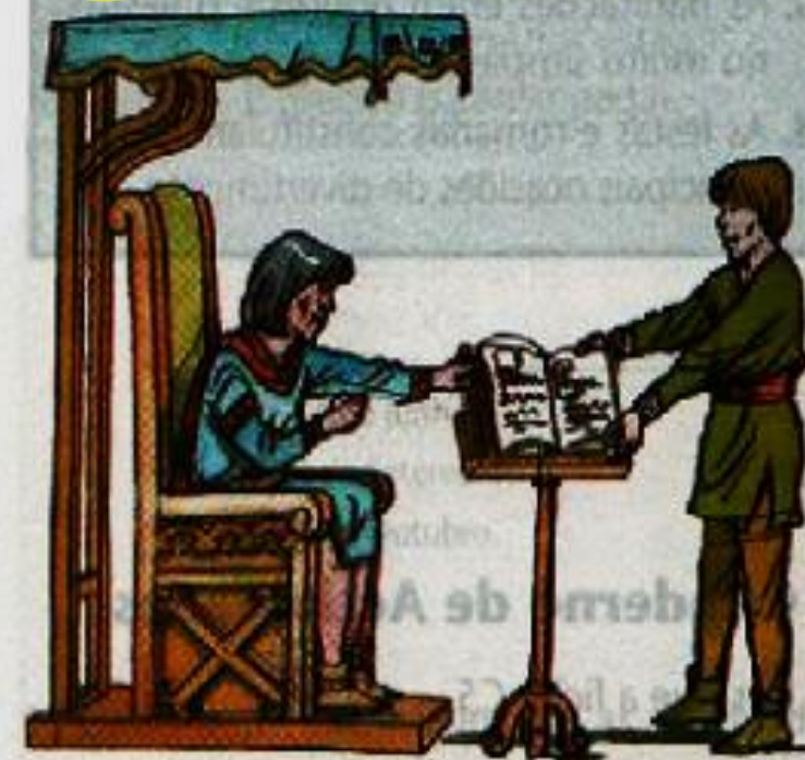
O juramento de fidelidade

Com a mão sobre a Bíblia (ou as relíquias de um santo), o vassalo jurava fidelidade ao suserano e comprometia-se a prestar-lhe auxílio militar e conselho.