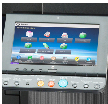
Großes, benutzerfreundliches 9" Farb-Touch-Display