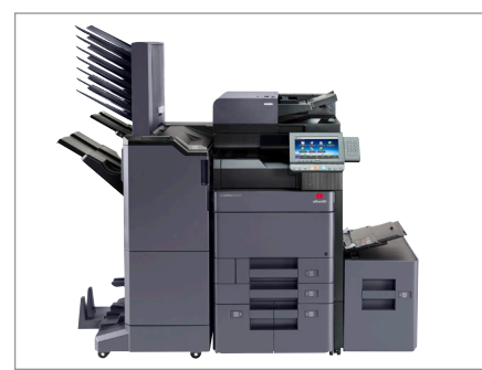
d-Copia 6000MF mit DP-7110 + PF-7110 + PF-7120 + DF-7110 + BF-730 + MT-730