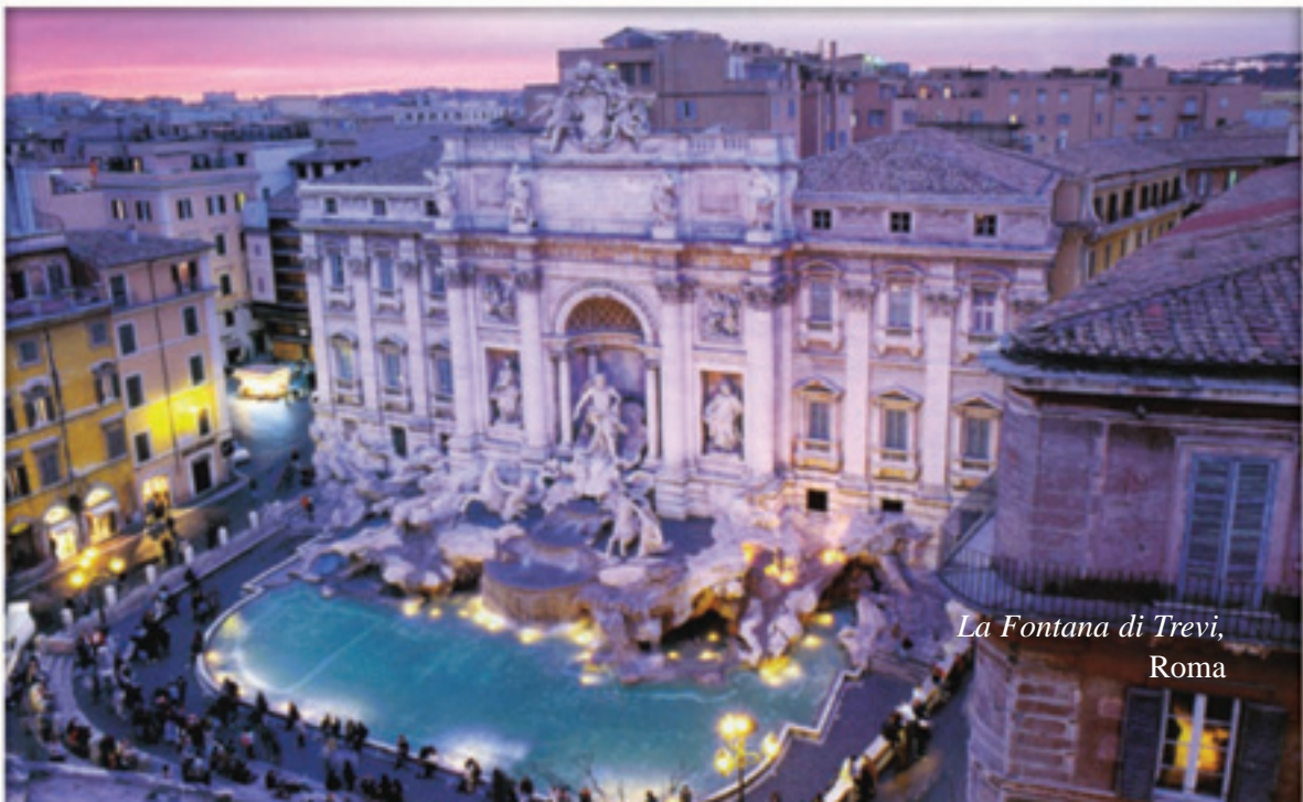
La Fontana di Trevi, Roma

Controllate le soluzioni a pagina 191. Siete soddisfatti?