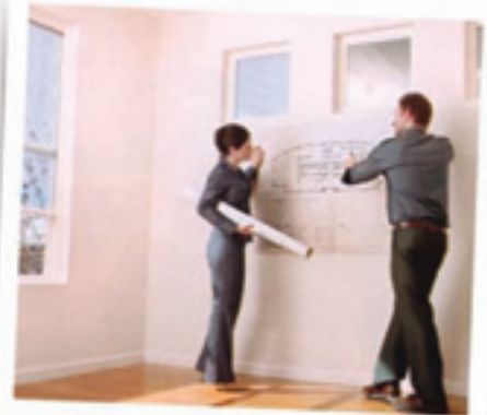
una nuova casa