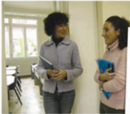
un nuovo corso