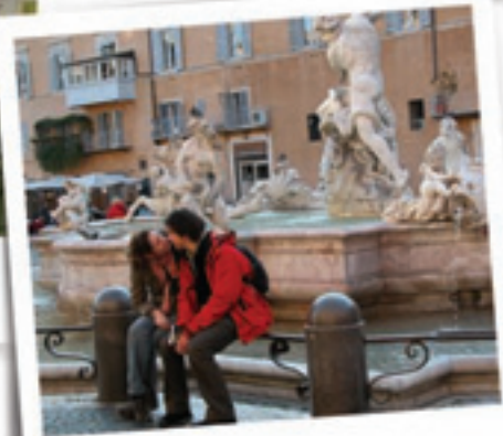
un nuovo amore