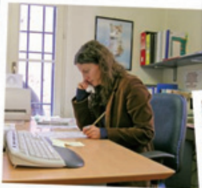
un nuovo lavoro