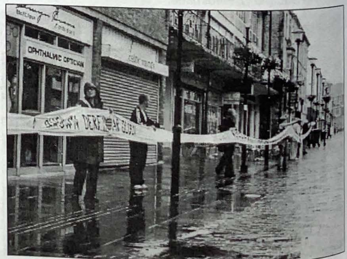
Pen-y-bont ar Ogwr

Cysyllter â: Pete Thompson ar 01656 648817