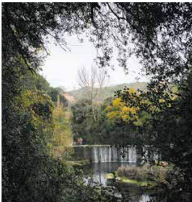
Presa situada a l'altura de la font de la Riera, al riu Ripoll.

L'ens supramunicipal ha demanat 1,5 M€ del fons Next Generation per portar-ho a terme