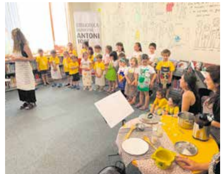
La 'Rebel·lió a la cuina' va tenir lloc a la biblioteca, dissabte passat. || CEDIDA

Dissabte mateix, es va fer un assaig conjunt a Matadepera, on els matadeperecs van oferir als de Castellar un bon berenar preparat per les famílies i una selecció de contes de la biblioteca relacionats amb el menjar i l'alimentació. + || M. ANTÚNEZ