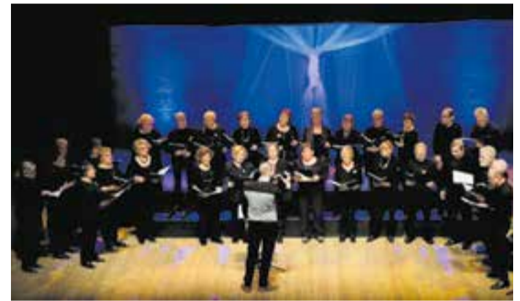
Concert coral de la Coral Xiribec, amfitriona del XXVIII Musicoral. || CEDIDA

1992, la Coral Xiribec de Castellar del Vallès convida corals d'arreu a una trobada que pretén ser una festa del món coral al nostre municipi. Les corals convidades arriben de la geografia catalana, de l'estat i també d'Europa, estimulant la convivència dels cantaires d'arreu amb els de Castellar. La festa coral culmina amb el concert que es fa habitualment el dissabte a la tarda i el posterior ressorpò obert a tots els assistents. † || M. ANTÚNEZ