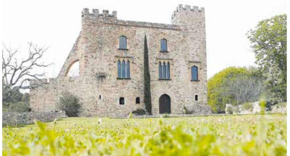
El Castell de Clasquerí serà un punt de trobada al proper itinerari 'Un tomb per la història' del CECV-AH.

D'altra banda, ja impulsats per la junta anterior però aturats per la pandèmia, el dia 3 de juny s'entregaran els I Premis de Recerca de Batxillerat