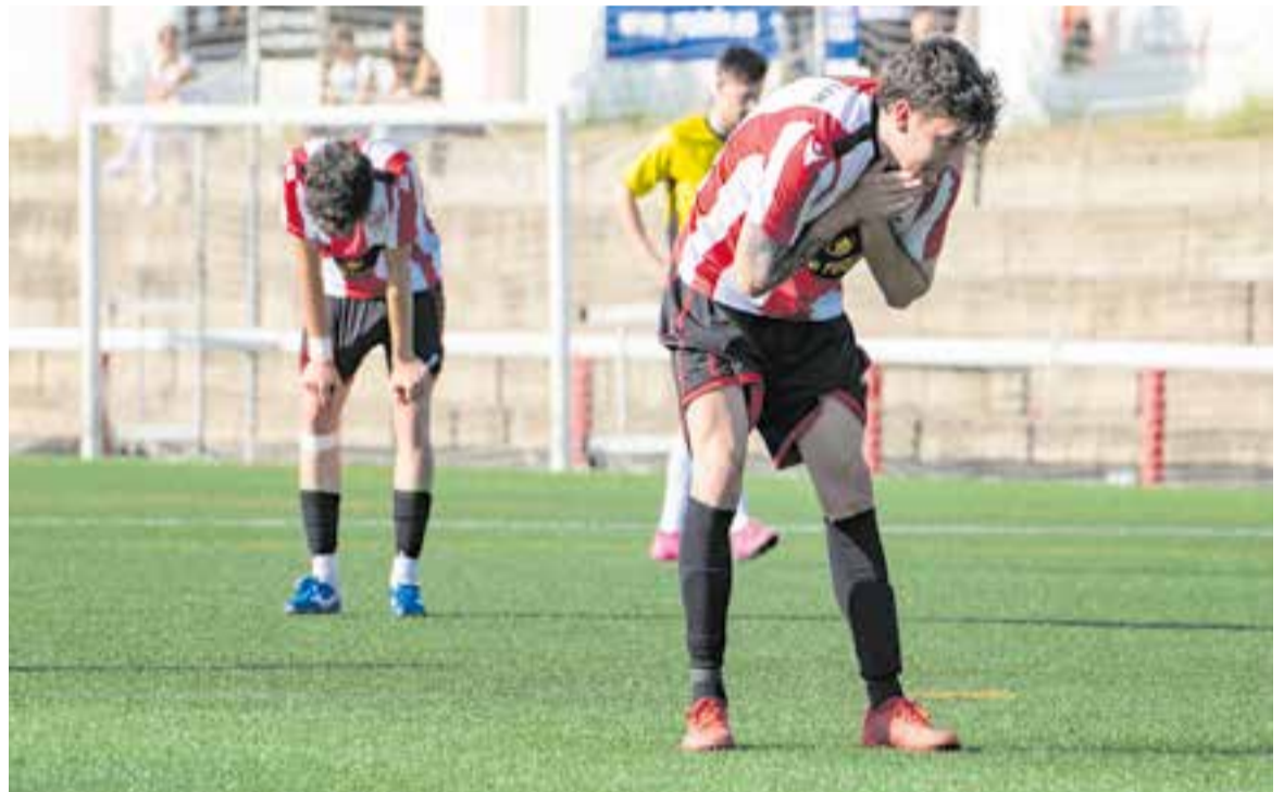
L'equip va perdre l'oportunitat de lluitar per l'ascens a Primera Catalana després de caure amb la Pirinaica. || A. SAN ANDRÉS

El Castellar tancarà una temporada en què va créixer des de l'inici, però la crisi de resultats entre el gener i el març ha condemnat la trajectòria per complet. En aquest període es van guanyar 10 punts dels 33 possibles (2 victòries, 4 empats i 5 derrotes) i es va acumular una gran quantitat de lesions, baixes i sancions que van capgirar els plans i la moral d'un equip que va trigar a sortir del pou. La recuperació a l'abril, juntament amb la davallada de la Pirinaica, va posar l'ascens a tocar, i es va recuperar una diferència de 13 punts, una possibilitat que finalment s'ha esvaït després de caure contra els manresans. +