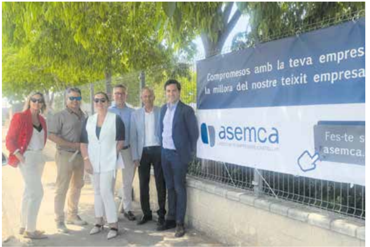
Membres de la junta directiva d'Asemca davant de la primera lona que ha col·locat a l'exterior del Centre de Serveis.

Justament la setmana passada, coincidint amb l'inici de la campanya de l'Asemca, es va donar a conèixer una enquesta entre empresaris en que