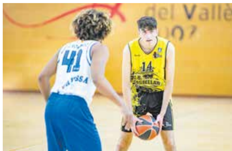
El CB Castellar ha de guanyar i superar l'average per jugar el play-out. || A.S.A.

Aquest diumenge (19.00 h) l'equip s'enfrontarà al CN Tàrrrega buscant la promoció. + || A.S.A.