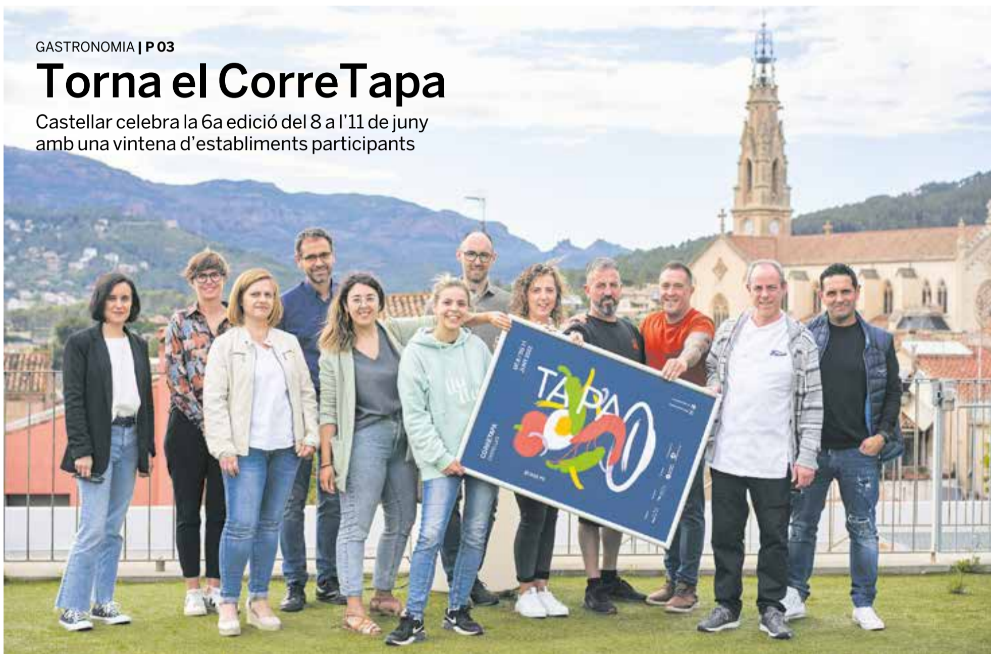
Representants municipals i dels col·lectius i establiments que donen suport a l'edició d'aquest any del CorreTapa en una imatge d'aquest dimecres amb el cartell de l'esdeveniment.

Castellar celebra la 6a edició del 8 a l'11 de juny amb una vintena d'establiments participants