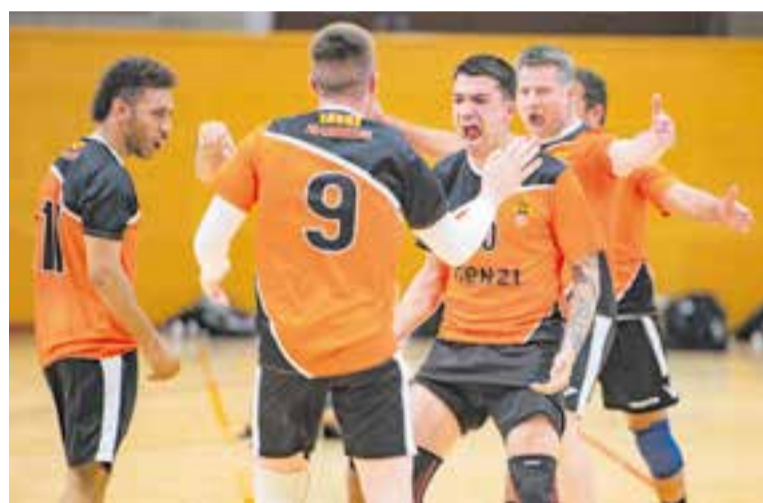
El sènior masculí és davant d'una oportunitat d'or per ascendir a Primera.