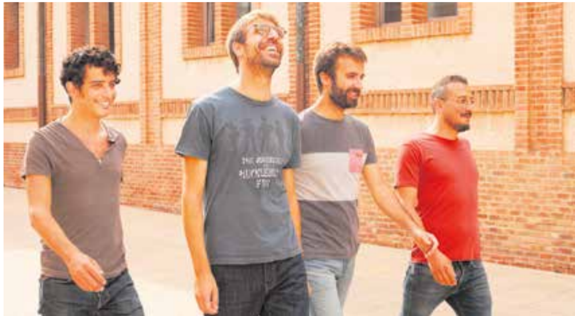
Imatge promocional de la nova gira del grup Manel, que actuarà dissabte. || M. GRAU

Tot i que la banda no coneixia la plataforma Suma ni les iniciatives que ha dut a terme per aconseguir recursos per atendre la diversitat a les aules, o les accions de sensibilització, Maymó mostra el seu suport a les reivindicacions de l'entitat, “a