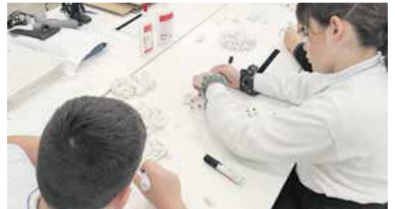
Alumnes de cinquè de FEDAC creant objectes per a la cooperativa. || FEDAC

Durant el curs escolar són els mateixos infants els qui creen, desenvolupen i gestionen la cooperativa escolar, des del seu plantejament formal i fins a la comercialització, amb el suport dels membres que conformen la comunitat educativa, l'administració local, les empreses i altres entitats del municipi. Enguany, per a la creació de Fedixos els i les alumnes han fet una aportació de capital de 5 euros cadascun per, posteriorment, dissenyar els prototips, dur a terme la fase de producció i crear estratègies de màrqueting i comunicació. A més, després d'un procés participatiu, s'han decidit destinar els beneficis d'aquesta cinquena edició a la protectora d'animals Caldes Animal. + || REDACCIÓ