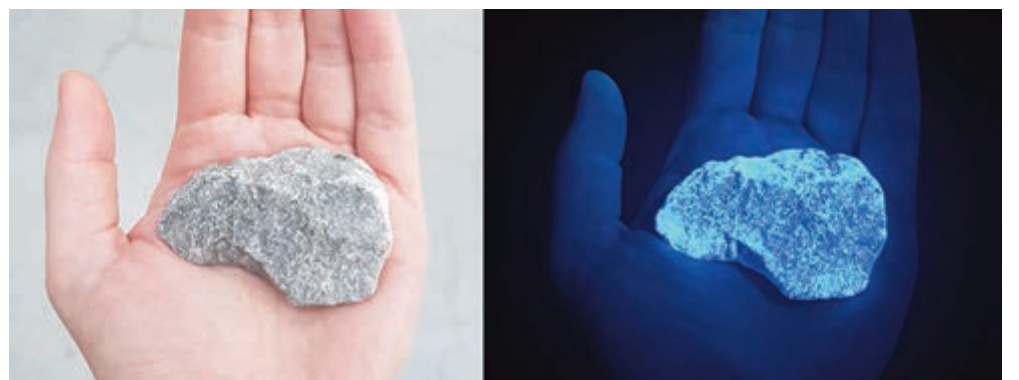
De stenen van het lichtmonument (Studio Roosegaarde)

Het tijdelijk lichtmonument 'Levenslicht' is op 16 januari gepresenteerd in Rotterdam. Het bestaat uit 104.000 lichtgevende herdenkingsstenen, die de 104.000 Joden, Roma en Sinti vertegenwoordigen die in de Tweede Wereldoorlog uit Nederland zijn gedeporteerd. In het donker lichten de herdenkingsstenen op. De stenen van het project Levenslicht zijn nu verspreid over ruim 170 Nederlandse gemeenten, waaronder Castricum. "Dit tijdelijk lichtmonument maakt in die gemeenten de leegte en het gemis tastbaar van deze grote groep landgenoten die tijdens de oorlog is vermoord, louter en alleen om wie zij waren", zegt comitévoorzitter Gerdi Verbeet.