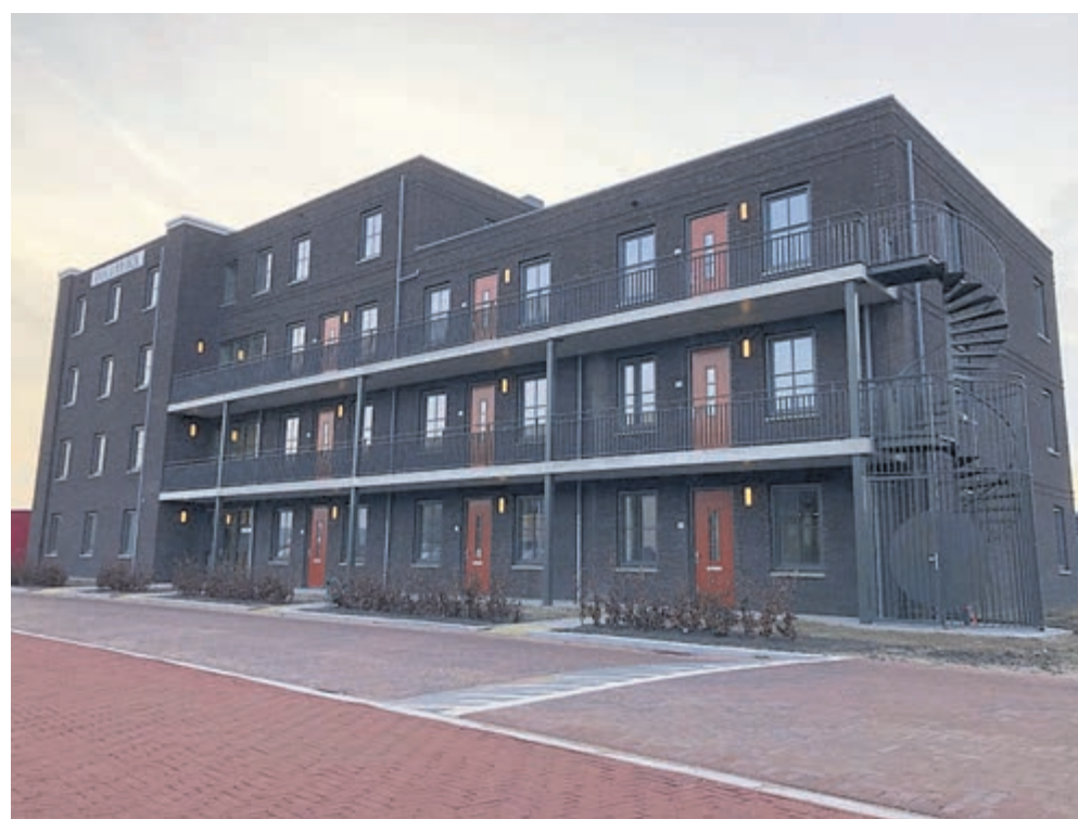
Complex Duc van Tol aan de Berkenlint in Limmen

47 jaar in haar eengezinswoning te hebben gewoond, verhuist zij