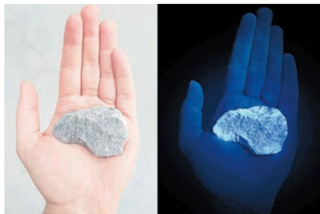
Steentjes die in het donker oplichten en doven

Het lichtmonument bevindt zich bij het Joods Monument (Dorpskerk) en werd op 24 januari door de burgemeester onthuld. Het bestaat uit een ronde plaat, waarop de lichtgevende steentjes zijn gelegd. Daarna zal het nog een periode te zien zijn.