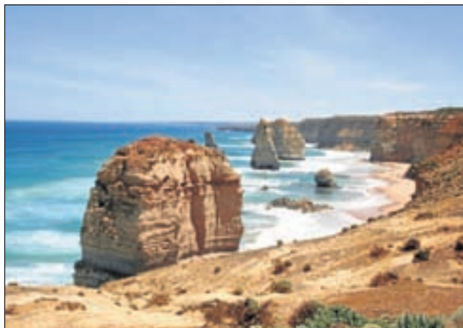
De mooie kust van Australië

school en was ervan overtuigd. „Later ga ik naar Australië.” Dia's van opa en oma die af en toe naar hun zoon en schoondochter in Australië gingen, hadden zijn passie voor dat land aangewakkerd. Uitgestrekte landschappen tot aan de horizon, groot en weids, met voor ons vreemde dieren, planten en