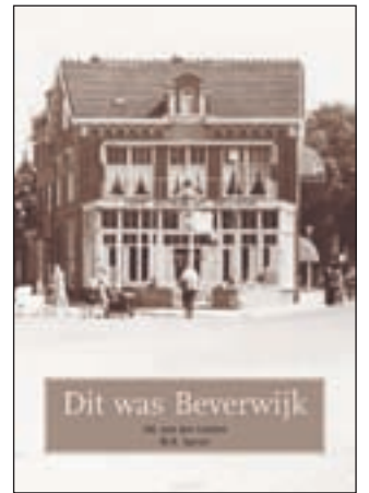
Op de omslag van het boek staat een foto van café restaurant Bellevue op de kop van de Breestraat

Beverwijk - 'Dit was Beverwijk' is een uniek nieuw boek van Jan van der Linden (Stichting Prentenkabinet van der Linden) en Wim Spruit (auteur). Het boek telt 160 bladzijden en ruim 600 niet eerder in boekvorm gepubliceerde foto's. De samenstellers van het boek nemen de lezer mee naar het Beverwijk van de jaren '50 en '60 met af en toe een uitstapje naar een verder verleden. In zes hoofdstukken wordt de lokale geschiedenis verteld. De ontwikkeling van aardbeïendorp tot staalstad komt aan de orde, bekende en minder bekende Wijkers, van de patioscholen tot de Bisschoppelijke Kweekschool, van Brasil op Weg tot de KGII, van het Sint Aagtendorp tot Terpischoré en van Willem Vessies tot een serie Beverwijkse burgemeesters. Van 13 tot en met 18 november is er een foto-expositie in het Kennemer Theater. De expositie, die vrij toegankelijk is, omvat ongeveer 400 foto's van diverse afmetingen. Gekozen is voor foto's van evenementen, straten en gebouwen in Beverwijk en bekende Bever-