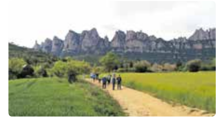
Prop de 700 persones fan la Marxa del Pelegrí Dm, 02/04/2019 | Regió 7