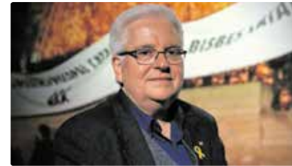
"Volem bisbes formats en la tradició catalana, la Tarraconense" Ds, 06/04/2019 | El PuntAvui