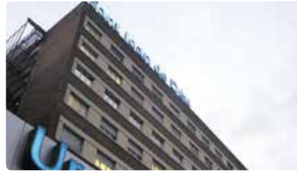
Sant Joan de Déu lidera la posada en marxa d'una xarxa social sobre malalties rares Dc, 03/04/2019 | El PuntAvui