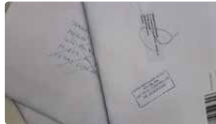
Soto del Real veta la revista "Catalunya Religió" als presos Dv, 22/03/2019 | El Nacional