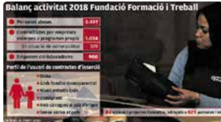
Formació i Treball, de Càritas, va ajudar un miler de persones a trobar feina el 2018 Dc, 10/04/2019 | El PuntAvui