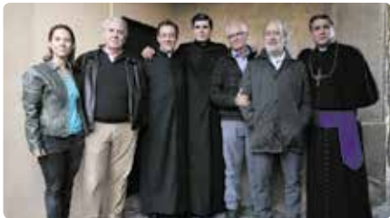
Acaba el rodatge de la pel·lícula per a televisió 'L'enigma Verdager', coproduïda per TV3 Dg, 07/04/2019 | CCMA