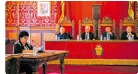
Arquebisbe Pujol: "Demano perdó si les meves paraules han ofès a algú" Dl, 08/04/2019 | Diari de Tarragona