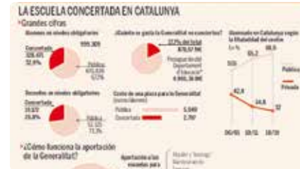
La Generalitat gastaria 780 milions més a l'any si totes les escoles fossin públiques Dv, 29/03/2019 | Expansión