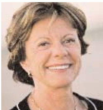
Neelie KROES Comisaria de Competencia

El 24 de noviembre de 2005, el CCBE ha enviado su respuesta tras el informe de la Dirección General de Competencia de la Comisión Europea (DG Competencia) sobre la competencia en el sector de las profesiones liberales.