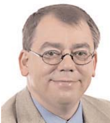
Klaus-Heiner Lehne eurodiputado

Klaus-Heiner Lehne, miembro del Parlamento Europeo (PPE), que fue en varias ocasiones ponente de la Comisión en materia de derecho de sociedades, se ha pronunciado durante una reunión del Comité de Derechos de Sociedades del CCBE el 29 de noviembre de 2005. Se ha pronunciado respecto del estado actual del Plan de Acción sobre el derecho de sociedades y el trabajo que queda por hacer. Con ocasión de esta reunión, ha mencionado algunos temas relativos a la transferencia transfronteriza de las sedes de las sociedades, a la Sociedad Privada Europea y a los derechos de los accionistas.