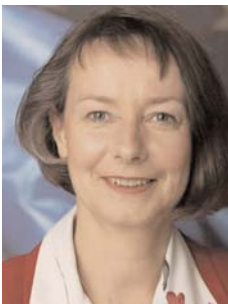
Evelyne Gebhardt eurodiputada

El 22 de noviembre la Comisión de Mercado Interior y de Protección del consumidor del Parlamento Europeo ha votado las enmiendas a la propuesta de directiva sobre servicios. Durante la reunión, la ponente Sra. Gebhardt ha insistido en que los grupos políticos han encontrado compromisos sobre 20 enmiendas importantes. Solo quedan tres temas controvertidos: artículo 2: campo de aplicación de la directiva, artículo 16 principio del país de origen y las condiciones relativas al derecho de establecimiento.