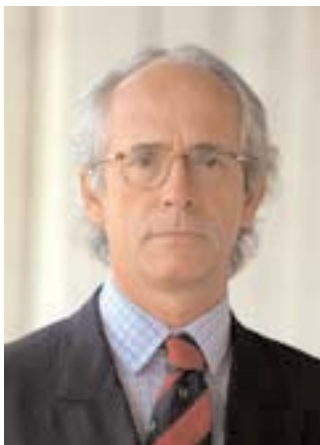
Manuel Cavaleiro Brandão Presidente de CCBE

Empieza el año 2006. Este nuevo año se anuncia en tiempos de lucha, pero también en tiempos de esperanza. Un tiempo de resistencia, pero también de progreso y de construcción.