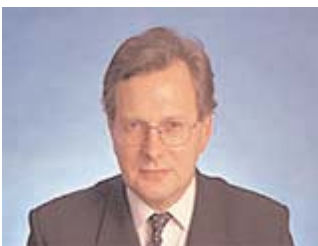
Lord Goldsmith de Allerton QC, Fiscal General del Reino Unido