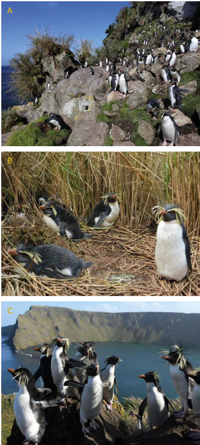
Figure 2: Habitat des gorfous sauteurs du Nord. A) Colonie nichant sur des rochers, île de Gough. B) Habitat formé de touffes de Spartina sur Nightingale. C. Saint-Paul.

Les manchots de l'île d'Amsterdam effectuent des boucles autour de leur colonie pendant la période d'incubation, parcourant en moyenne 230 km pour se nourrir, mais certains oiseaux peuvent s'éloigner jusqu'à 410 km. Les fronts océaniques semblent être une composante importante de l'habitat, tout comme pour de nombreux grands prédateurs de l'océan Antarctique (Bost et al. 2009). Les oiseaux qui couvent se nourrissent généralement bien plus près de leur colonie (entre 8 et 80 km) et restent dans les eaux peu profondes du littoral sur le plateau océanique (C.A. Bost, données non publiées). Pendant qu'ils gardent les poussins, les gorfous peuvent parcourir jusqu'à 600 km au sud d'Amsterdam. Après leur mue, les manchots d'Amsterdam effectuent des déplacements de grande ampleur, parcourant jusqu'à 2 200 km depuis leur colonie, essentiellement de manière longitudinale, parfois jusqu'au sud-ouest de l'Australie, sans retourner à terre. La plupart des oiseaux prennent la direction du sud-est, longeant la dorsale de l'océan Indien, et se nourrissent au sud de la frontière sud du front subtropical, profitant des eaux profondes (3 000-3 500 m), lesquelles affichent des anomalies de température de surface et des concentrations en chlorophylle très hétérogènes (Thiebot et al. 2012).