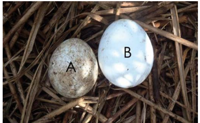
Figure 3: Comparative size of A and B eggs.

Pendant leur mue annuelle, les manchots doivent retourner à terre et rester aussi immobiles que possible pour conserver leur énergie pendant plusieurs semaines jusqu'à ce que leur nouveau plumage ait poussé et soit imperméable.