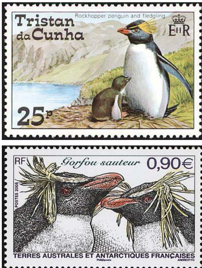
Figure 4: Deux exemples de timbres postaux représentant des gorfous sauteurs du Nord.

des otaries près des sites d'échouage ont été rapportés, mais ils seraient rares. On estime que l'otarie à fourrure subantarctique ( Arctocephalus tropicalis ), le pétrel géant et le labbes ont également un impact sur les tendances des populations de manchots Eudyptes vivant ailleurs (Horswill et al. 2014, Morrisson et al. 2017).