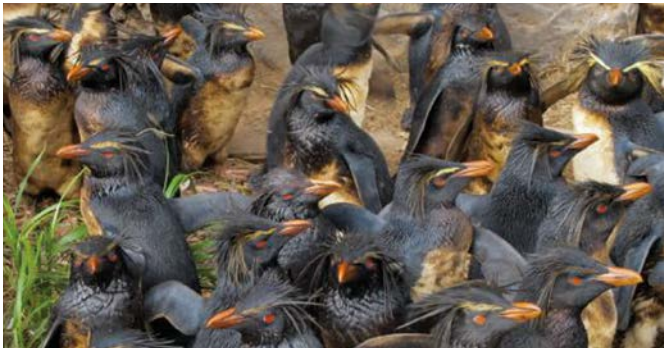
Figure 5: sauvetage de manchots mazoutés après le naufrage du MS Olivia sur l'île de Nightingale

néanmoins la nécessité de mener des recherches supplémentaires sur les impacts des microplastiques.