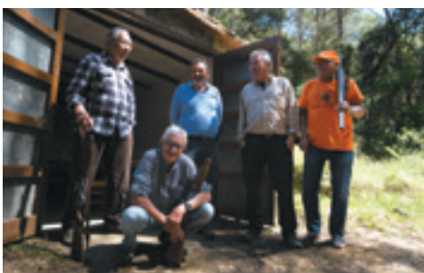
Reportatge ANAR A CACERA AMB LA COLLA DE FLAÇÀ