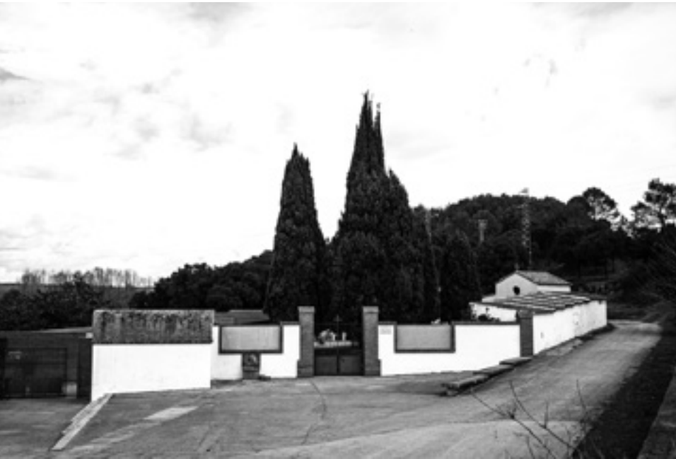
Vista general del cementiri de Flaçà.

D'aquestes objeccions, en podem extreure conclusions molt interessants. La primera és que ja hi havia certa sensibilitat envers les persones que morien fora de la fe catòlica, i això donava peu a entendre que l'Església estava perdent el monopoli en aquest afer tan mundà. L'acta també ens demostra que hi havia la consciència que, en cas d'epidèmia, el cementiri quedaria petit. En darrer terme, també revela que hi havia la voluntat d'aplicar autòpsies i preocupar-se per les causes de la mort. Lentament, la modernitat anava penetrant en totes les capes i els estrats de la societat.