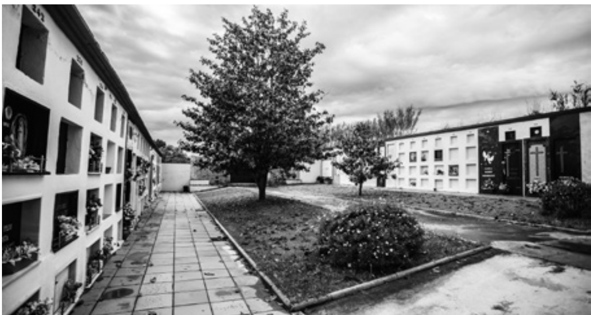
Cementiri de Sant Joan de Mollet. Fotografia de Martí Navarro