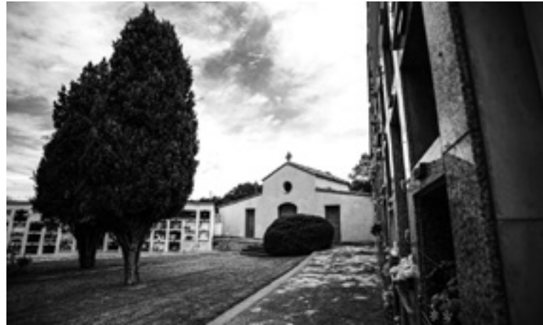
Antics edificis auxiliars (sala d'autòpsies i dipòsit de cadàvers) a banda i banda amb la capella al centre.

D'aquest indret es conserva una fotografia del 1957 en què es pot veure com hi havia un mur que anava