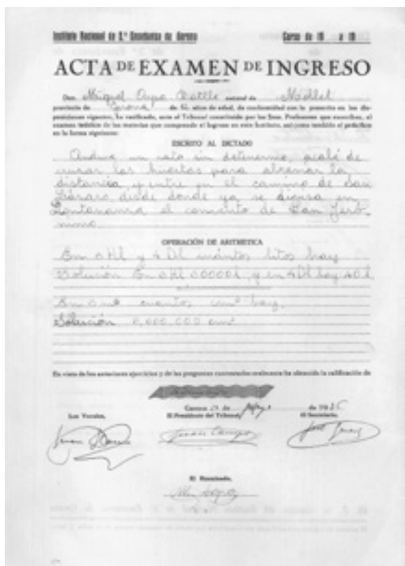
Acta de l'examen d'ingrés a l'Institut de Miquel Arpa l'any 1936. Procedència: Arxiu Històric de Girona