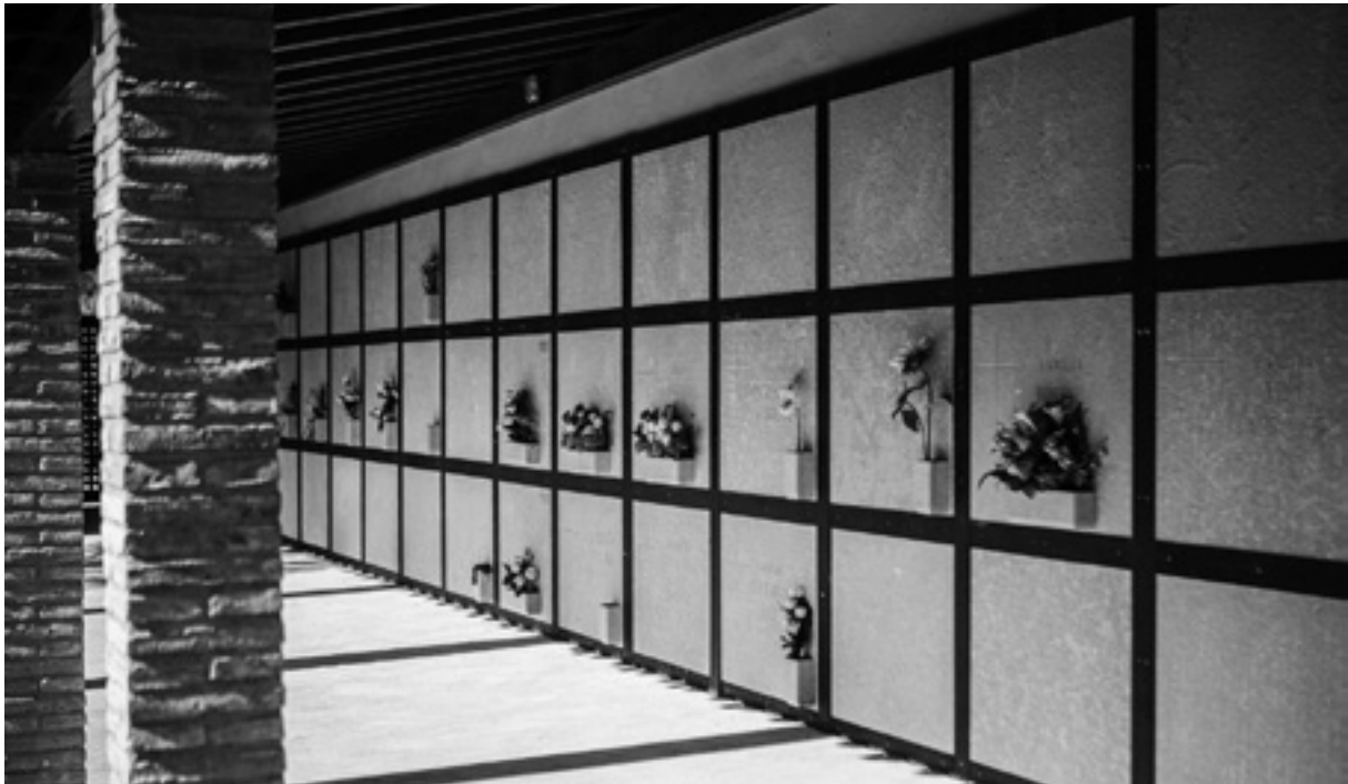
Totes les làpides del cementiri nou són iguals, d'una pedra de color sorrenc.

Però les obres no van evitar allò inevitable. A finals dels anys noranta i ja començats els 2000 es va començar a projectar el cementiri nou. El cementiri al mig del poble ja no podia ser, quedava petit, no tenia capella i la gent al final s'hauria queixat. Ara, el cementiri queda apartat. La modernitat ordena les coses. Tenir-ho tot ordenat i organitzat fa pensar que es controlen les coses, que es dominen. Fins i tot s'arriba a pensar construint un cementiri. La modernitat ordena les coses i la mort ha d'anar lluny de la plaça del poble i lluny dels ulls de tothom. Per seguretat. No la mireu.