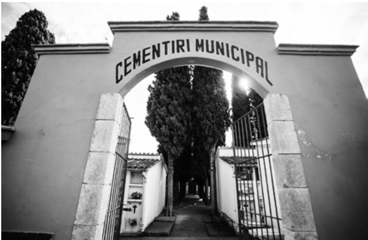
Entrada principal del cementiri de Celrà.

Es va inaugurar cap al 1850, tot i que el trasllat dels cadàvers del cementiri vell fins al nou, prop de can Guimerri, va finalitzar el 1864.