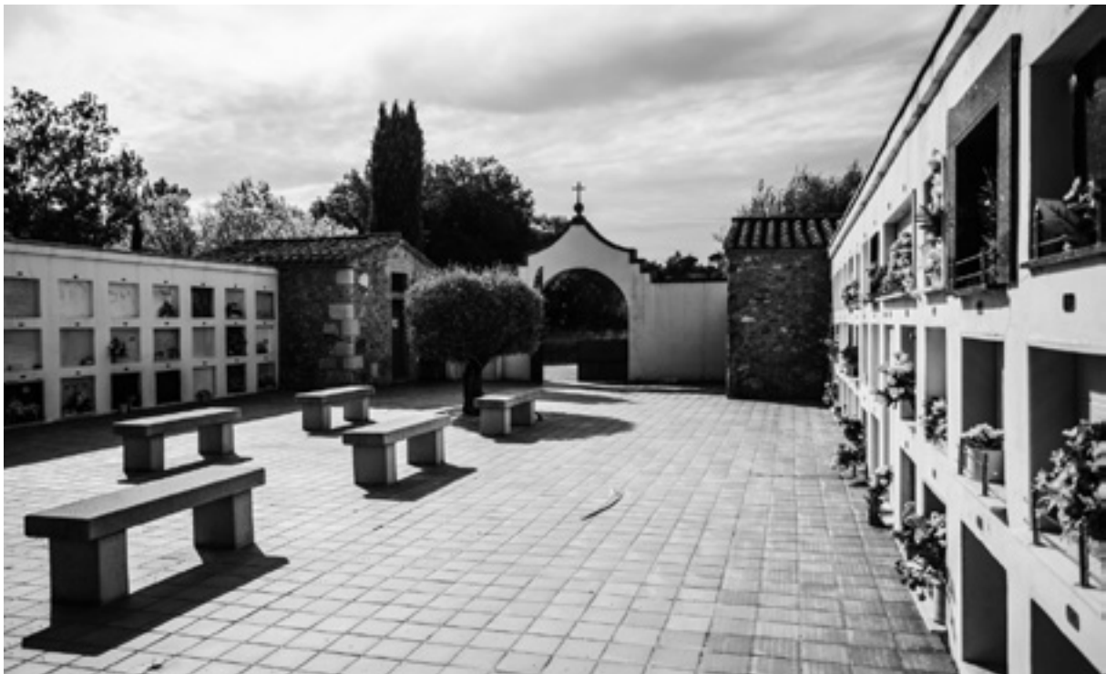
Els últims deu anys el cementiri ha estat remodelat.

El cementiri es va construir el 1936 als afores, en un camp propietat de can Mastorrent, mentre que el fossar adossat a l'església va desaparèixer el 1963.