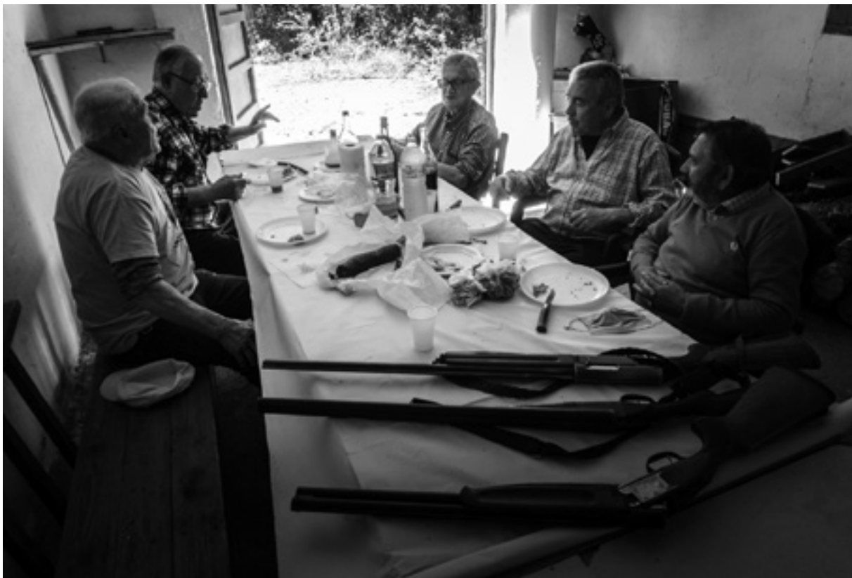
Esmorzar de caçadors dins de la barraca.