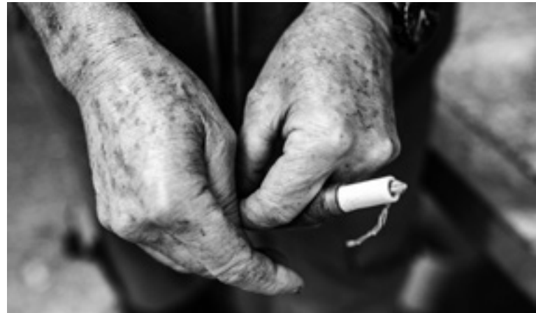
Les mans d’en Martí amb un botet.

FURA: les fures o furons ( Mustela putorius furo ) són mamífers carnívors de la varietat domèstica del turó comú. Les fures solen tenir un pelatge marró, negre, blanc o mesclat, tenen una mida mitjana d’aproximadament cinquanta centímetres (incloent-hi una cua d’uns tretze centímetres), pesen vora un quilogram i tenen una longevitat natural d’entre set i deu anys.