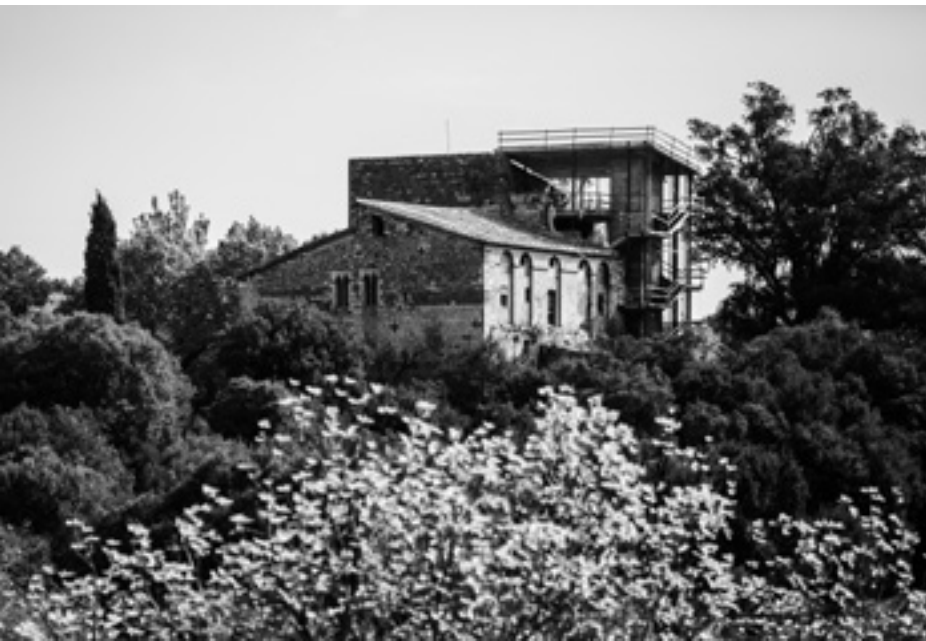
Obres a la torre Desvern de Celrà.