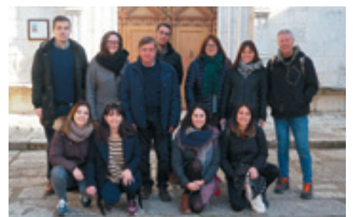
Reportatge LA LLERA DEL TER CELEBRA ELS VINT-I-CINC ANYS