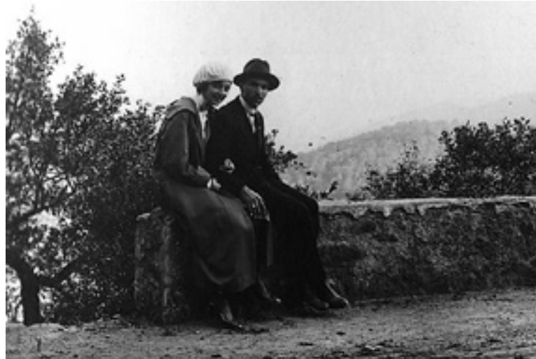
Júlia Quintana i en Miquel Mateu de joves.

Fou alcalde de Barcelona des de la seva caiguda a mans de les tropes nacionals, el 27 de gener de 1939, fins al 18 d'abril de 1945, ambaixador d'Espanya a París del 1945 al 1947, president de la Caixa de Pensions (l'actual La Caixa) del