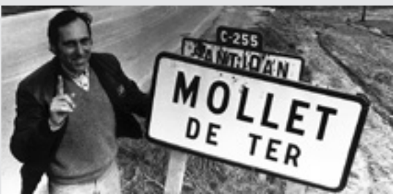
Sant Joan de Mollet