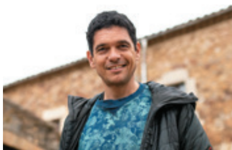
El retrat de l'artista PABLO MOLINERO, EN UN BON MOMENT PROFESSIONAL