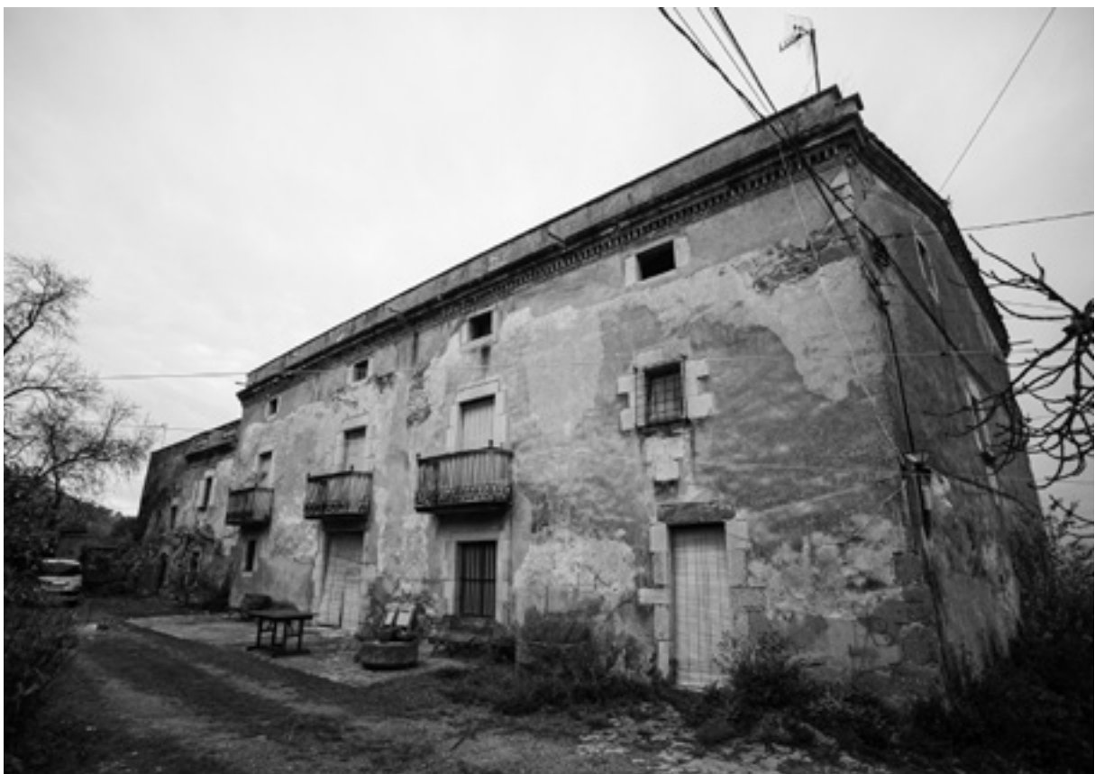
Façana de Can Quintana de Celrà.