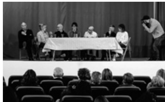
Presentació a Sant Joan de Mollet, març 2020.