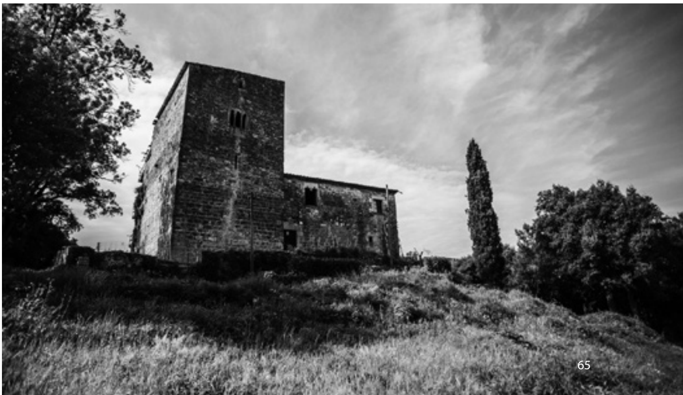
La façana de cara nord de la torre medieval, des d'on s'albiren els Pirineus.