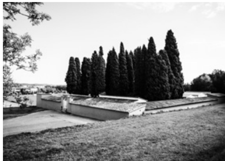
Vista exterior del cementiri de Celrà des del carrer de l'Aulet.

Com que el cementiri estava allunyat de la població i el trasllat dels fèretres a espatlles dels portadors era molt molest, el 1919, en un ple de l'Ajuntament, un regidor proposà la compra d'un cotxe fúnebre per fer el trasllat, però no s'acceptà per la falta de diners. El 1927 (ple del 2 de març) es donà conformitat a la compra d'un carruatge i el mateix any es va fer un concurs per a la conducció del carro de morts. Es va decidir que al conductor del carro se li pagarien 500 pessetes anuals i que havia de portar el seu animal, que havia de ser de color negre. El servei va començar a partir de l'1 de gener de 1928. Es van fer unes ordenances municipals i hi havia tres preus: 50, 25 i 15 pessetes. Les