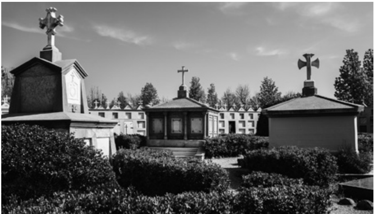
Interior del cementiri de Bordils.

Des de ben antic, totes les societats humanes acomiaden els seus difunts amb alguns rituals basats en les creences cosmològiques i religioses que comparteixen sobre el sentit de la vida terrenal i un possible més enllà.