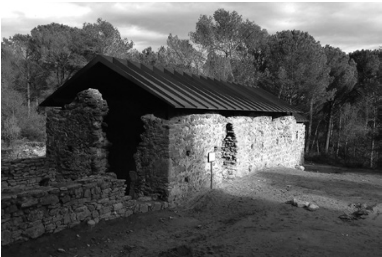
L'església de Sant Romanç de Sidillà, l'any 2016.