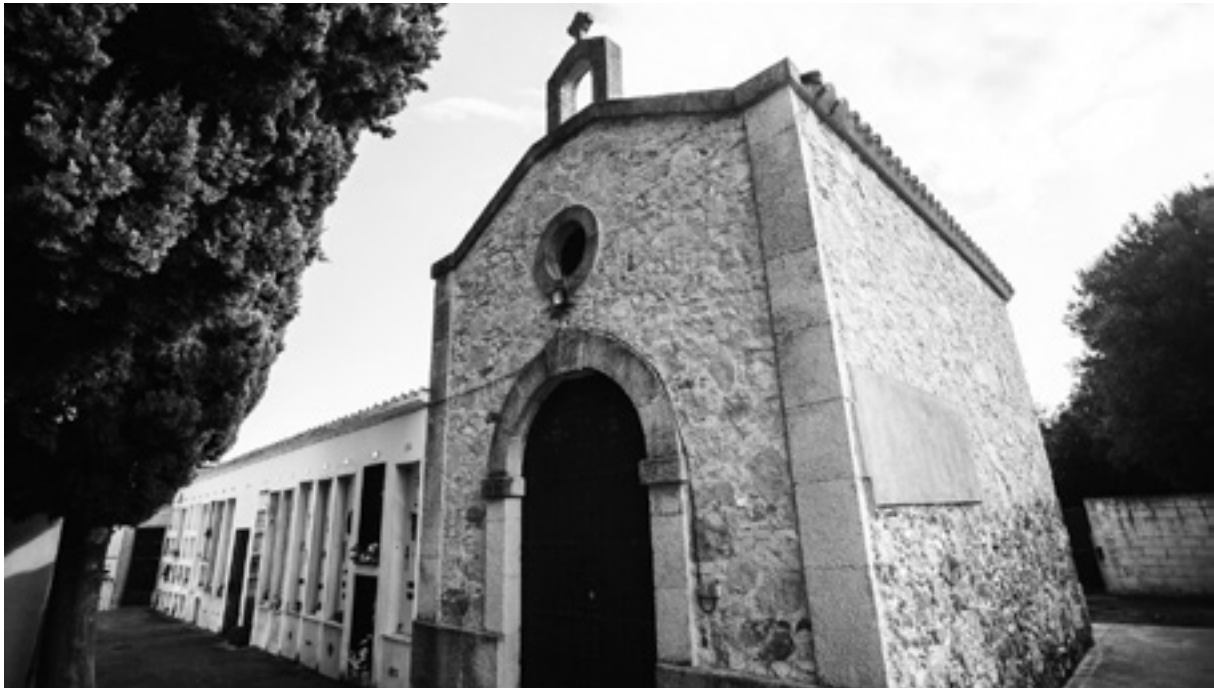
La capella del Sant Crist que es troba a l'interior del cementiri.