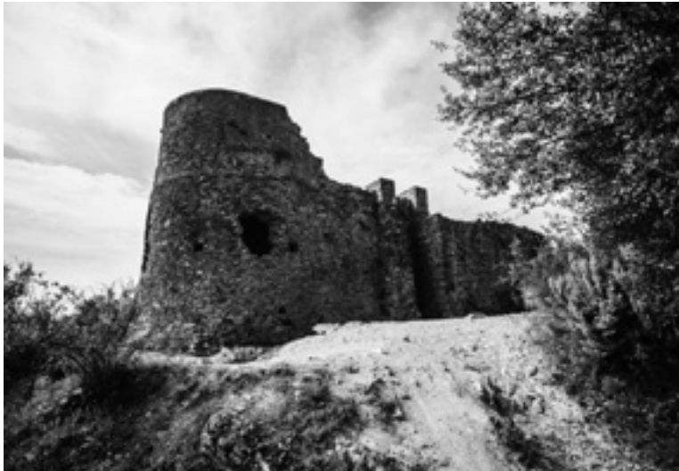
Ermita de Sant Miquel del Castellar (segle XV).

Sota aquest nom popular, que poc té a veure amb la realitat conservada fins avui, s'hi amaga un complex conjunt d'edificis d'èpoques diferents: una fortificació altmedieval, una ermita del segle XV i dues torres de la xarxa de telegrafia òptica del segle XIX. Malgrat els orígens clarament celranencs de l'indret, en l'actualitat aquest conjunt es troba a cavall dels municipis de Girona i Celrà.