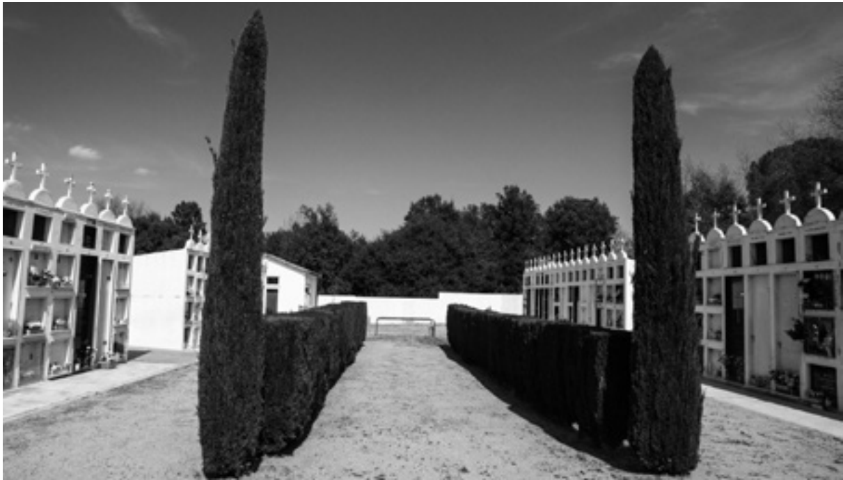
El cementiri, pintat de blanc i amb els nínxols acabats amb una creu, de Juià.