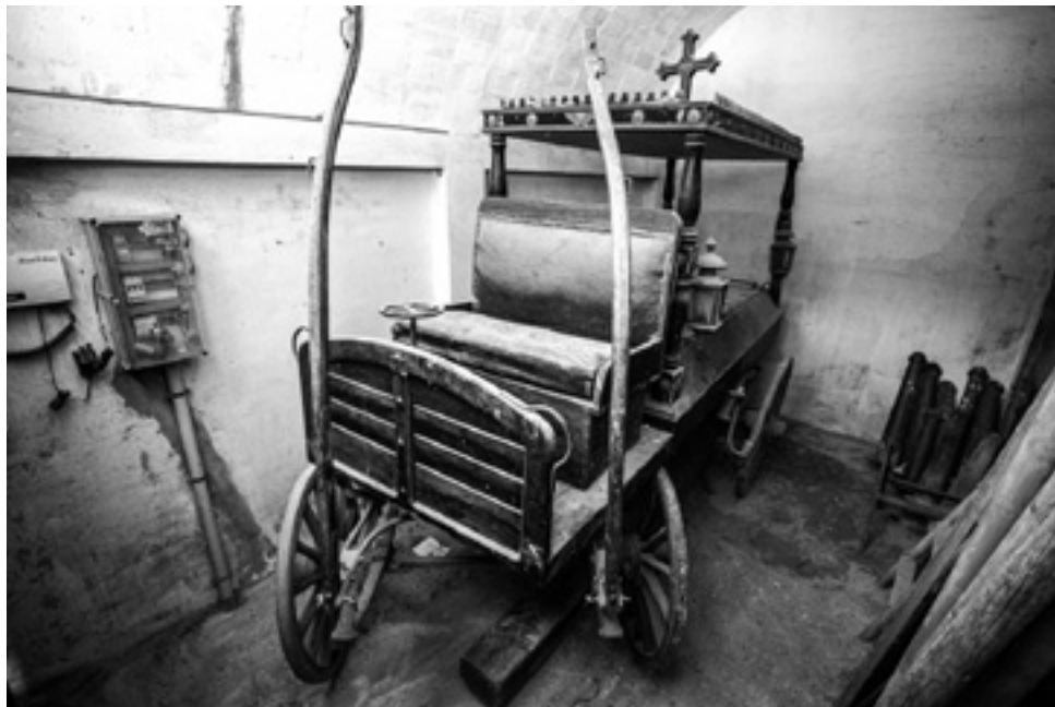
Carrossa funerària de Flaçà. Inicis del segle XX. Fotografia de Martí Navarro

L'accés principal, segons el plànol, havia de ser a través d'un gran arc de mig punt rematat per un