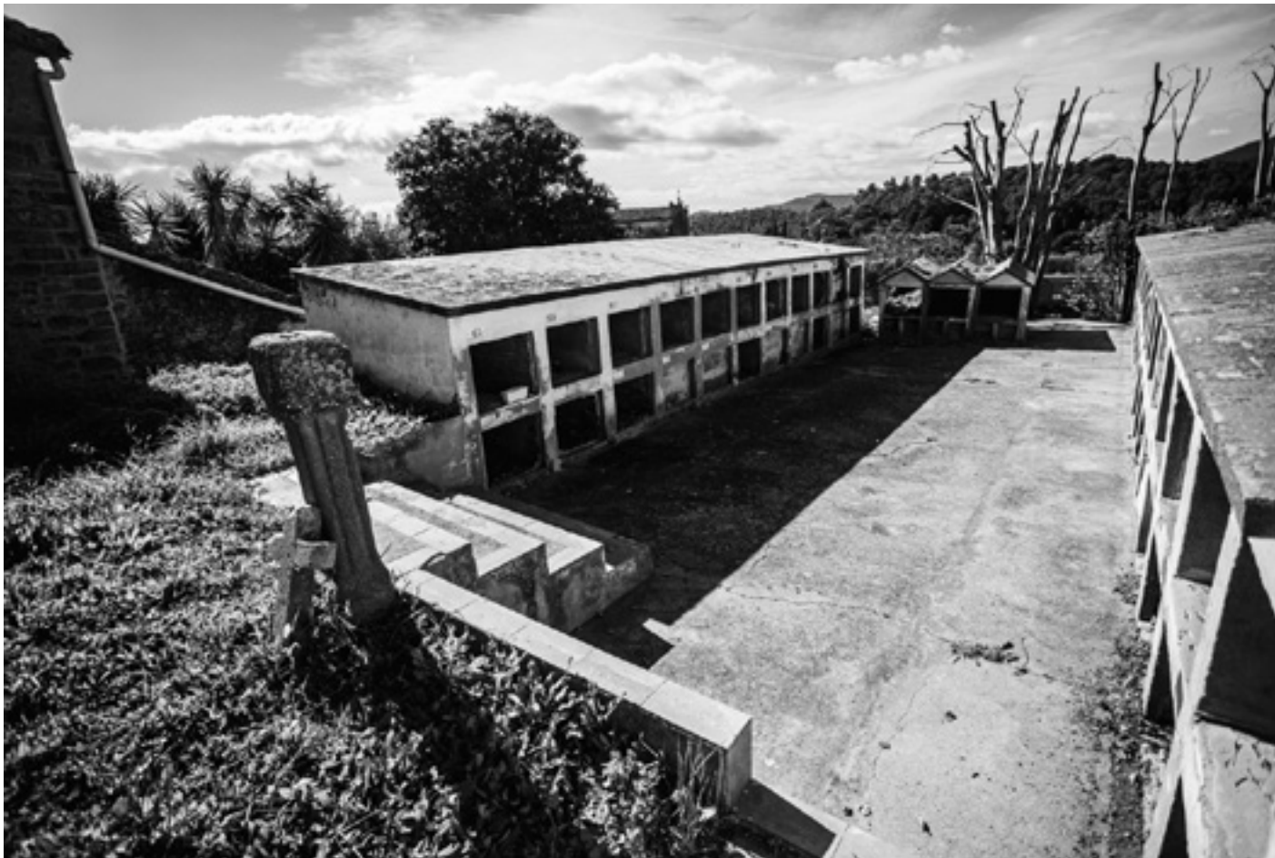
El cementiri vell de Madremanya ha estat al mig del poble fins ben entrat el segle XXI.

A Madremanya, quan es parla del cementiri, mai se sap ben bé de quin cementiri es parla, perquè n'hi ha dos. El cementiri vell és el de sempre i va ser l'únic fins fa ben poc. El cementiri nou és del 2010, es va construir als afores i s'hi van traslladar els nínxols del cementiri vell, que era ben bé al mig del poble. Però l'ambigüitat no s'acaba aquí. A Madremanya, quan es va al cementiri, al que sigui, tampoc se sap ben bé on s'ha anat. De cop, s'entra en una mena de casa, en una mena de jardí, en una espècie de claustre, o en un lloc secret esbatanat només a les Gavarres.