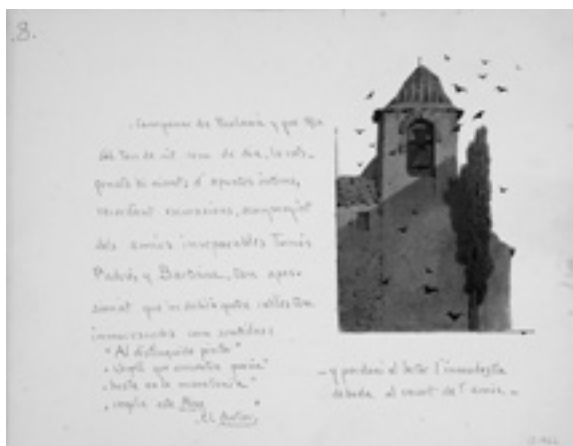
Modest Urgell. Dibuix del Campanar Parlavà, tinta a la ploma i aquarel·la sobre paper. 23'8 x 30'7cm. Cap a 1918. Museu Nacional de Catalunya

Modest Urgell i Inglada (Barcelona, 1839-1919) va ser un dels pintors més coneguts, admirats i cotitzats en el tombant del segle XIX al XX. La seva obra la podem relacionar amb el paisatgisme romàntic, molt lligat a la renaixença cultural que vivia Catalunya i a través de la qual es redescobria, de mica en mica, tot el territori durant tants anys oblidat.