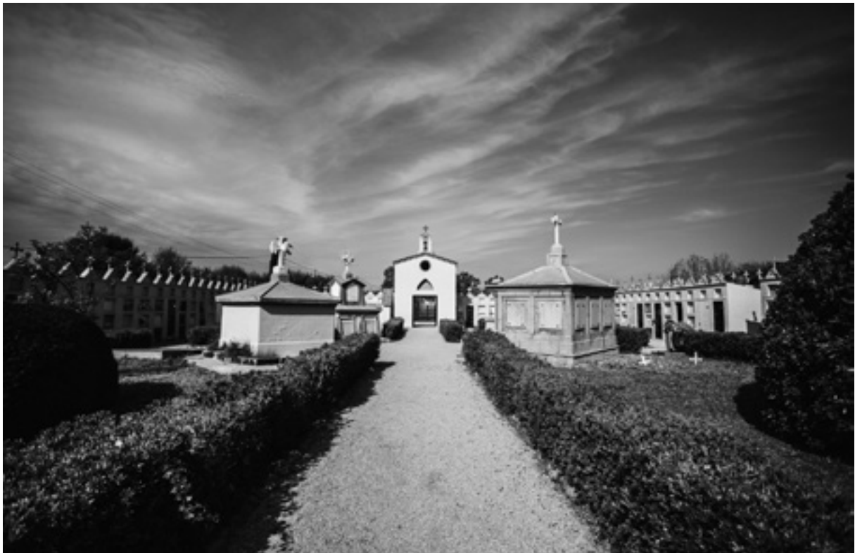
Tots els nínxols estan coronats per petit frontó i una creu de pedra.

El cementiri de Bordils és una obra municipal que reuneix uns