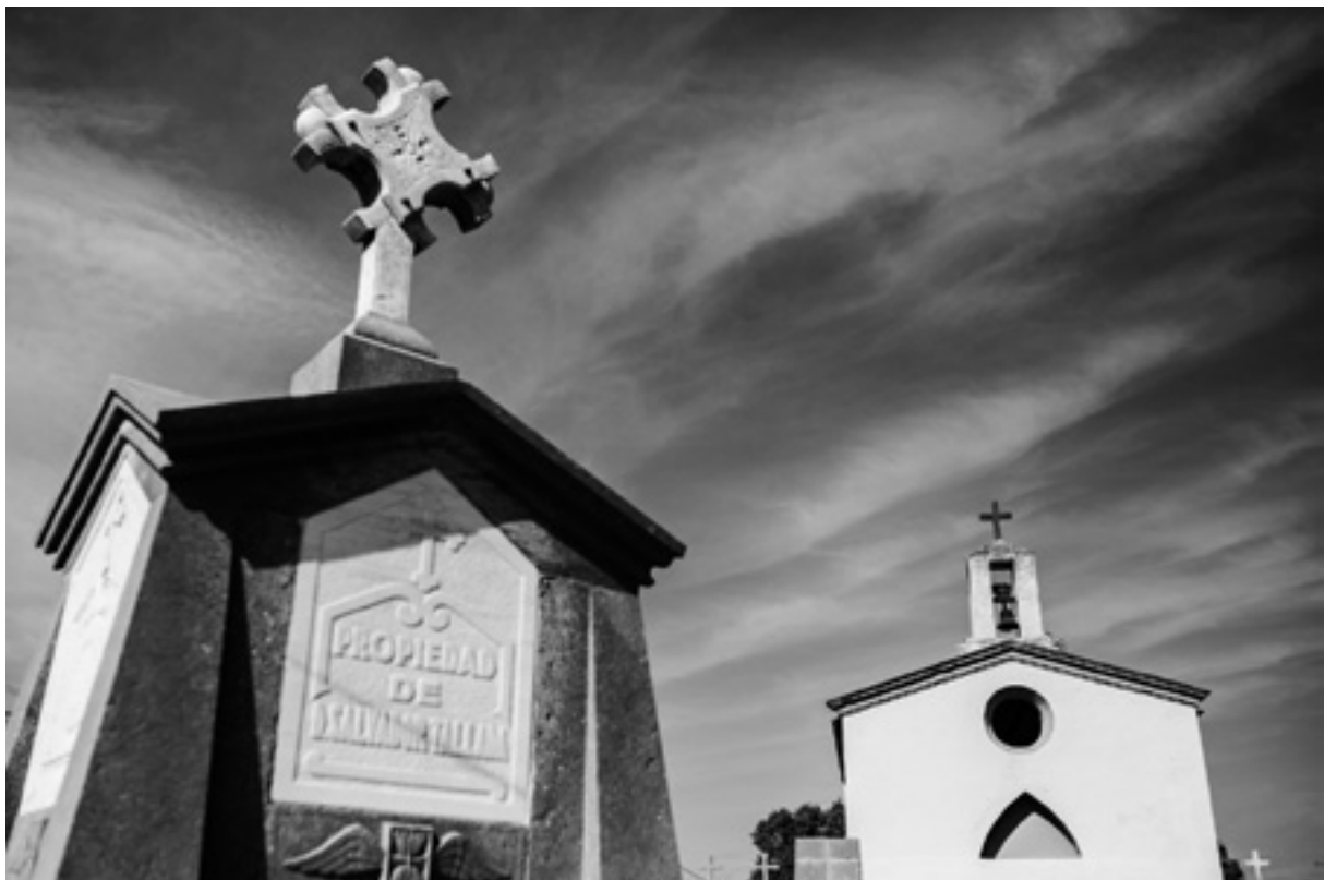
Un panteó i la capella del cementiri de Bordils.