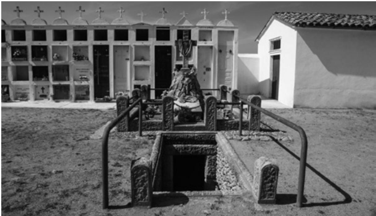
El panteó del cementiri de Juià.

una creu de la Penitència i el Sagrat Cor, obra de Guiu i Novoa de Figueres. Tot el conjunt està tancat amb unes barres de ferro, com també és de ferro la porta de la cripta, que amb tota probabilitat van fer els serrallers Cadenas de Girona, col·laboradors de Masó. Es baixa a l'interior per una escala feta de rierenc, amb la inscripció en tres escalons que diu "Pregueu/pels/morts".