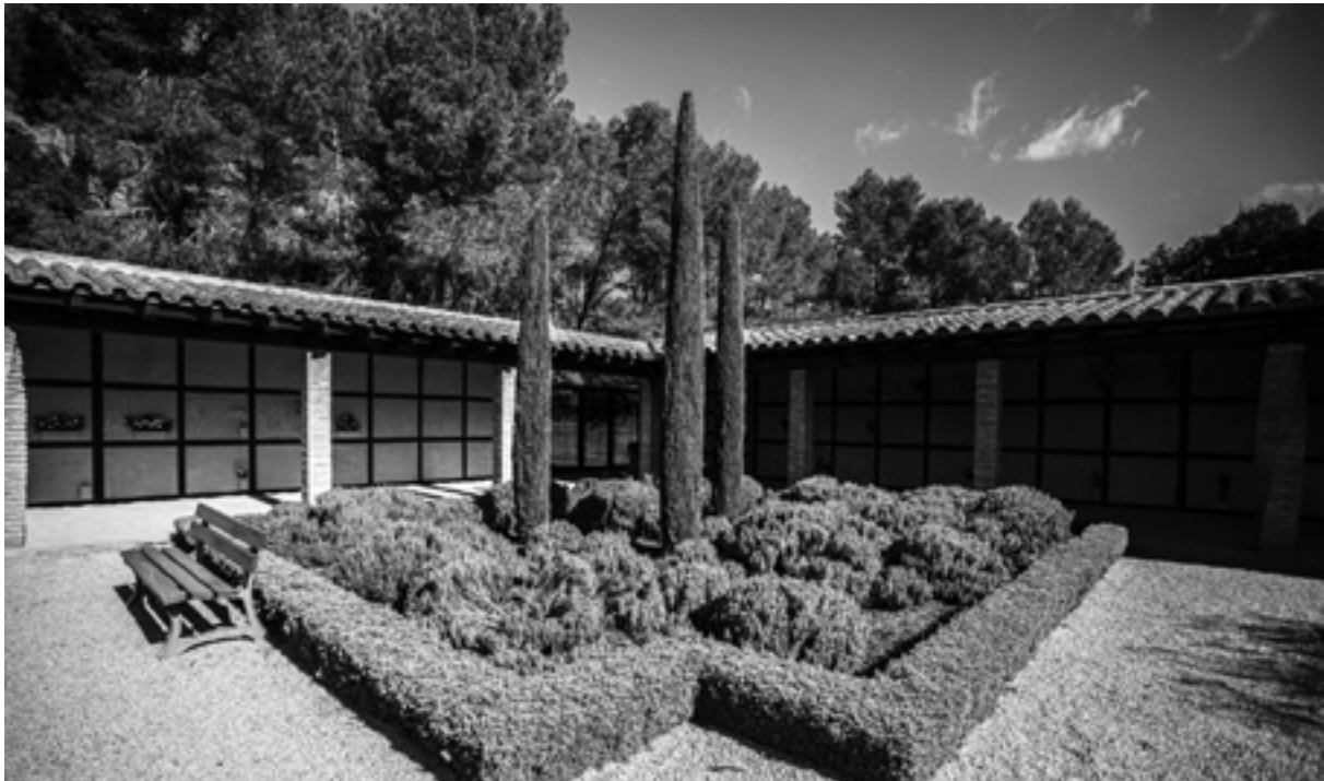
El cementiri nou és de planta quadrada. Al mig, hi té un jardí, una mena de claustre.

encara se sent el soroll metàl·lic sobre els carrers empedrats de Madremanya i la caixa tremolant.