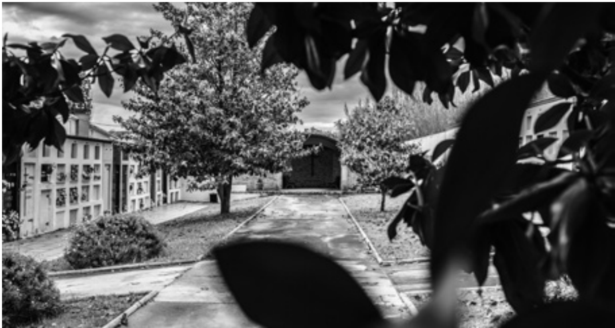
Vista interior del cementiri de Sant Joan de Mollet.

Sant Joan de Mollet és un municipi amb un passat poc estudiat, una població amb una història que es remunta a l'edat mitjana, ja que les primeres informacions escrites sobre la localitat daten de l'any 844. Tot i això, costa conèixer la història recent del poble i el cementiri és només un exemple d'aquest desconeixement.