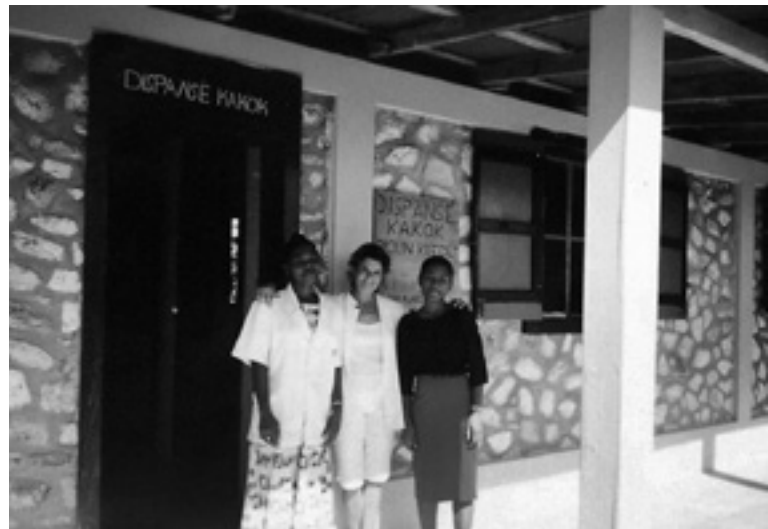
Dispensari de Kakok a l'illa.

La Rita s'estableix a Port-au-Prince des del 1986 fins al 2000, que és quan decideix marxar a una illa molt petita anomenada Île à Vache, situada al sud del