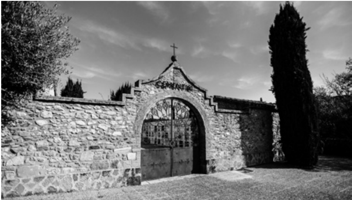
Façana recentment repicada.

L'Ajuntament de Sant Martí Vell recentment hi ha realitzat dues remodelacions. La primera va consistir a refer el teulat dels nínxols a partir de la legislatura del 2011. En la segona, entre el 2015 i el 2019, es va repicar la façana principal, es va enrajolar el terra i es va enjardinar l'espai. Les pedres de l'antiga sagristia ara queden al descobert a la façana principal. Els acabats són de maó i s'hi accedeix a través del portal i d'un arc coronat amb una creu. Unes lletres inequívokes de ferro oxidat formen la paraula "cementiri".