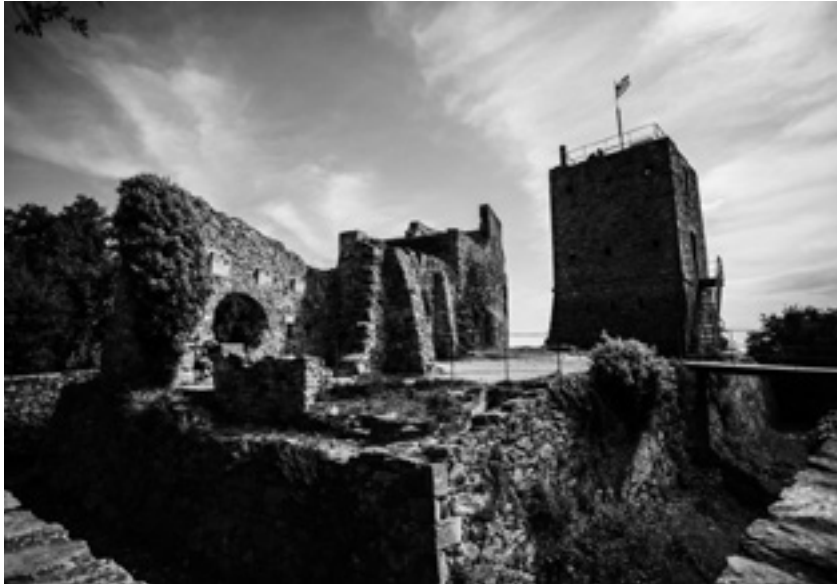
Vista actual del conjunt arquitectònic de Sant Miquel de Castellar.

(vers 1748), Josep Cornellà (1762-1779) i Miquel Domènech (vers 1797).