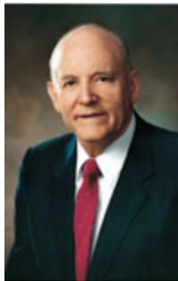
Howard W. Hunter