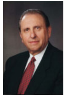
Thomas S. Monson