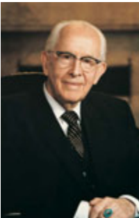
Ezra Taft Benson