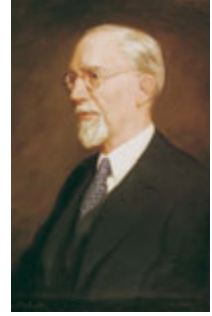
George Albert Smith