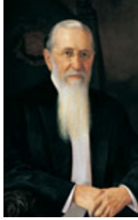
Joseph F. Smith