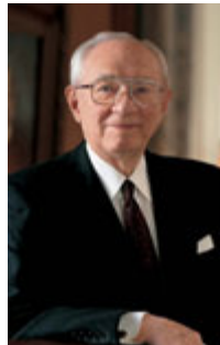
Gordon B. Hinckley