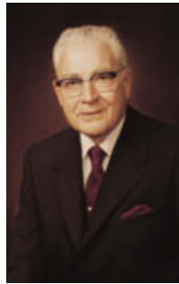
Harold B. Lee