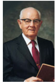
Spencer W. Kimball