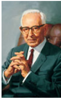
Joseph Fielding Smith