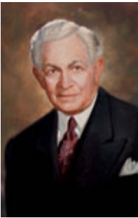
David O. McKay