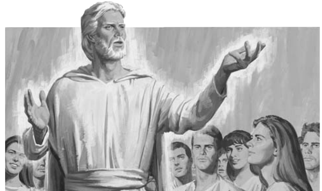
Vor himmelske Fader har udarbejdet en plan for frelse.

»Det jordiske liv er meget kort, men umådeligt afgørende.«