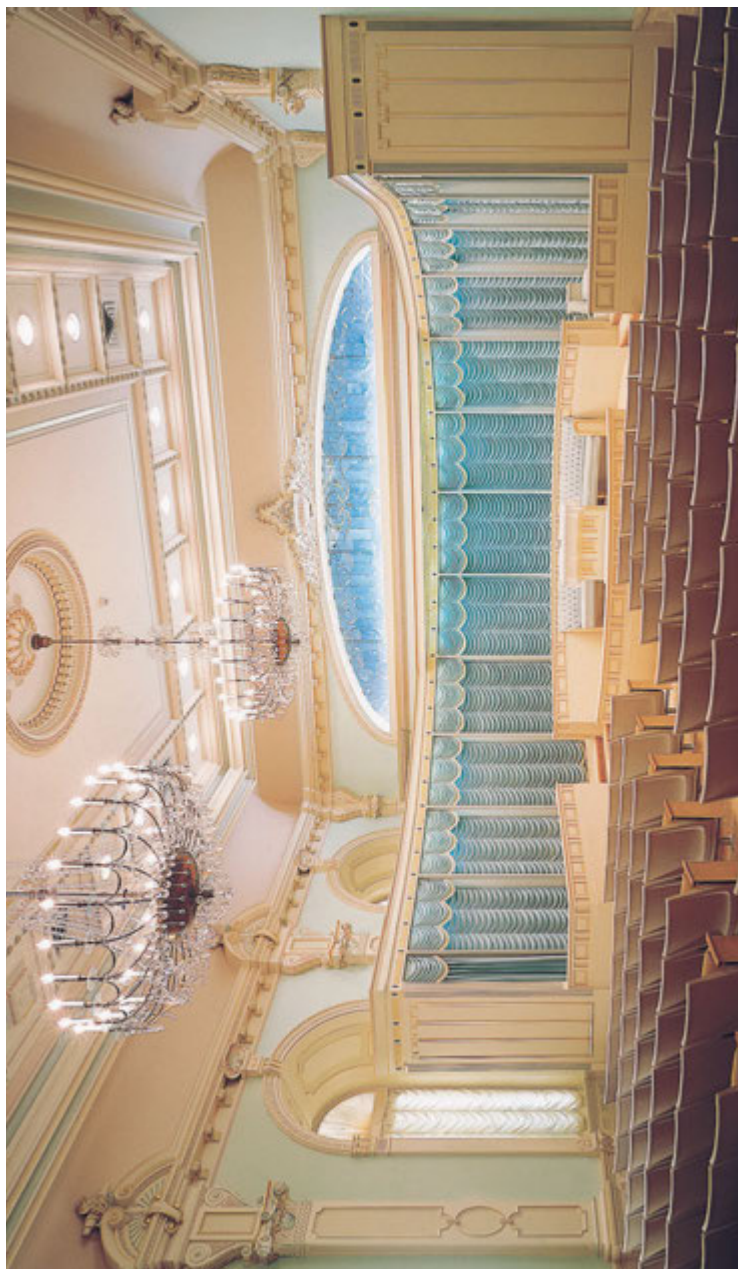
Terrestrinen huone Suolajärven temppelissä