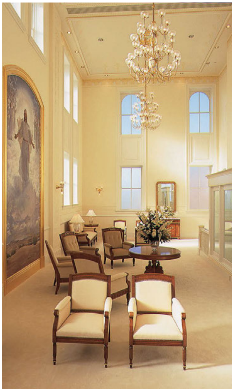
Selestinen huone Vernalin temppelissä Utahissa