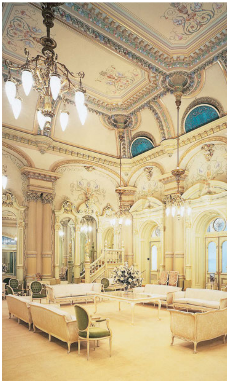
Selestinen huone Suolajärven temppelissä