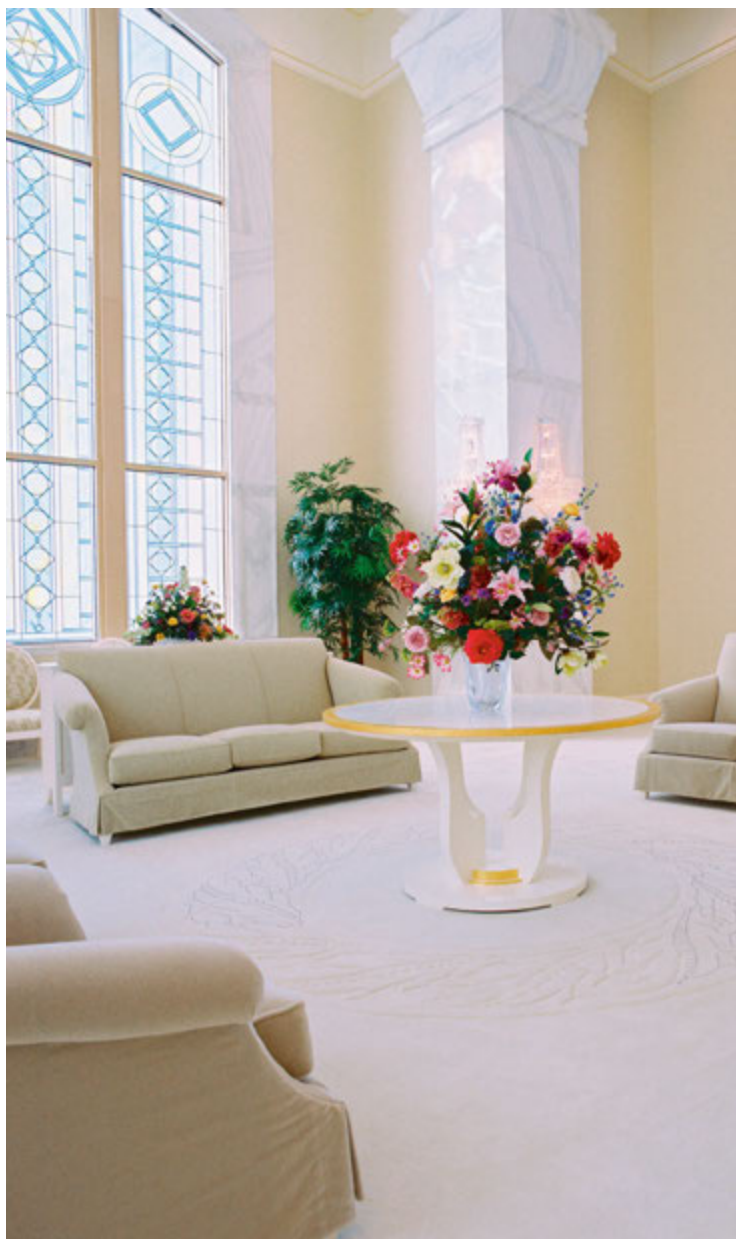
Selestinen huone Columbia Riverin temppelissä Washingtonissa