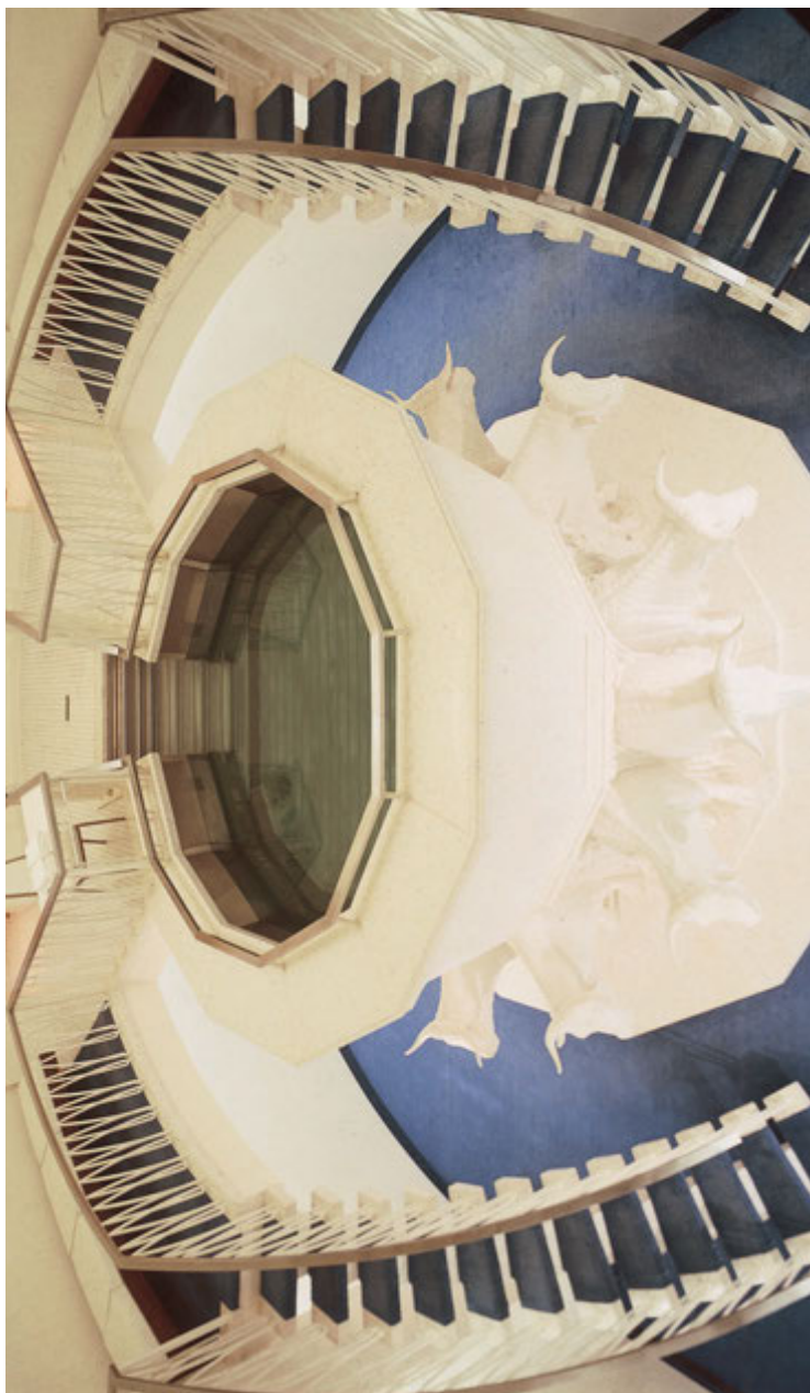
Kasteallas Washingtonin tempelissä