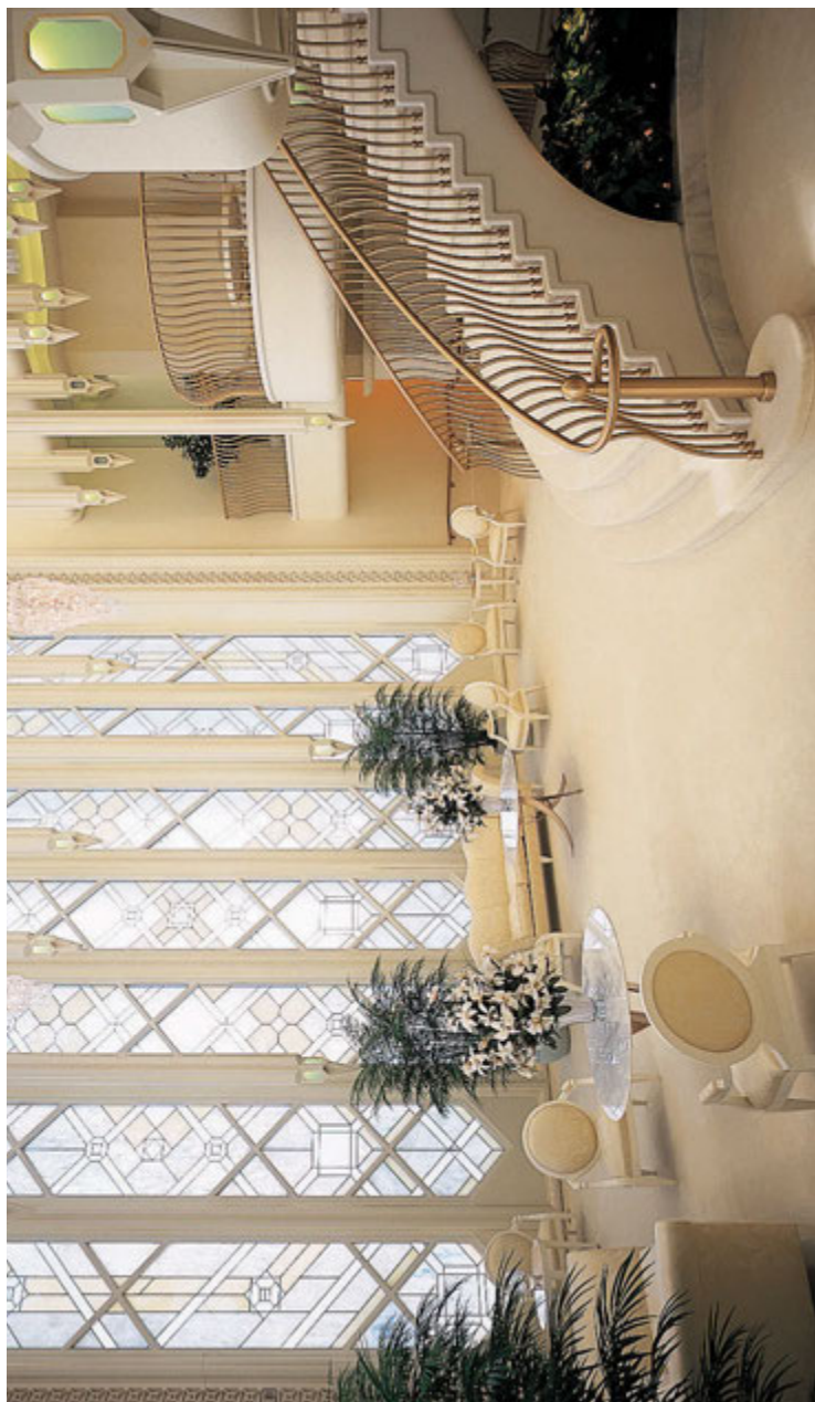
Selectinen huone San Diegon katedraalissa Kaliforniassa