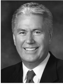
Dieter F. Uchtdorf forseti annar ráðgjafi í Æðsta forsætisráðinu