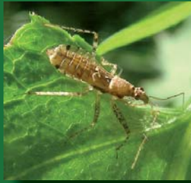
Figura 8. Nabidae