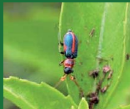
Figura 13. Melyridae