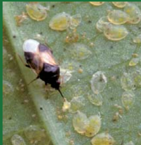
Figura 5. Anthocoridae