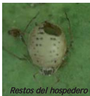
Restos del hospedero