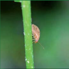
Figura 4. Hemerobiidae