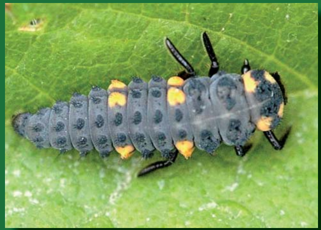
Adulto y larva de Coccinella septempunctata