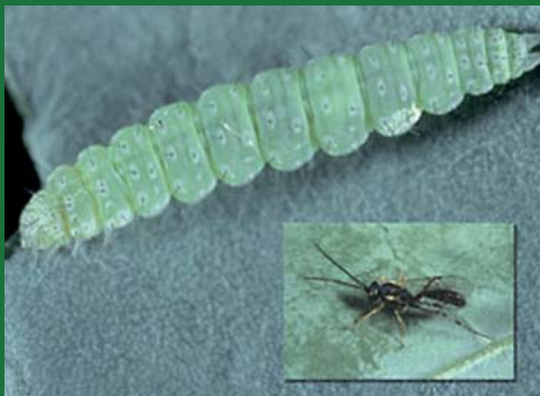
Koinobionte: Diadegma insulare