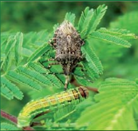
Figura 7. Pentatomidae