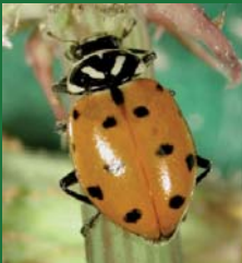
Figura 10. Coccinellidae