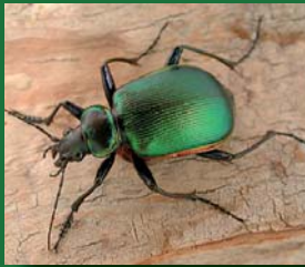
Figura 11. Carabidae