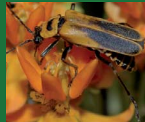
Figura 12. Cantharidae