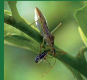
Figura 9. Reduviidae