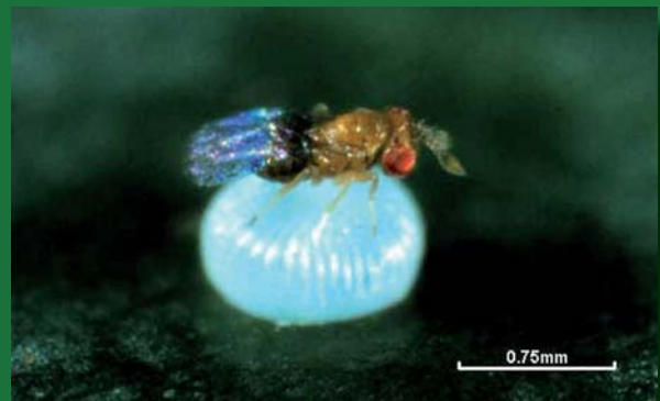
Idiobionte: Trichogramma pretiosum