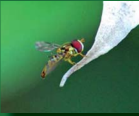
Figura 1. Syrphidae