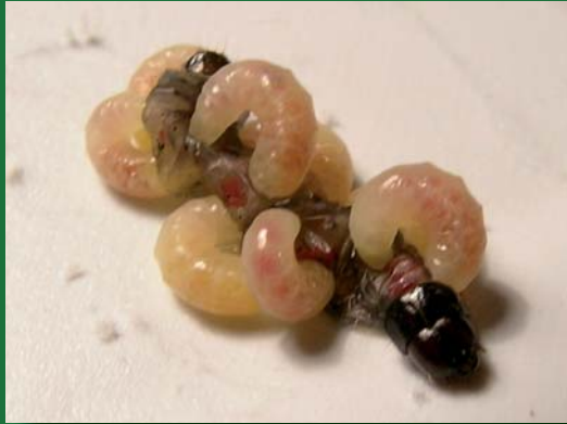
Gregarios. Endoparasitoide emergiendo del hospedero (izq.) y cocones (der.)