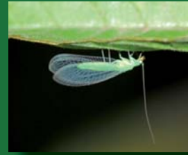
Figura 3. Chrysopidae