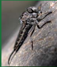
Figura 2. Asilidae