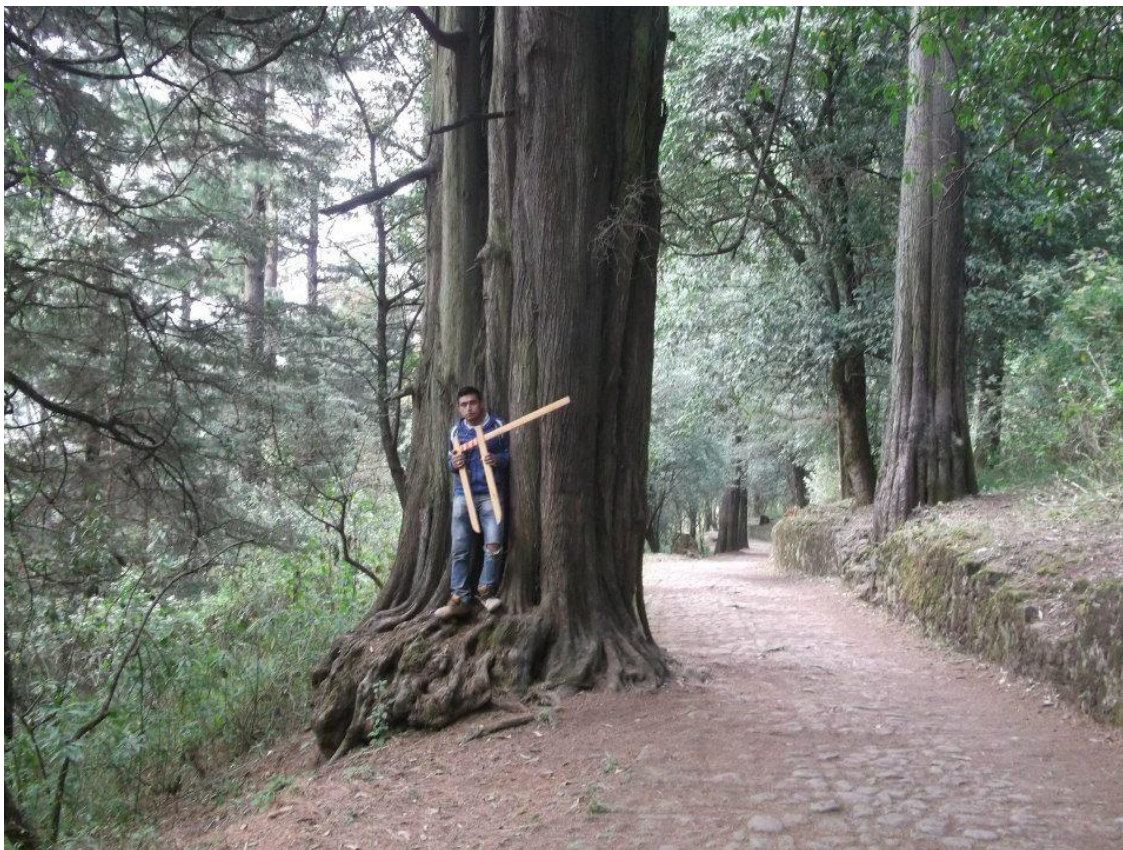
Figura 3. Ejemplar de cedro blanco ( Cupressus lindleyi Klotzsch ex Endl.) localizado en el Parque Nacional Desierto de los Leones en la Ciudad de México.

En la Figura 3 se observa un ejemplar de Cupressus lindleyi (cedro blanco) de más de 200 años y de 3 metros de diámetro normal (diámetro medido a una altura de 1.30 m del suelo). Dicho individuo fue localizado en el área natural protegida Parque Nacional Desierto de los Leones en la Ciudad de México. Donde el decreto de dicha área natural protegida, la primera de este tipo establecida en 1917 en México, ayudó a la conservación de este tipo de ecosistema.