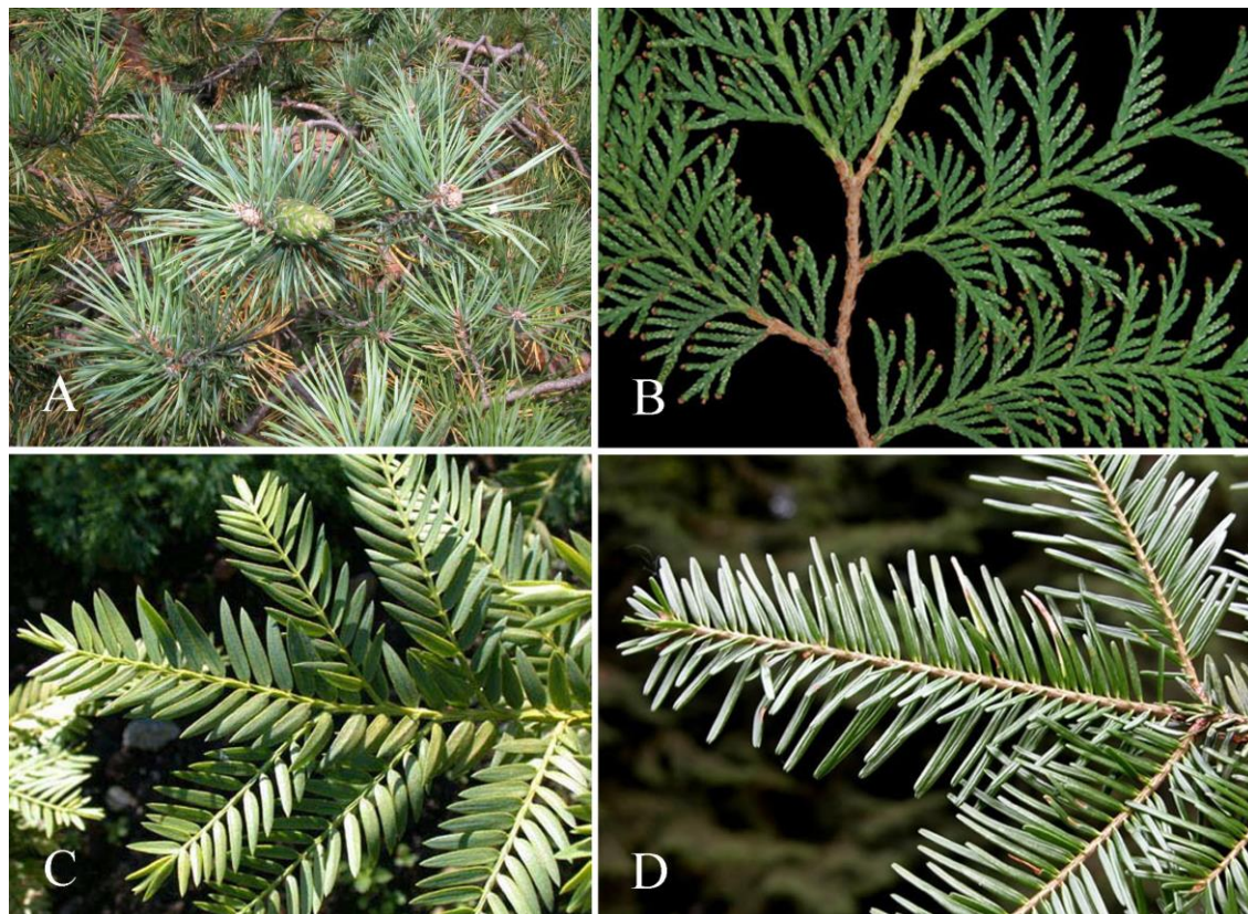
Figura 1. Tipos de hojas de las coníferas. A. Hoja acicular ( https://es.wikipedia.org/wiki/Ac%C3%ADcula ); B. Hoja en escama ( https://www.memrise.com/course/598056/plantes-2/2/ ); C. Hoja lanceolada ( http://www.plantasyhongos.es/gimnospermae/Coniferales-morfologia.htm ); D. Hoja lineal ( https://www.pinterest.es/pin/201958364519162739/ )