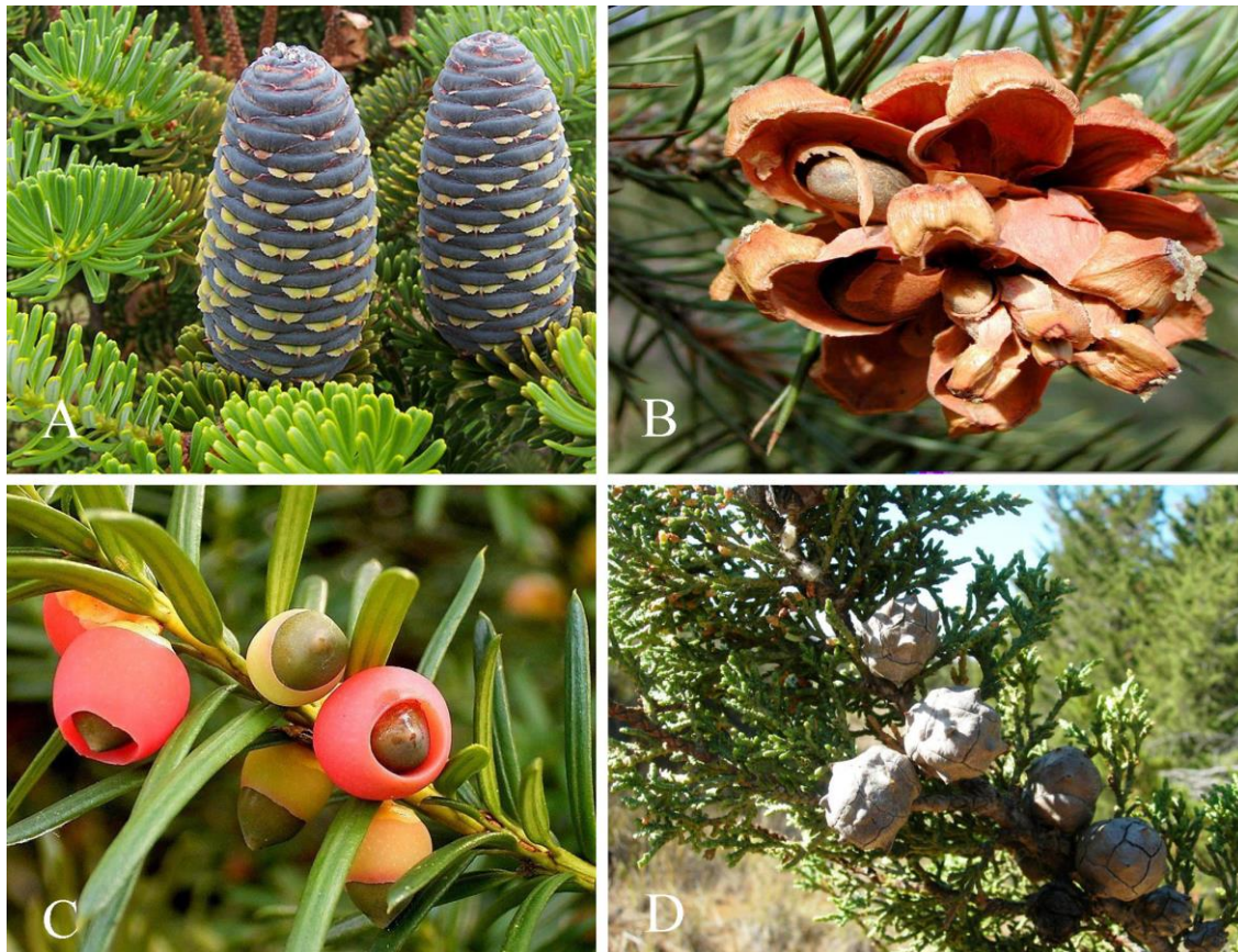
Figura 2. Conos o piñas y gálbulas de las coníferas. A. Cono Abies Koreana ( https://www.botanichka.ru/article/fir/ ); B. Cono Pinus cembroides ( https://www.genforlandscaping.com.mx/?p=1614 ); C. Fruto Taxus sp. ( https://www.cuv3.com/2015/03/10/la-mayoria-de-las-intoxicaciones-son-debidas-las-setas/ ); D. Gálbula Cupressaceae ( https://es.wikipedia.org/wiki/Cupressus )

De acuerdo con Rzedowski (2006); las coníferas mexicanas se encuentran distribuidas en los bosques de pino, en donde dominan las especies de dicho género. Dentro de ese ecosistema dominan especies como Pinus pseudostrobus Lindl, P. montezumae Lamb, P. oocarpa Shiede y P. michoacana Martínez. Los bosques de Oyamel y Abetos, por lo general se encuentran conformados de una y dos especies del género Abies Mill. y Picea A. Dietr., distribuidos en lugares húmedos y fríos en las principales montañas del país, siendo