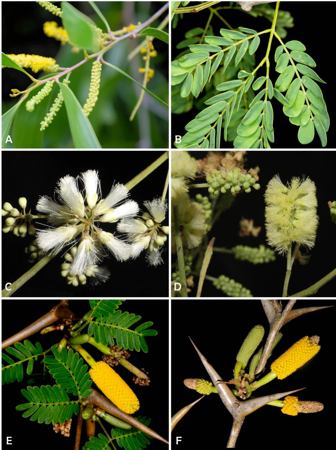
Figura 1. “Acacias” ( s.l. ) de la península de Yucatán, México. A. Filodios en Acacia longifolia (Andrews) Willd. (Australia). B. Hoja binipinada de Senegalia gaumeri . C. Acaciella angustissima . D. Senegalia gaumeri . E. Vachellia collinsii . F. Vachellia cornigera . (Fotografías: A. Henrik Baslev. B, C, E. Gustavo A. Romero González. D, F. William Cetzal Ix).

le siguieron decenas de publicaciones que han configurado el cuadro anterior de siete géneros (Seigler & Ebinger 2005, Seigler et al. 2006, Seigler et al. 2017).