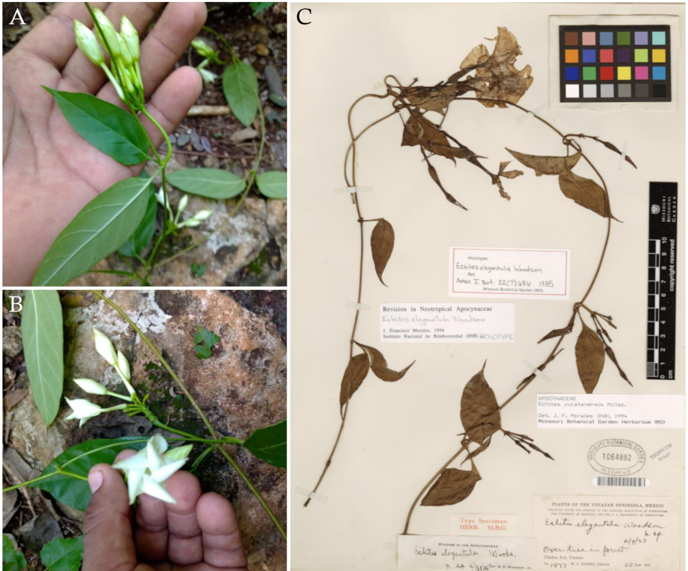
Figura 2A-B. Echites de Chanyokdzonot, Yucatán. C. Ejemplar tipo de Echites elegantula Woodson ( W.C. Steere 1477 MO ). (Fotografías: A-B. Miguel Ángel Caamal. C. Tomada de: http://legacy.tropicos.org/Image/53301 ).

co; las hojas son simples, sin estípulas, usualmente opuestas o en espiral, las flores son hermafroditas, actinomorfas, la corola con cinco pétalos unidos y lóbulos corolinos variadamente fusionados. Sin lugar a duda, una de las cosas más llamativas de la familia es que en una de las subfamilias, las Asclepiadoideae, los verticilos sexuales (androceo y el gineceo) forman una estructura compleja llamada ginostegio que deriva de la fusión de los estigmas y estilos (las partes femeninas) y los estambres y filamentos (las partes masculinas) en un solo órgano. Por cierto, un detalle muy interesante que demues-