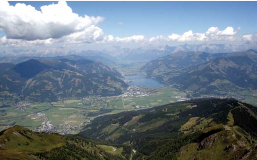
Das intensiv genutzte Zeller Becken im Salzburger Pinzgau. Massiv schreitet hier der Verlust an landwirtschaftlicher Fläche voran.

Baustein, um diese berühmte Silhouette bewahren zu können“. Es gibt dafür Motive Grünräume zu sichern, die in der Landschaftsästhetik, der Ökologie, und die Sicherheit wurzeln. Auch in Graz gewinnt das stadtnahe Grün an Bedeutung. Wien hat mit Niederösterreich einen Biosphärenpark angestrebt und jetzt auch bekommen. Der ehemalige Wald- und Wiesengürtel wird damit auf internationales Anerkennungs-niveau gehoben und das ist ein politisches Bekenntnis, das vor Konkurrenznutzung effektiver schützt, als die Flächenwidmungsplanung es je getan hat.