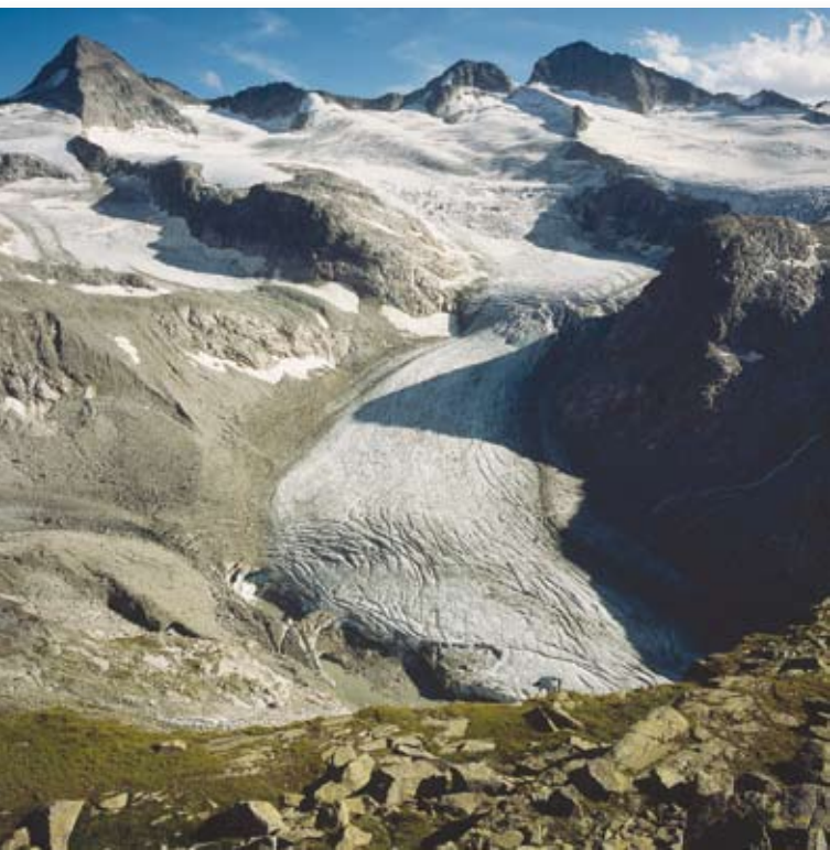
Im Alpenraumprogramm „Alpine Space“ steht der Klimawandel in der Prioritätenliste ganz oben (im Bild das stark zurückschmelzende Obersulzbachkees im Nationalpark Hohe Tauern).

Es ist auch zur Kenntnis zu nehmen, dass viele, die Alpen betreffende Entscheidungen weit außerhalb der Alpen in den europäischen Hauptstädten und in Brüssel getroffen werden. Eine Politik zur nachhaltigen Entwicklung der Alpen, für die die Alpenkonvention den Rahmen bildet, darf den europäischen Kontext also nicht ausblenden. Außerdem kann die Alpenkonvention durch die Mitarbeit in den Programmen zur territorialen Kooperation der EU eine größere Anerkennung und Sichtbarkeit auf europäischer Ebene erlangen.