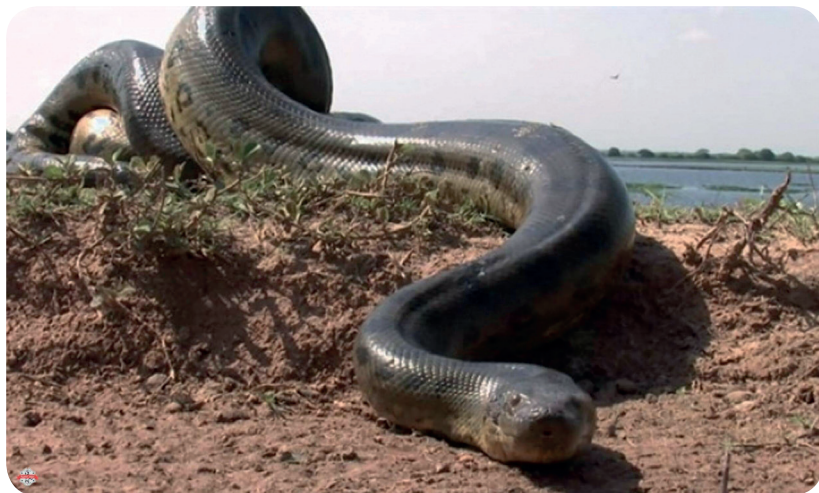
L'anaconda, il grande rettile del Rio delle Amazzoni

spiegazione sembra semplice. Ma forse c'è anche di più.