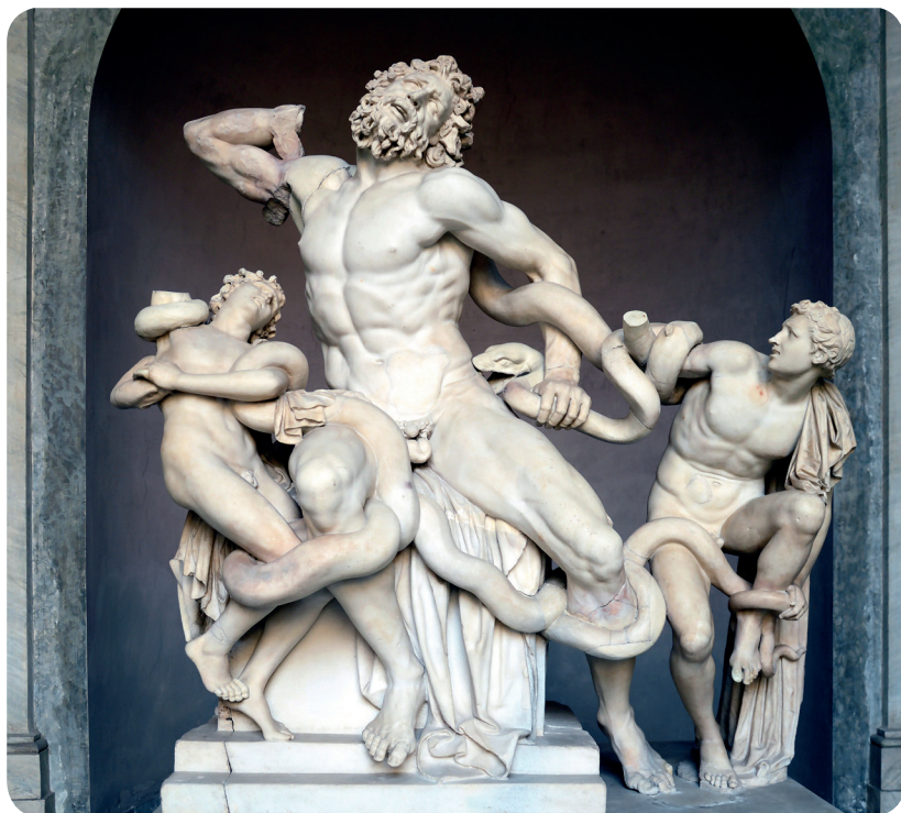
Laocöonte e i suoi due figli lottano coi serpenti, scultura greca della scuola di Rodi (I secolo), Museo Pio-Clementino, musei Vaticani ( https://it.wikipedia.org/wiki/Laocöonte ).

i punti più oscuri dell'esistere, immagine speculare dell'ignoto. Si muove senza arti e penetra come pene immondo le parti più nascoste delle nostre menti. Ed ecco che dalle profondità della terra tornano alla luce inaspettati e spaventosi resti di rettili provvisti di ali, pinne e creste.