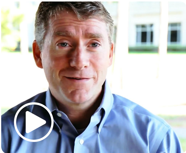
"סמוך על תחושות הבטן שלך" תמליל