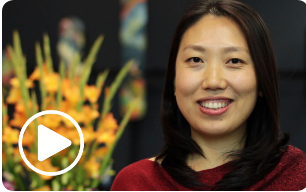
"זו רק פשטידה..." תמליל

ב-Cisco, אנו מקדמים יחסי עבודה מוצלחים ורצון טוב עם השותפים העסקיים שלנו, החיוניים להצלחה שלנו. כנדרש, אני עשוי לשקול להציע או לקבל מתנה או אירוח מלקוח או משותף עסקי, אבל מבין שעליי להיות זהיר שלא ליצור מצב שעלול לרמוז על ניגוד אינטרסים, נאמנות חצויה או מראית עין של ניסיון בלתי הולם להשפיע על החלטות עסקיות.