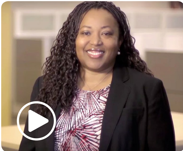
"אתיקה יומיומית" תמליל

מפני שאי אפשר להתייחס לכל מצב, אנו סומכים עליך שתדע להפעיל שיקול דעת נכון בקבלת ההחלטות שלך ולבקש סיוע כאשר יהיו לך שאלות או ספקות שלא נמצא להם מענה ב-COBC.