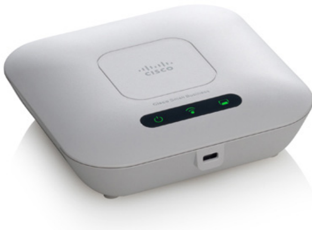
Figure 3. Panneau arrière du point d'accès Cisco WAP121 Wireless-N avec configuration par point unique