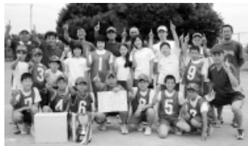
▲優勝した下町子ども会

※ティーボール…飛んでくるボールを打つのではなく、バッティングティーと呼ばれる細長い台にボールを置き、止まっているボールをバットで打って遊ぶスポーツです。