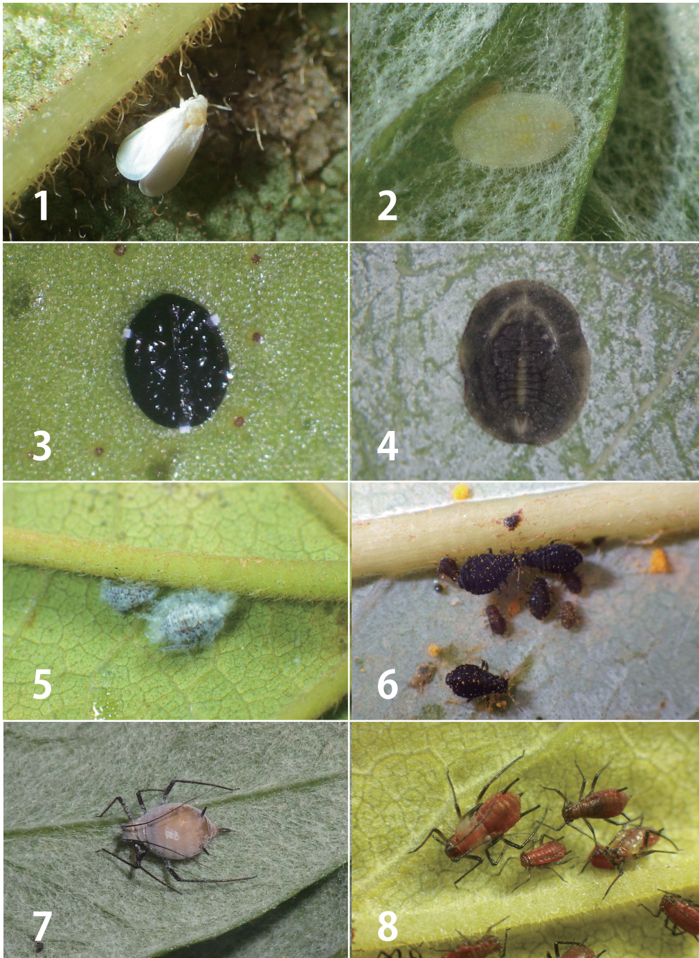
図版I (Plate I)