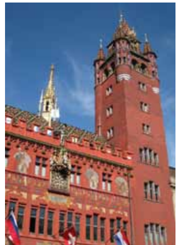
რატუსა – ევროპის ზოგიერთ ქვეყანაში ქალაქის თვითმმართველობის ორგანო, აგრეთვე შენობა, სადაც განთავსებულია ეს ორგანო

სწორედ ამგვარი მცდელობის მაგალითია დოკუმენტის – „ევროპული ქარტია ადგილობრივი თვითმმართველობის შესახებ“ – შექმნა, რომელსაც 1985 წელს სტრასბურგში მოენერა ხელი. ამ ქარტიაში ჩამოყალიბებული პრინციპების გაზიარება სავალდებულოა ყველა ევროპული ქვეყნისთვის.