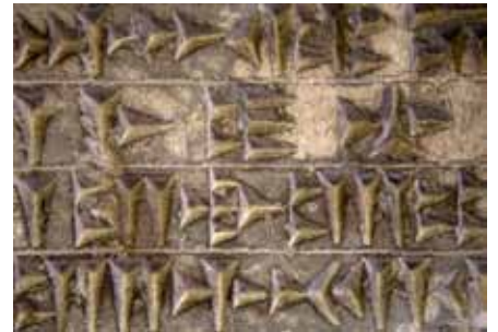
ძველი შუმერული ლურსმული წარწერა

თუმცა, უნდა ითქვას, რომ კლასიკური სახით დემოკრატიისა და თვითგანათვალის ნიმუში ძველ ბერძნულ პოლისებში იყო წარმოდგენილი. დემოკრატიულობის ხარისხით განსაკუთრებით გამოირჩეოდა ათენი, რომლის შესახებაც ყველაზე მეტი ცნობები შემოგვინახა ისტორიამ. სწორედ ათენელთა მიერ შექმნილი ეს დემოკრატიული მმართველობა დაედო საფუძვლად თანამედროვე ცივილიზებული სამყაროს სახელმწიფოთა მოწყობის სისტემას. ამ სისტემის ყველაზე მნიშვნელოვან ელემენტს თვითგანათვალის ნარმოადგენს.