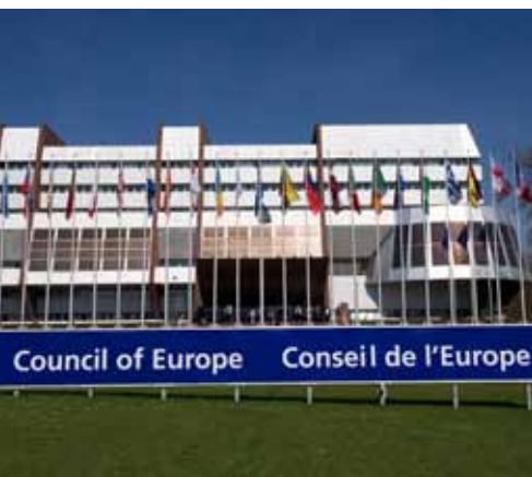
ევროპის საბჭოს შენობა სტრასბურგში

1991 წელს საქართველომ, დამოუკიდებლობის აქტის მიღებით, საჯაროდ გამოხატა დემოკრატიული სახელმწიფოს მშენებლობის სურვილი. დემოკრატიის დამკვიდრება კვლავ რჩება ახალი ქართული სახელმწიფოს უმთავრეს ამოცანად.