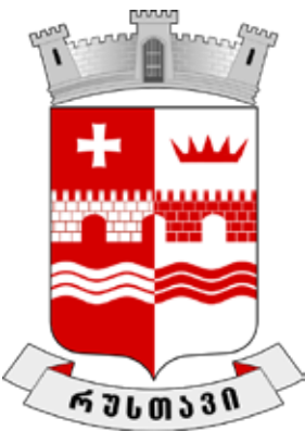
ქალაქ რუსთავის გერბი

გაეცანით მოცემულ მაგალითებს ქვეყნის სხვადასხვა რეგიონის საკრებულოთა აქტივობებიდან. განსაზღვრეთ თითოეულ შემთხვევაში კონკრეტულად რომელი უფლებამოსილება გამოიყენა ამა თუ იმ საკრებულომ. საინტერესო იქნებოდა თუ არა თქვენთვის ამ ტიპის აქტივობებში მონაწილეობა? პასუხი დაასაბუთეთ.