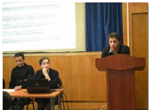
თბილისის სახელმწიფო უნივერსიტეტის სტუდენტური თვითმმართველობის საქმიანობა