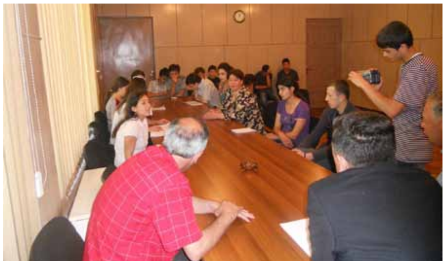
მოსწავლეები მონაწილეობას იღებენ თვითმმართველობის განხორციელებაში

გამოგიყენებიათ თუ არა ოდესმე ადგილობრივი თვითმმართველობის შესახებ მიღებული ორგანული კანონით საქართველოს მოქალაქეებისთვის მინიჭებული რომელიმე უფლება? ალბათ დროა, მოვახდინოთ ამ უფლების რეალიზაცია.