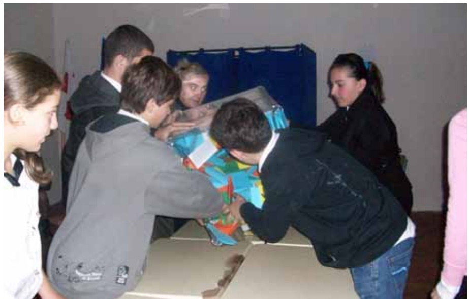
არჩევნები საჯარო სკოლაში

აქტიური საარჩევნო უფლება - მოქალაქის უფლება, ხმის მიცემის მეშვეობით მონაწილეობა მიიღოს საჯარო ხელისუფლების წარმომადგენლობით ორგანოში ხალხის წარმომადგენელთა ასარჩევად და საჯარო ხელისუფლების თანამდებობის დასაკავებლად ჩატარებულ საყოველთაო არჩევნებსა და რეფერენდუმში.