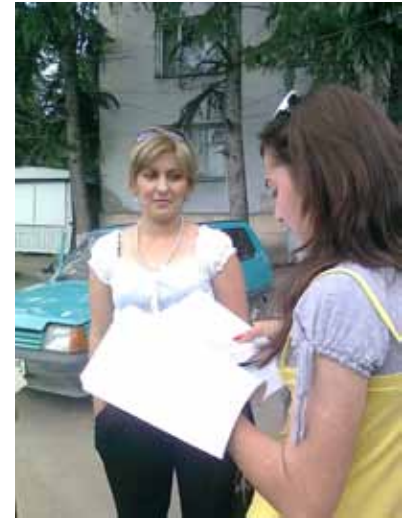
მოსწავლეები ატარებენ სოციოლოგიურ გამოკითხვას

5. შეხვედრის შედეგები დეტალურად აღწერეთ სხდომის ოქმში. შესაძლებელია მოამზადოთ ინფორმაცია ადგილობრივი მედიასაშუალებებისთვის. ორმხრივი თანხმობის (თვითმმართველობისა და სკოლის) შემთხვევაში შესაძლებელია მედიის მონკვევა შეხვედრის გასაშუქებლად.