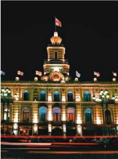
ქ. თბილისის საკრებულო; თავისუფლების მოედანი