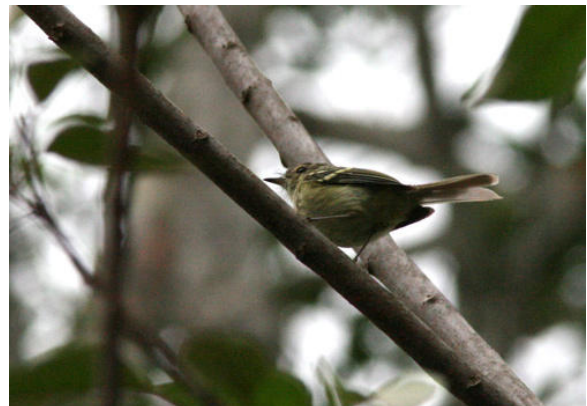
São Francisco Sparrow och Bahia Tyrannulet.