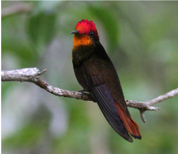
Den fantastiska Ruby-topaz Hummingbird, Boa Nova.