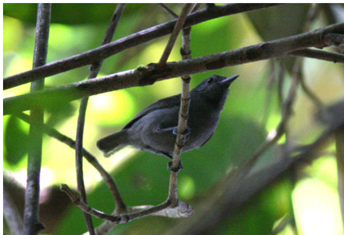
Till höger: Den mycket sällsynta Alagoas Antwren, Murici.

Ett av de största skogsområdena (6 000 ha) som finns kvar på högre höjd i Alagoas ligger vid Murici och är typlokal för Alagoas Tyrannulet, Foliage-gleaner och Antwren samt Orange-bellied Antwren. På senare år har antalet fåglar i skogen minskat dramatiskt, ingen vet riktigt varför. Fortsatt olovlig avverkning torde dock vara en bidragande orsak. Fortfarande den bästa lokalen för den ytterst fåtaliga Alagoas Antwren och det enda moderna tillhålllet för Amazonian Barred-Woodcreeper i nordöstra Brasilien (ytterst få fynd, men vi fick se den!). Av andra specialare bör nämnas Tawny Piculet, Jandaya Parakeet, Margaretta's Hermit, Long-tailed Woodnymph, Pernambuco Foliage-gleaner, Lesser Woodcreeper ( atlanticus ), White-shouldered Antshrike, Scalloped och Scaled Antbirds, Black-cheeked Gnateater, White-bellied Tody-Tyrant, Black-headed Berryeater, White-winged Cotinga, Bearded Bellbird och Seven-colored Tanager. I skogsfragment på lägre höjd finns 1-2 par av världens sällsyntaste rovfågel, White-collared Kite. Mig veterligen blev vi de första svenskar någonsin som fick se arten!