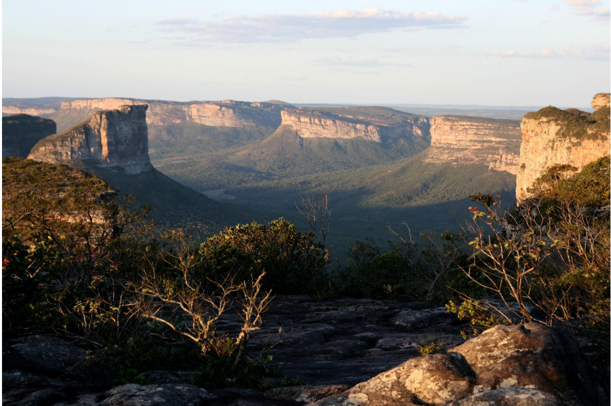
Vy från Chapada Diamantina, ett av de vackraste och mest varierade områdena i hela Brasilien.