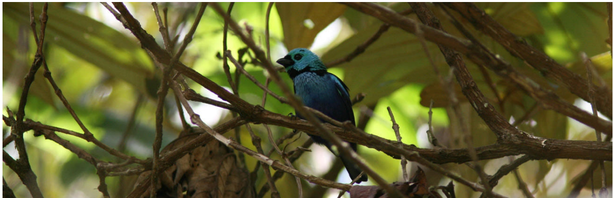
Den vackra Seven-colored Tanager (VU) är tyvärr en populär burfågel.

VU: White-necked Hawk, White-browed Guan, Blue-throated Parakeet, Golden-tailed Parrotlet, Ochraceous Piculet, Bahia Spinetail, Striated Softtail, Pink-legged Graveteiro, Band-tailed, Bahia och Pectoral Antwrens, Fork-tailed och Buff-breasted Tody-Tyrants, Black-headed Berryeater, Bare-throated Bellbird, Yellow-faced Siskin och Seven-colored Tanager.