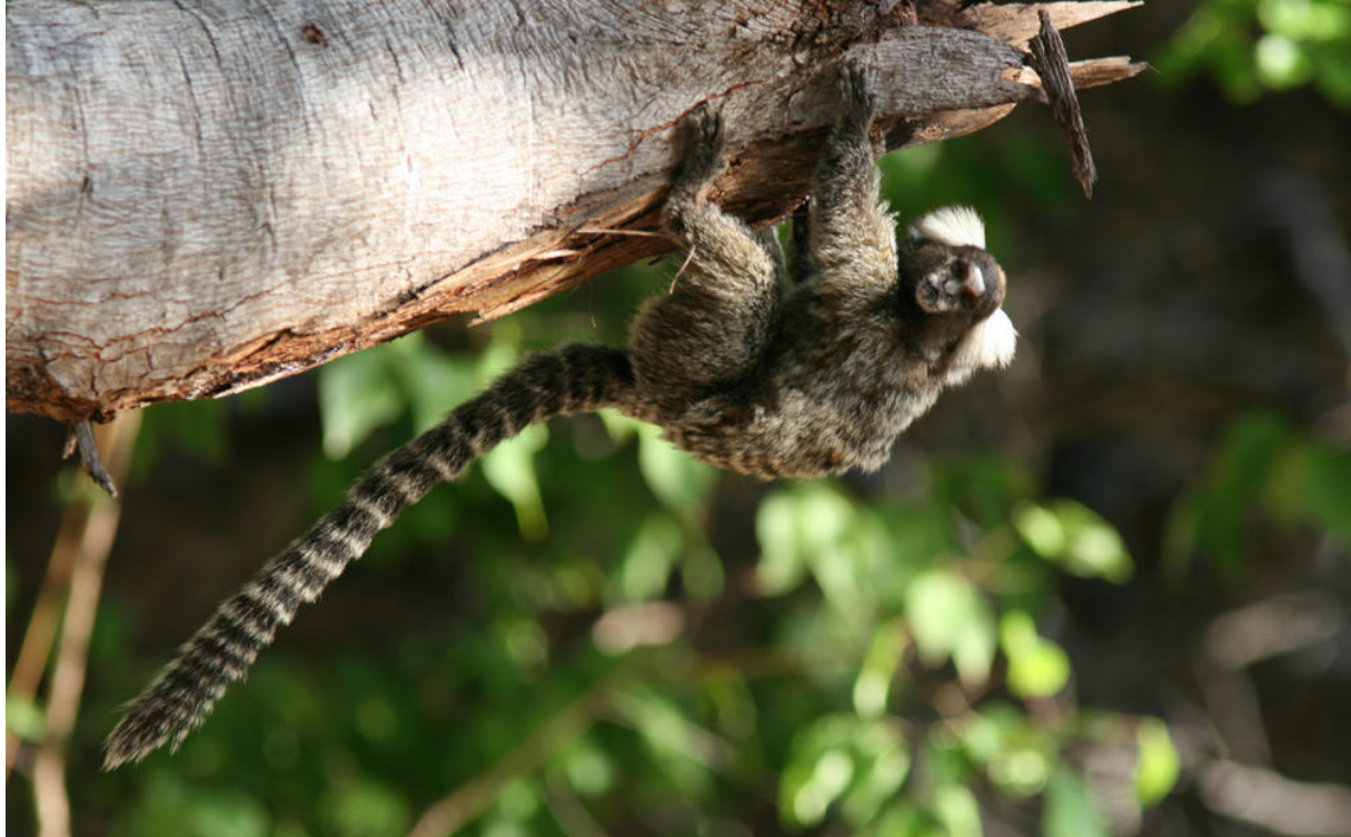
White-tufted-ear Marmoset, Icapuí.