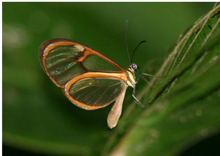
Clearwing sp., Chapada do Araripe. En av hundratals individer!

kritiskt utrotningshotade Gray-breasted Parakeet, vars artstatus dock har ifrågasatts nyligen. Andra specialare är Spot-winged Wood-Quail, Gould's Toucanet, Blond-crested Woodpecker, Ochraceous Piculet, Rufous-breasted Leaf-tosser, Short-tailed Antthrush, Buff-breasted Tody-Tyrant, "Ceará" Gnateater och Band-tailed Manakin.