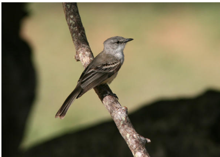
Campo Flycatcher av rasen bahiae , Canudos.