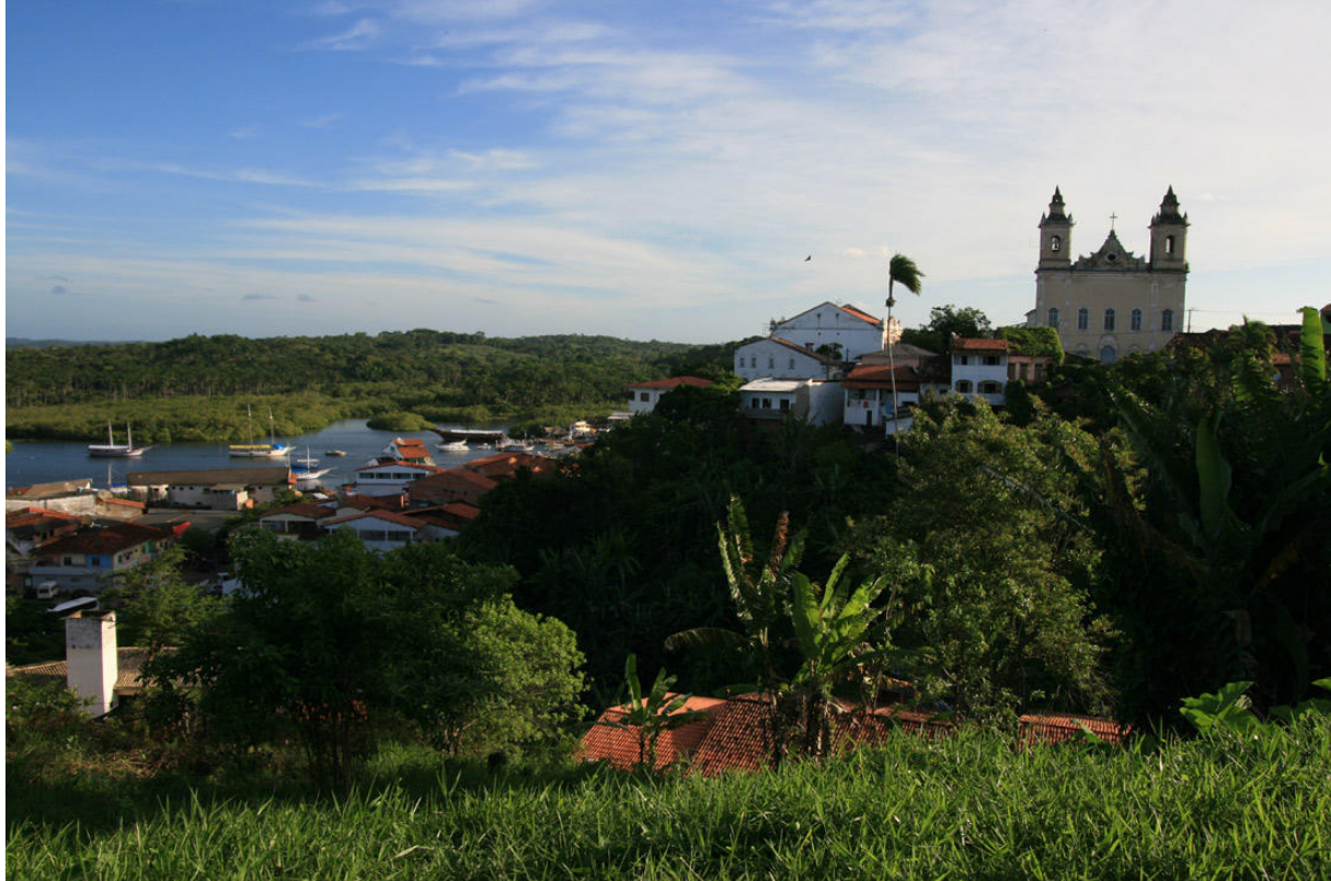
Utsikt från hotellet i Camamu.