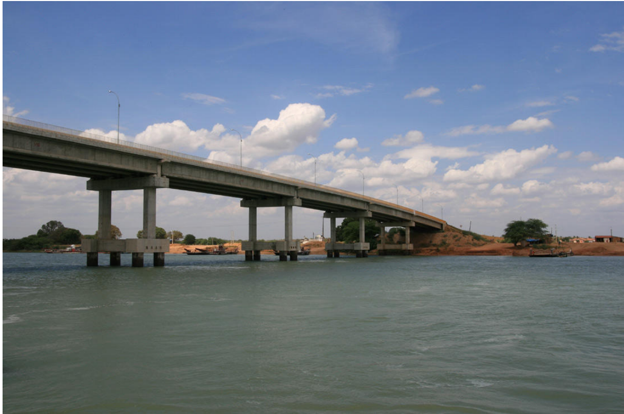
Färjetur över den mäktiga São Francisco-floden. Nedan: Lear's Macaw, Canudos.