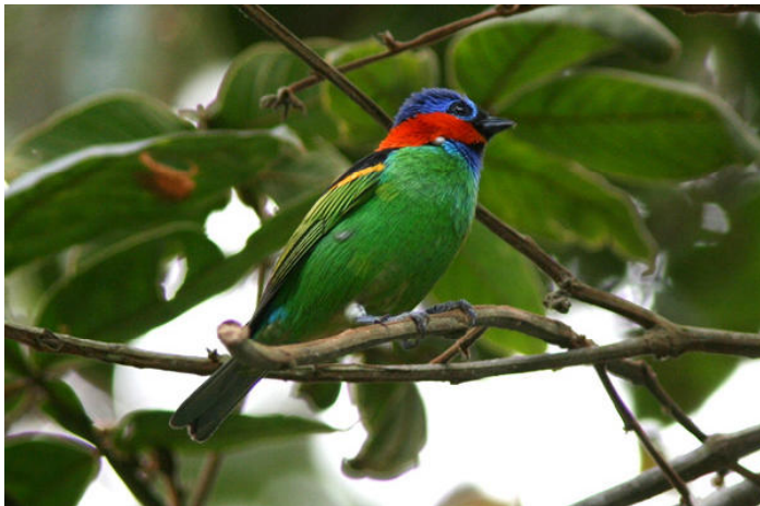
Red-necked Tanager och Gray-breasted Parakeet, Baturité.

Sista morgonen åkte vi till ett bergsområde nära Fortaleza som får gå under namnet Bellbird Paradise eftersom det finns en god population av Bearded Bellbird i molnskogsterrängerna på dess krön. En utfärgad hane sågs fint i ett par minuter innan det började regna – resans sista turliga omständighet! I övrigt hann vi inte med så mycket skådning men adderade även Blue-crowned Motmot till reslistan.