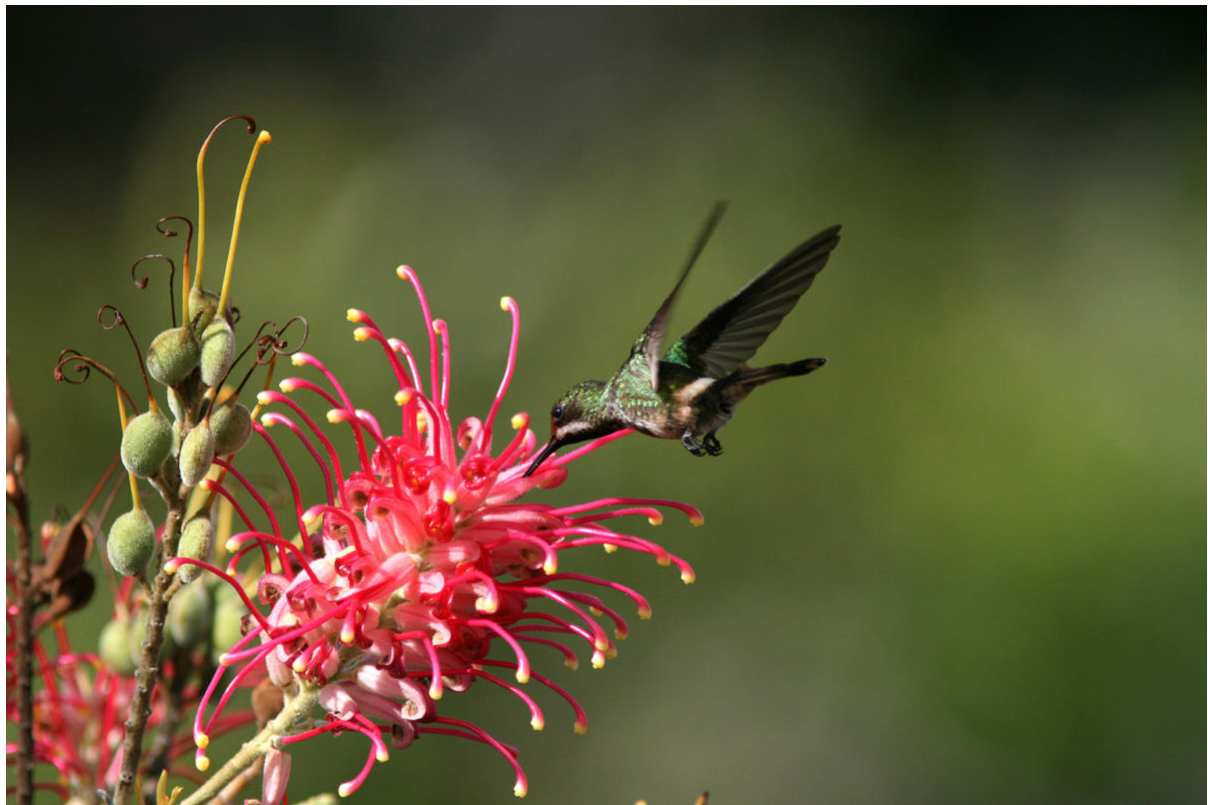
Snacka om uppvisning! Två honor av Racket-tailed Coquette poserade villigt framför kameran vid Porto Seguro.

Tyvännär är detta liksom flertalet andra biologiska reservat numera stängt för allmänheten. Fragmenterad skog strax utanför är dock ganska produktiv. Den främsta målarten White-winged Potoo sjöng möjligen till en enda gång, men vi fick istället nöja oss med arter som Band-tailed och Bahia Antwrens, Scaled Antbird, White-winged Cotinga, Ringed Woodpecker och Least Pygmy-Owl. Möjligen sågs även en Hook-billed Hermit.