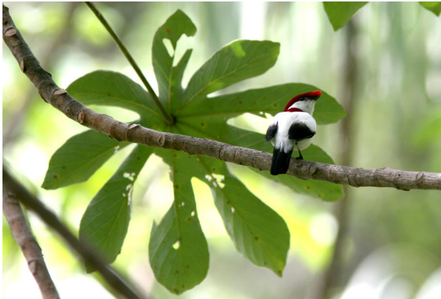
Det var en nästan chockartad upplevelse att få se Araripe Manakin i verkligheten!

Caatinga vid São Francisco-floden nära Petrolina är hemvist för Least Nighthawk, Little Nightjar, Stripe-breasted Starthroat, Spotted Piculet, Greater och Lesser Wagtail-Tyrants (båda av isolerade raser/arter), Southern Scrub-Flycatcher och White-naped Xenopsaris. Även Pygmy Nightjar finns i området kring Petrolina.