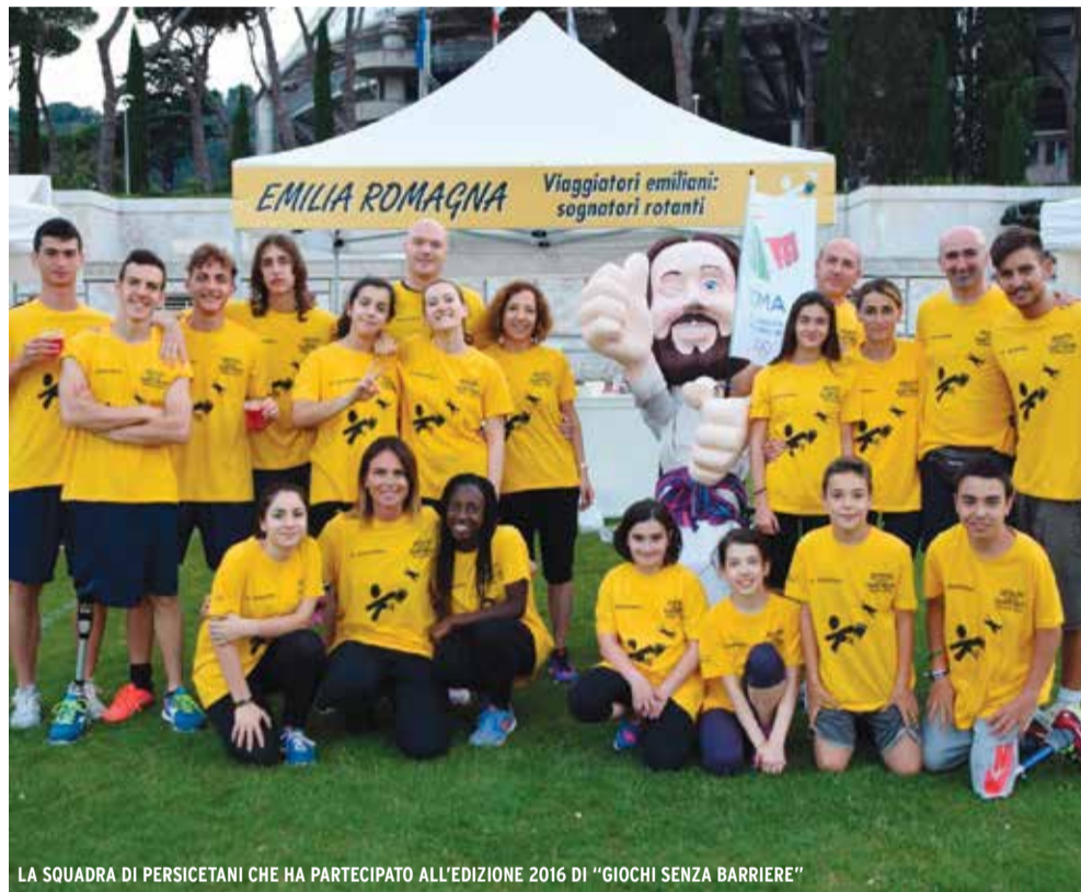
LA SQUADRA DI PERSICETANI CHE HA PARTECIPATO ALL'EDIZIONE 2016 DI "GIOCHI SENZA BARRIERE"