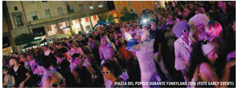
PIAZZA DEL POPOLO DURANTE FUNKYLAND 2016