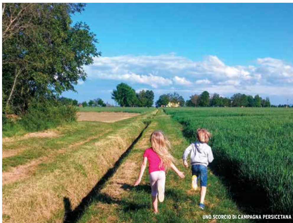
UNO SCORCIO DI CAMPAGNA PERSICETANA