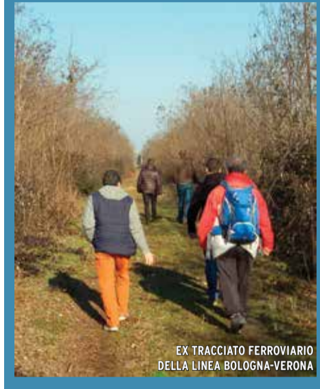
EX TRACCIATO FERROVIARIO DELLA LINEA BOLOGNA-VERONA

La Regione Emilia Romagna ha recentemente approvato una legge sulla ciclabilità con l'obiettivo di creare nuovi collegamenti tra le piste ciclabili esistenti, favorire una maggiore integrazione treno-bici e più servizi per i ciclisti, dalla riparazione alla vigilanza, realizzare per ogni nuova strada una nuova pista, anche non adiacente. Tra i finanziamenti a sostegno delle misure previste dalla legge, figurano 5 milioni di euro, provenienti dalla legge sulla Green economy, per la realizzazione del tratto della Ciclovia del Sole lungo il tracciato ferroviario dismesso della Bologna-Verona, che attraverserà otto Comuni fra Bologna e Modena: Mirandola, San Felice sul Panaro, Camposanto, Crevalcore, San Giovanni in Persiceto, Sant'Agata Bolognese, Anzola dell'Emilia, Sala Bolognese.