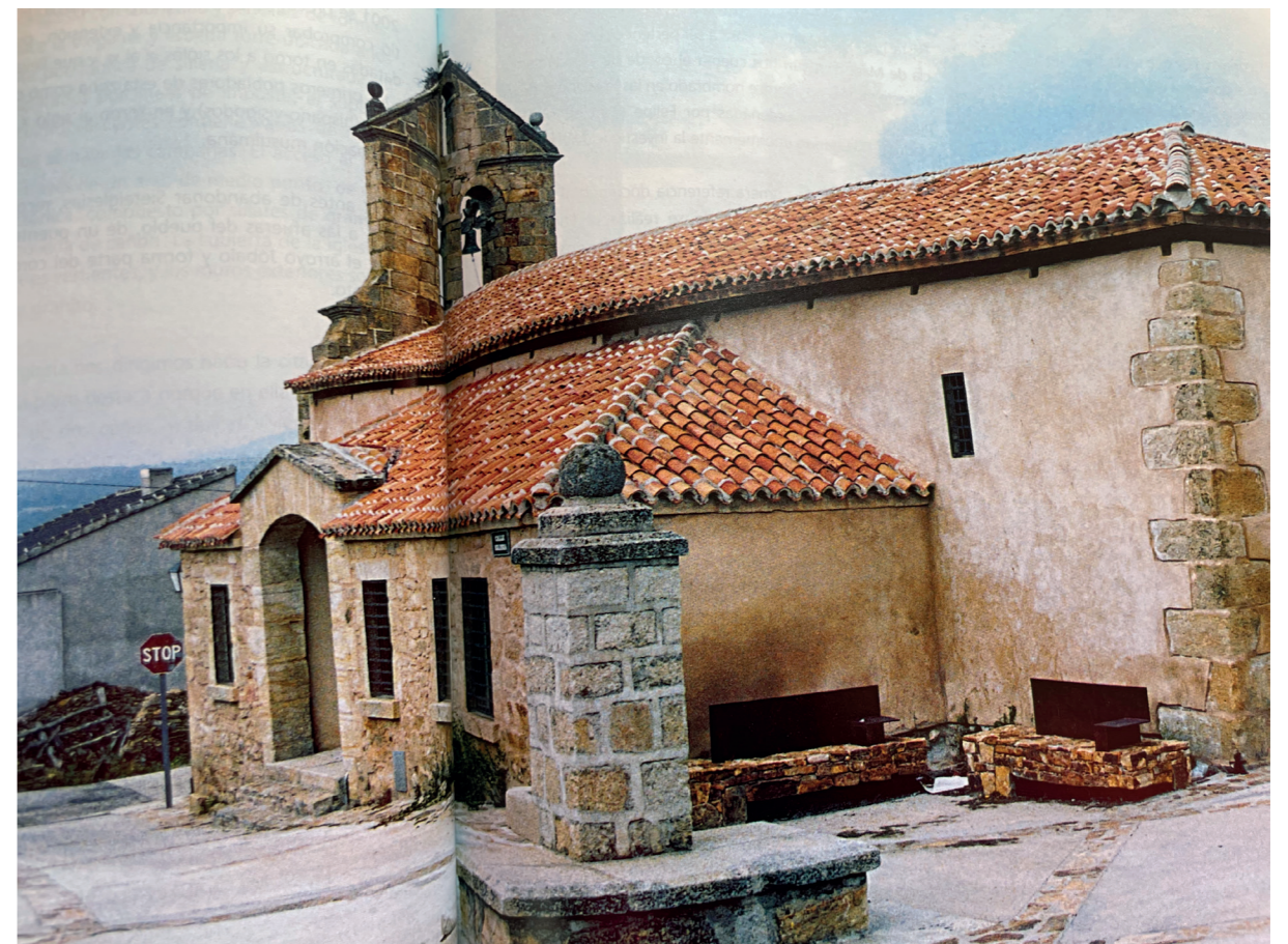
Plaza de la Constitución. En: Plazas con historia, 2002. Fuente: Centro de Documentación de Medio Ambiente y Ordenación del Territorio.