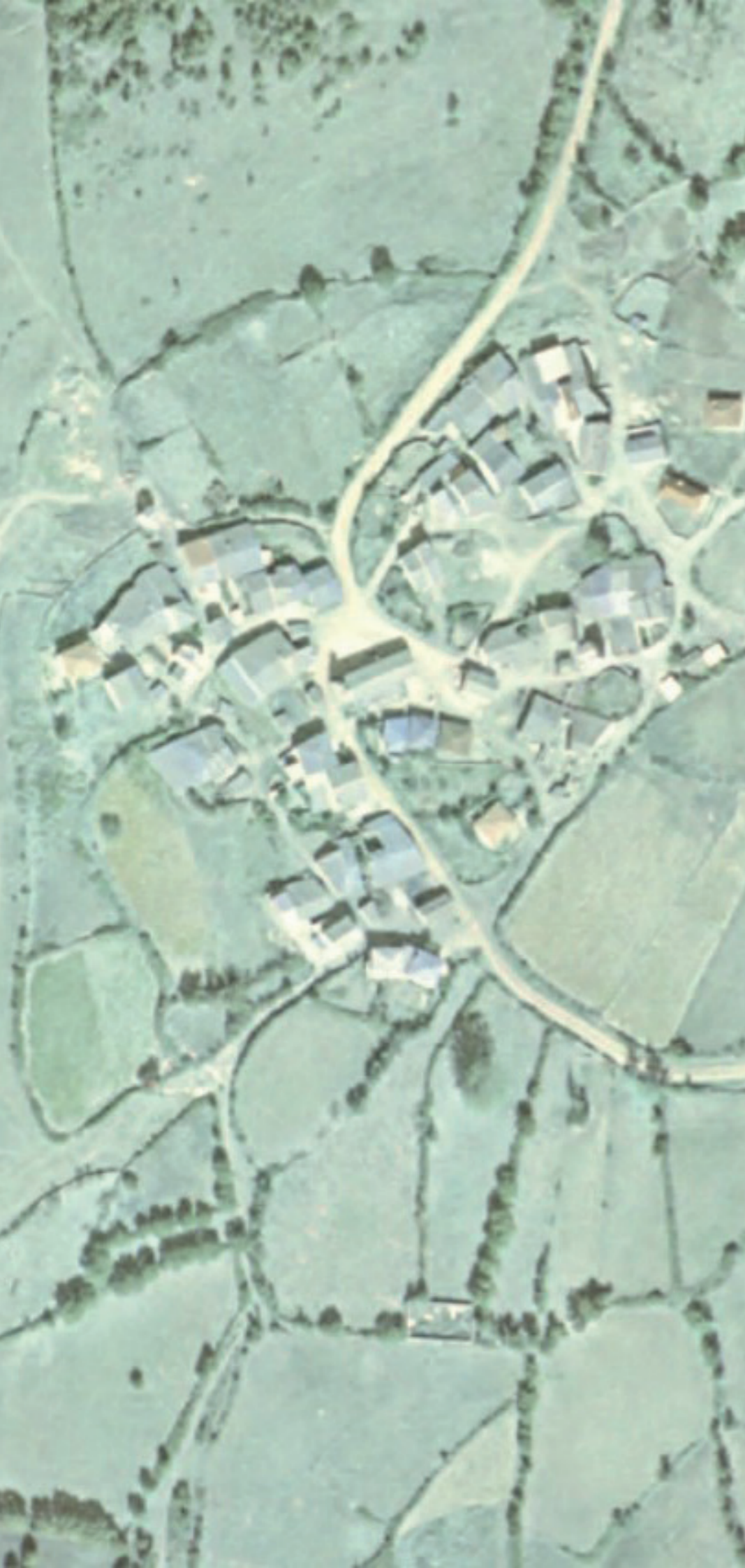
MADARCOS EN 1980.