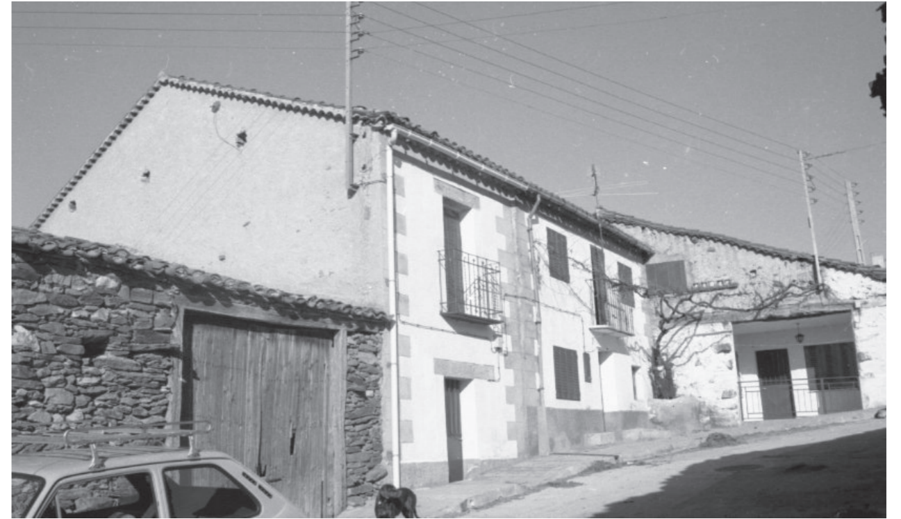
Vista calles Madarcos, años 80.