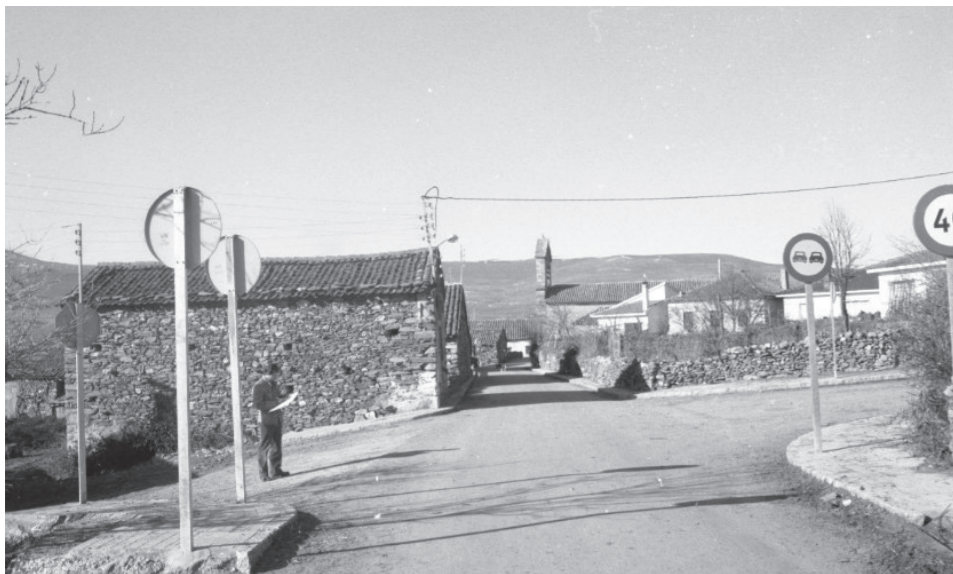
Vista calles Madarcos, años 80.