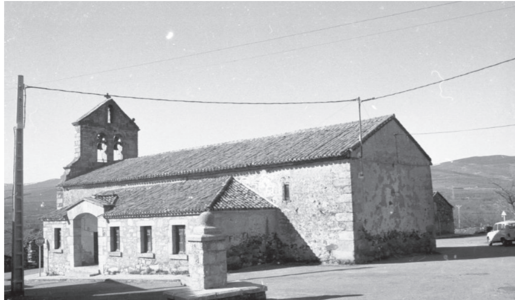
Parroquia de Santa Ana y plaza, años 80.