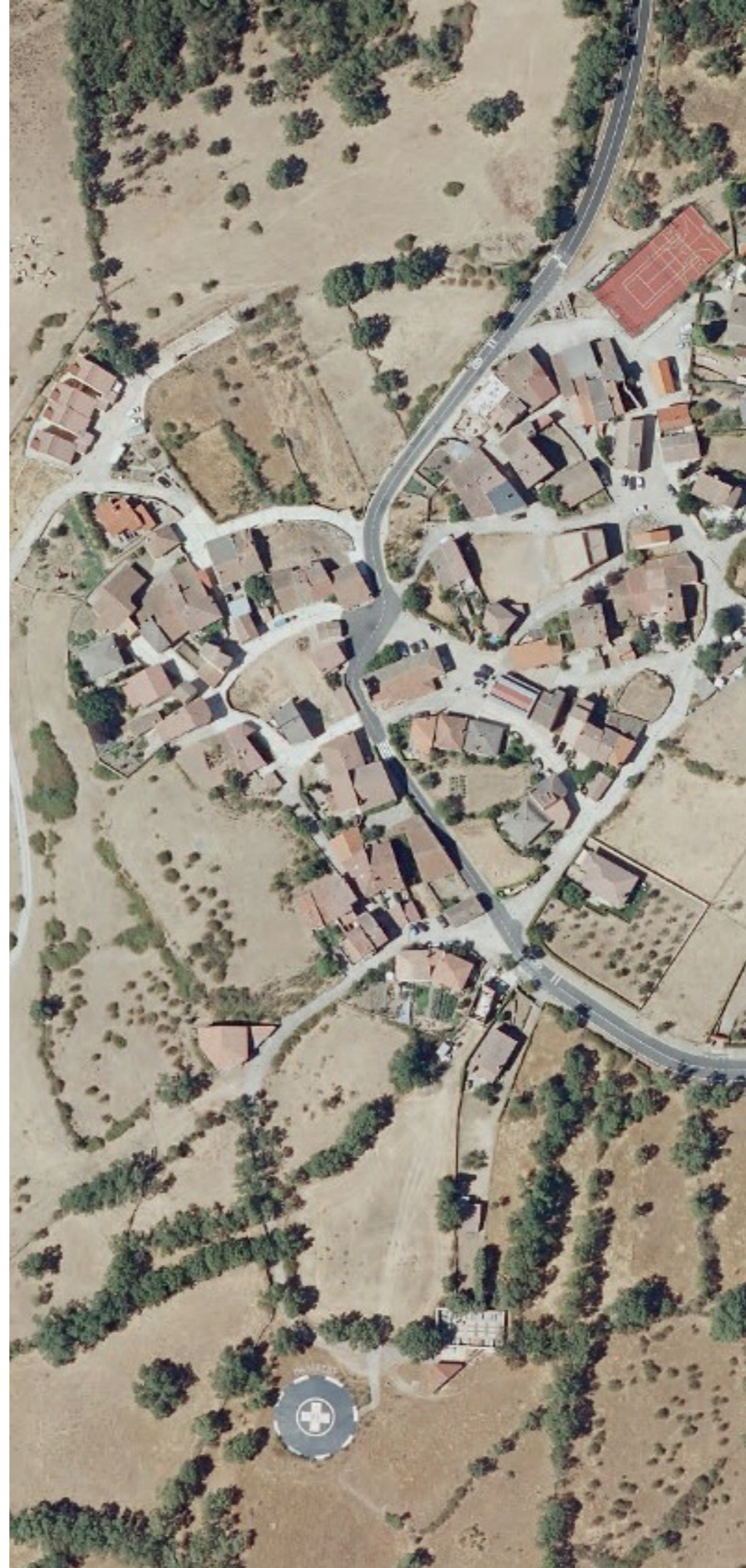
MADARCOS EN 2022.