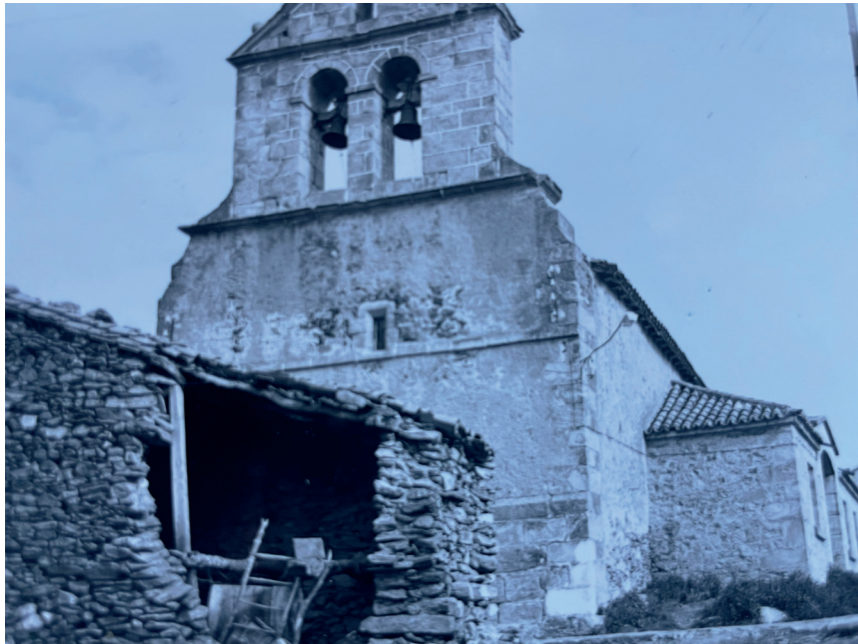
Parroquia de Santa Ana. En: Información urbanística de 36 municipios : zona norte y noreste (Madrid), 1979.