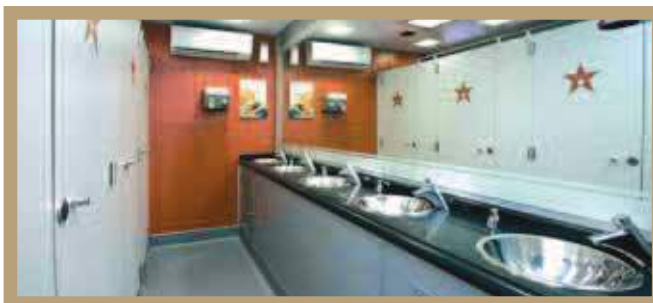
Interior modelo Hollywood.

Cobertura nacional con delegaciones en Barcelona, Madrid, Valencia.