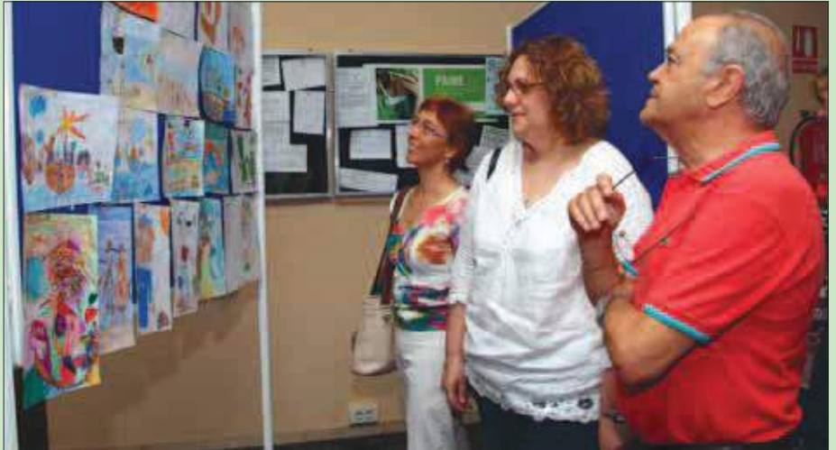
Miembros de la Asociación de Médicos Artistas deliberando sobre los dibujos presentados