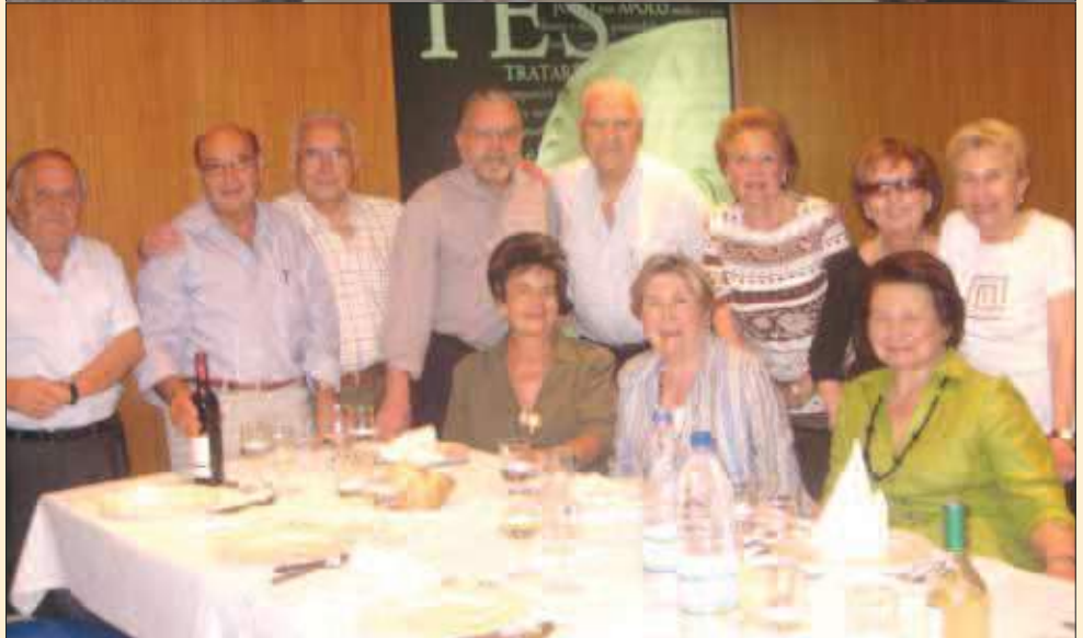
Los compañeros que cumplen sus bodas de oro continúan reuniéndose en el Colegio para almorzar

queda disminuida, como si fuera un promontorio, o la casa de uno de tus amigos, o la tuya propia; la muerte de cualquier hombre me disminuye, porque estoy ligado a la humanidad; y por consiguiente, nunca hagas preguntar por quién doblan las campanas; doblan por ti (John Donne).”