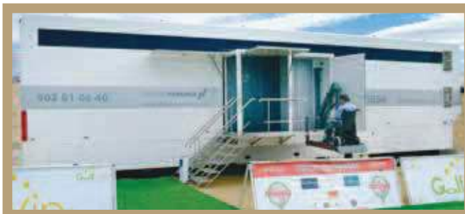
Modelo Hollywood con rampa homologada para minusválidos.