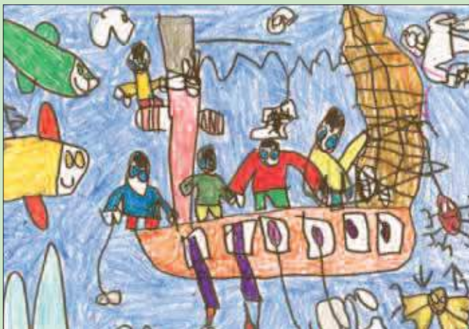
Dibujo de Javier Egea