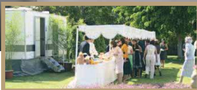
Remolque de lujo Manhattan en evento al aire libre.