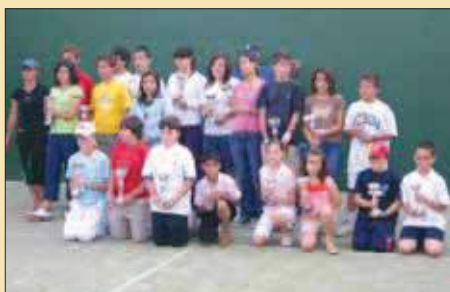
Numerosos hijos de colegiados participaron en los campeonatos deportivos