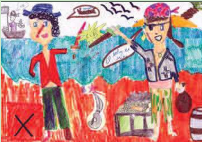
Dibujo de Nuria Nogués