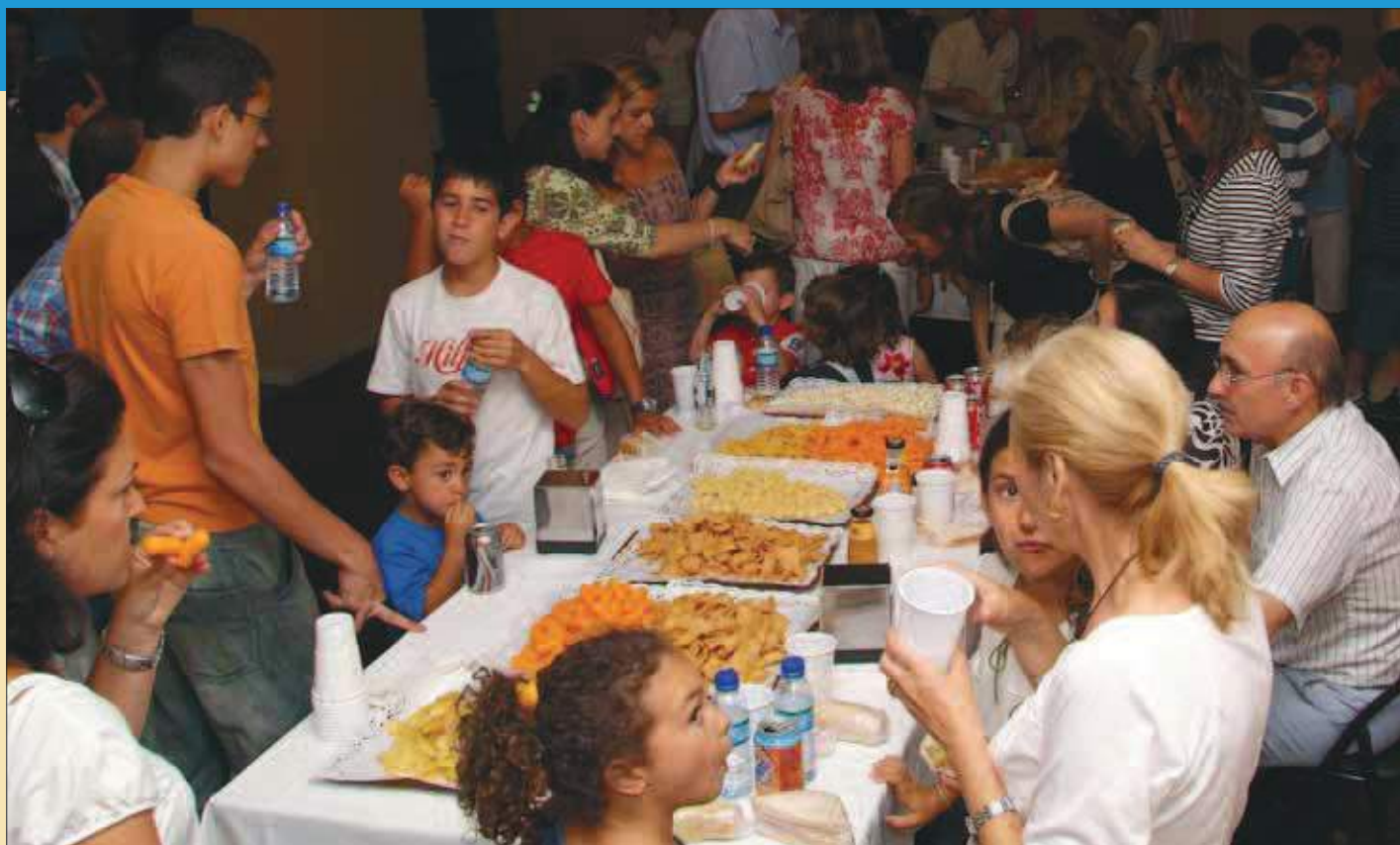
Los niños disfrutaron de una merienda, de actuaciones y juegos