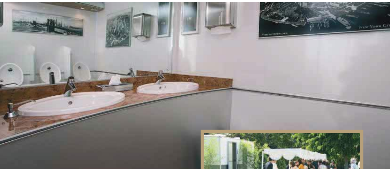
Interior remolque de lujo Manhattan.

Cuando organizas un evento cuidas hasta el más mínimo detalle: las mesas, sillas, flores, catering... Te preocupas por la logística de lo planificado e imprevisto.