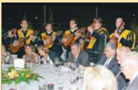
La tuna amenizó la cena de gala