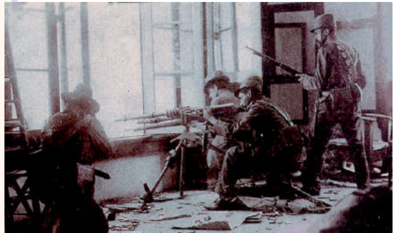
Decena Trágica. Soldados sublevados en acción, 1913

Durante diez días ocurrieron distintos enfrentamientos que causaron un estado de enorme confusión. Hubo numerosos