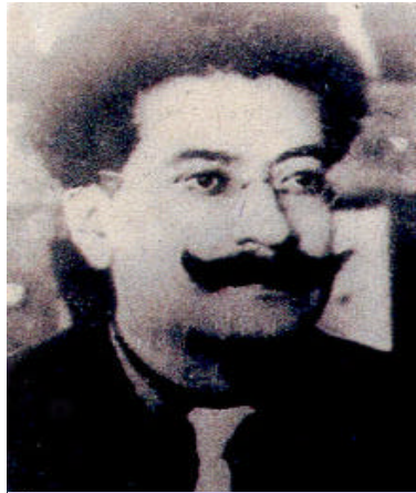
Ricardo Flores Magón.

Victoriano Huerta realizó las maquinaciones necesarias para asumir legalmente la presidencia, pero su traición era evidente. De inmediato tuvo que enfrentarse a quienes no estaban dispuestos a aceptarlo.