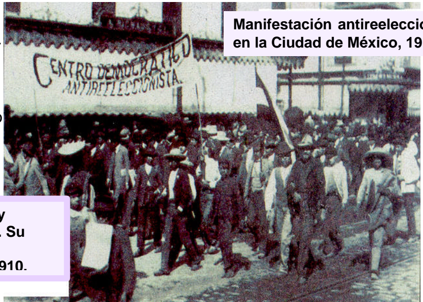
Manifestación antireeleccionista en la Ciudad de México, 1910.

Madero creía en la democracia y en la necesidad de renovar el gobierno con apego a