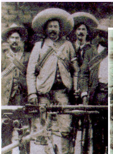
Francisco Villa durante las primeras campañas militares.

Las compañías extranjeras instaladas en México no querían perder los privilegios que les había concedido Porfirio Díaz; así que empezaron a considerar la conveniencia de eliminar el estorbo que para ellos representaba Madero