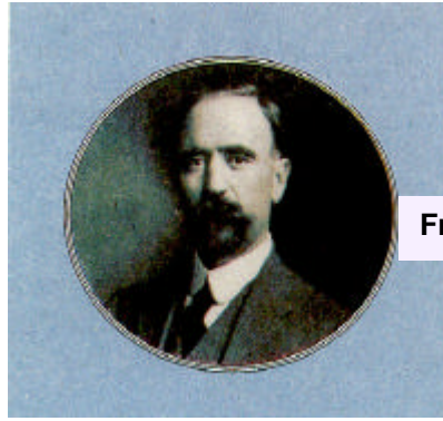
Francisco I. Madero.

Cuando Díaz afirmó que México se encontraba maduro para la democracia, esos jóvenes creyeron que había llegado el momento de participar. Uno de ellos fue Francisco I. Madero, miembro de una familia adinerada, había estudiado y viajado fuera de México. Sin embargo, sabía que muchos mexicanos vivían en la pobreza y estaba preocupado por los problemas nacionales. Quería participar en el gobierno de su país y decidió entrar en la política.