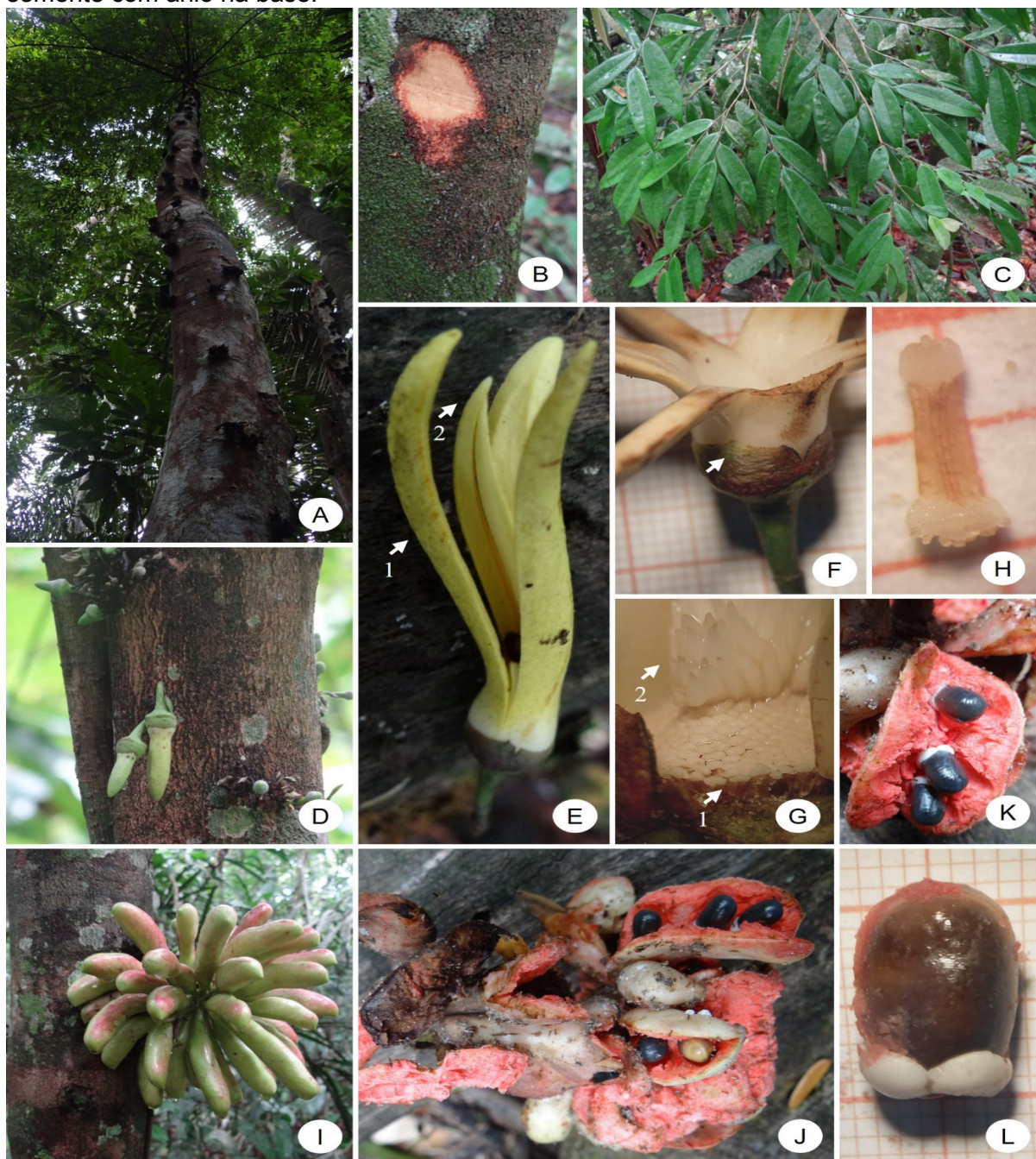
FIGURA 2. Morfologia de Xylopia benthamii no Parque Zoobotânico Leopoldo Linhares Fernandes, Alta Floresta, Mato Grosso: A) hábito; B) casca do tronco; C) ramos com folhas; D) inflorescências com botões; E) flor; F) sépala (seta) e conformação do tubo da corola; G) receptáculo com estames (seta 1) e carpelos (seta 2); H) estame; I) carpídios imaturos; J) carpídios maduros; K) capídio com endocarpo avermelhado e sementes ariladas; L) semente com arilo na base.

A espécie é caracterizada pelas inflorescências caulifloras, flores glabras, grandes e carpídios avermelhados com muitas sementes (MAAS et al. , 2007). No Zoobotânico, é facilmente reconhecida devido a arquitetura piramidal da copa, flores caulifloras grande e amareladas e pelos frutos apocárpicos com dezenas de carpídios, com coloração bastante variável, desde totalmente verdes, verde-avermelhados até totalmente avermelhados.