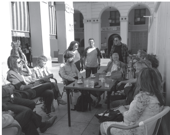
Tertulia en a Feria d'o Libro o día 30 de chunio, en "La Confianza". Se charró sobre si bi eba remplazo chenerazional en a literatura en aragonés.