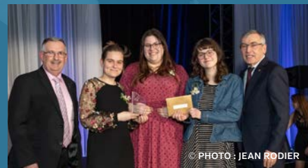
▼ SER-O-VIEUX Cégep du Vieux Montréal Catégorie 17-35 ans