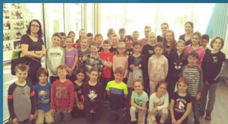
▼ BOMBES ÉTOILÉES École de l'Étoile de Lévis Catégorie 5-12 ans