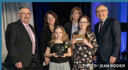
▼ LA BALLADE AU KAMOURASKA École Monseigneur-Boucher de St-Pascal Catégorie 5-12 ans