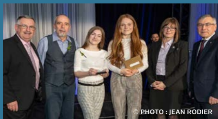
▼ LA COOPÉRATIVE JEUNESSE DU MAGASIN DU MONDE École secondaire d'Oka Catégorie 12-17 ans