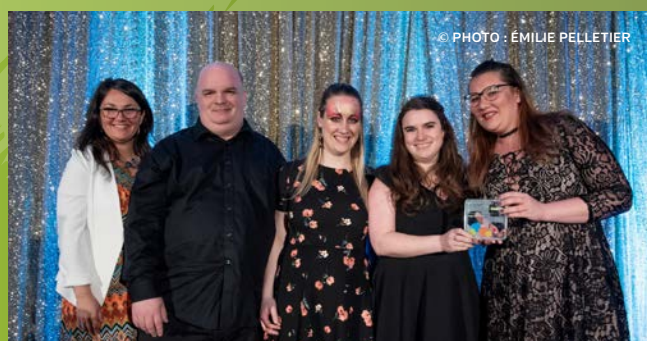
La Coop Rosemont reçoit le prix Meilleures pratiques environnementales 500 $, commandité par Co-operators