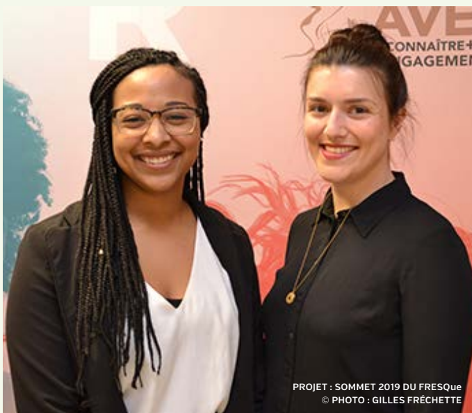
PROJET : SOMMET 2019 DU FRESQue

Visitez la page Facebook de Forces Avenir pour visionner les capsules du gala, consulter les photos et vous laisser inspirer par les projets des lauréats et des finalistes!