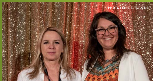
La Coopsco Collège d'Alma reçoit le prix Meilleure performance économique 500 $, commandité par Co-operators