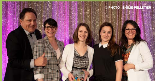
La Coop du Cégep de Sherbrooke reçoit le prix de la Coopérative de l'année 1 000 $ commandité par Co-operators