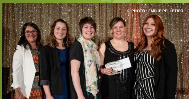
La Coopsco Sainte-Foy reçoit le prix Meilleur projet de développement 500 $, commandité par Co-operators