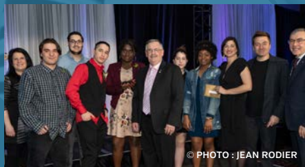
▼ BOMBES ÉTOILÉES École de l'Étoile de Lévis Catégorie 5-12 ans