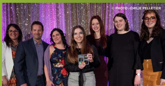
La Coopsco F.-X.-Garneau reçoit le prix Meilleures pratiques sociales 500 $, commandité par Co-operators