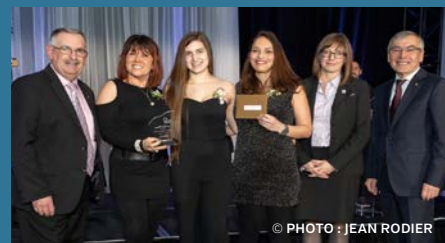
▼ PLACE DU SOURIRE Cégep de Chicoutimi Catégorie 17-35 ans