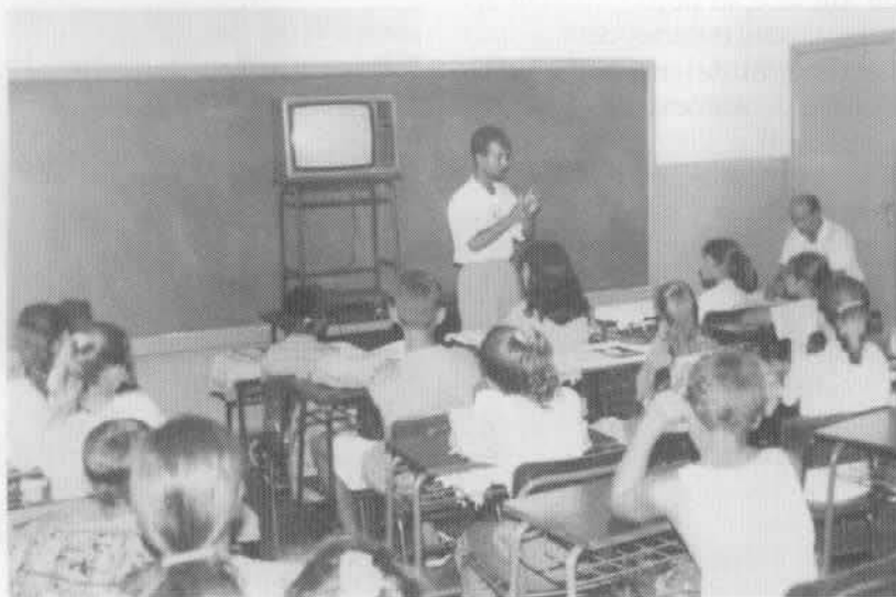
Usina de Segredo: trabalho dos funcionários da Copel junto à comunidade local

aluno da turma de 1931, vulto emérito e um dos mestres mais queridos que já lecionaram naquela instituição. No dia, foi proposta a criação da Associação de Ex-alunos do Curso de Engenharia Civil da Universidade Federal atuará como colaboradora nas atividades científicas, didáticas, culturais e administrativas da faculdade, além de promover intercâmbios. Outro assunto discutido no encontro foi o Projeto Albatroz, que têm como meta tornar o curso de Engenharia Civil da UFPR o melhor do Brasil até o ano 2002.