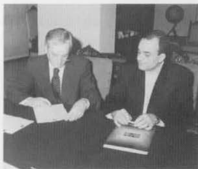
Os novos conselhos diretores do LACTEC foram definidos no último mês de maio.

O LACTEC vai viabilizar a instalação de um laboratório destinado à certificação e inspeção de emissões gasosas de veículos e motores à combustão, em parceria com a Renault do Brasil. Além disso, poderá realizar projetos de pesquisa, desenvolvimento e de engenharia de produto; testes, ensaios e análises para caracterização e diagnóstico de produtos, componentes, processos e sistemas; assistência, consultoria e serviços técnicos, além de estudos sobre fomento, demanda, aplicação, especificação e oferta de tecnologias. ■