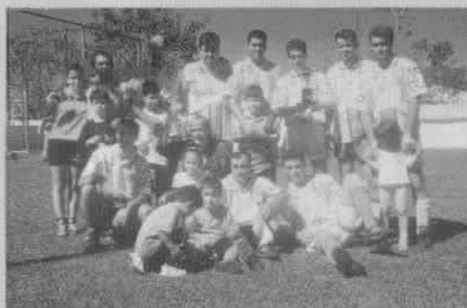
Os campeões do Dia do Trabalho em Campo Mourão

O costelão já tradicional nas festas do CRCM