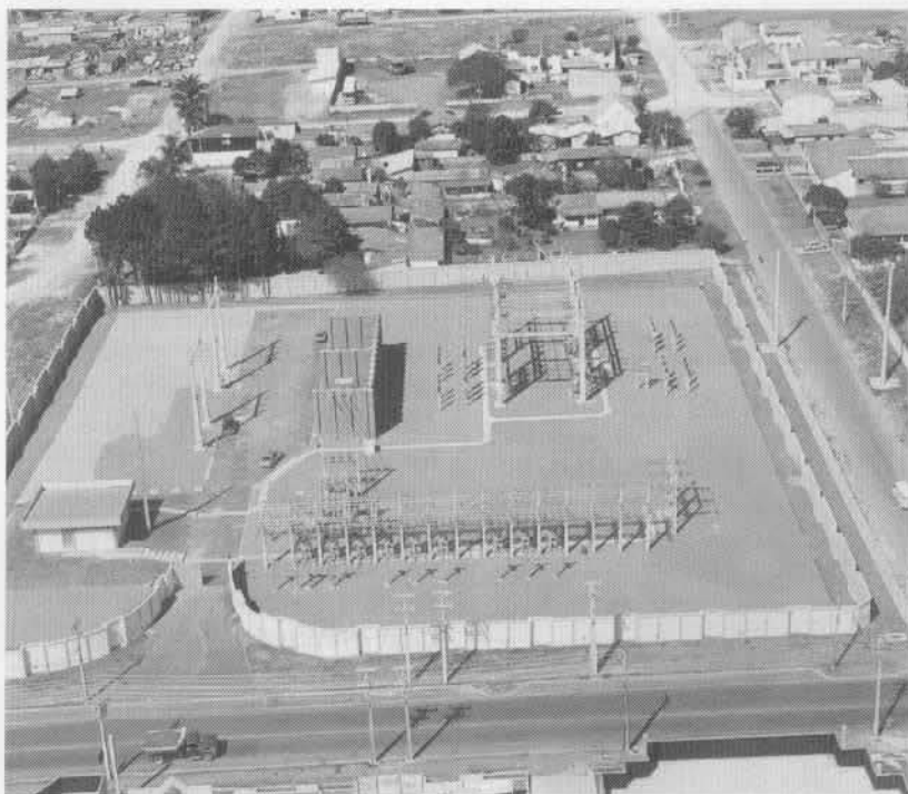
A nova subestação está afinada com modernos conceitos de segurança

Apesar de ser considerada convencional, a subestação Boqueirão apresenta uma série de novidades. Uma delas é a interligação através de cabos de fibra óptica com outras subestações e com o centro de controle, permitindo que a comunicação seja mais eficaz. Outra característica importante é que a construção da subestação Boqueirão atende aos mais modernos conceitos de subestação não abrigada. Ela está dotada de dispositivos de segurança contra a propagação de incêndios e recebeu dispositivos para atenuar os ruídos gerados pelos transformadores. A casa de comando foi projetada de forma compacta, mas altamente funcional, adequada à nova filosofia de automatização de subestações da Copel.