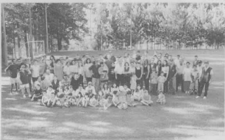
Treinamento em Cianorte reuniu funcionários e seus familiares