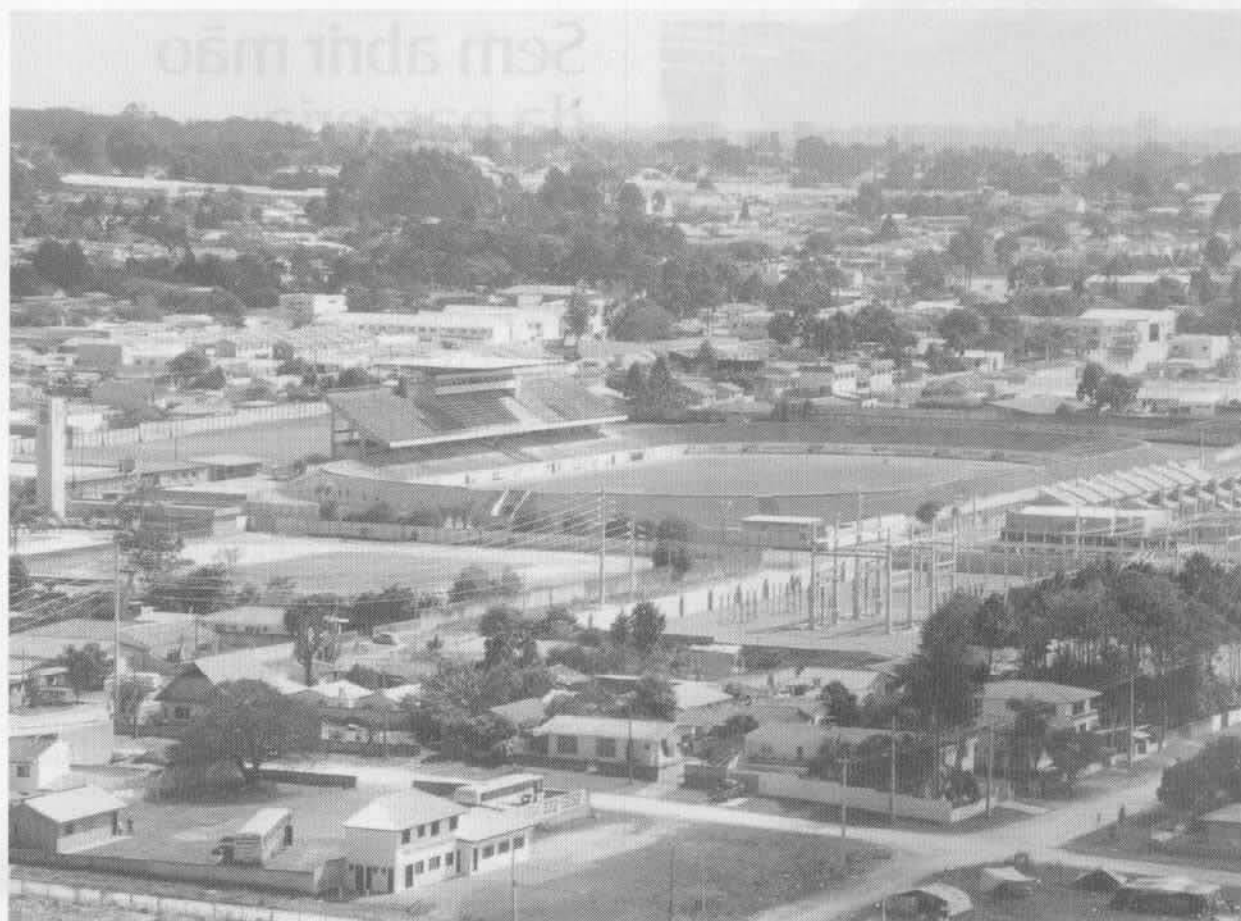
Subestação do Boqueirão: energia com mais qualidade para uma das áreas mais populosas da Capital.