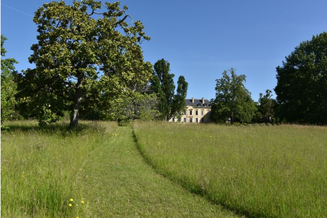
Néac – Parc du château Siaurac

Les horaires et tarifs signalés dans ce programme sont donnés suivant les informations transmises par les propriétaires ou gestionnaires des jardins au 22 mai 2023.