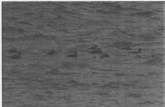
Rhai o'r haid fechan o fôr hwyaid duon

Ymysg y cerrig 'roedd ambell bibydd coesgoch, piod y môr, ac yn sefyll yn urddasol ar graig yn cadw llygad arnynt un wylan gefnddu fwyaf.