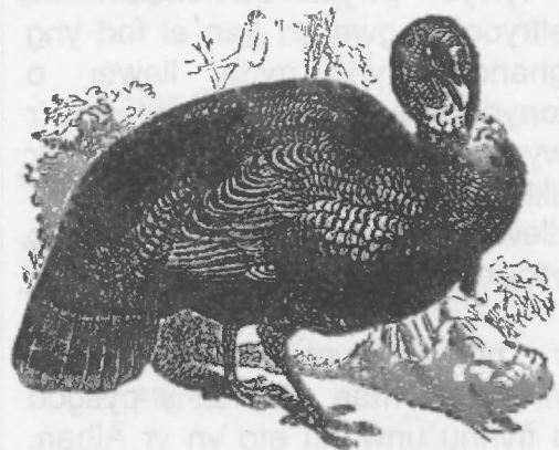
Llun o B. P. Holst The Teachers' and Pupils' Cyclopaedia (Kansas City: The Bufton Book Company, 1909)

Roedd yn amser prysur ond difyr dros ben a rhan o'm bywyd sydd yn y gorffennol erbyn hyn. Clywaf chi'n gofyn beth fyddem ni yn ei gael i ginio Nadolig – wel gwydd y rhan amlaf! Ond dyna braf oedd cael codi'n nhraed pwnn 'Dolig ar ôl golchi'r llestri!