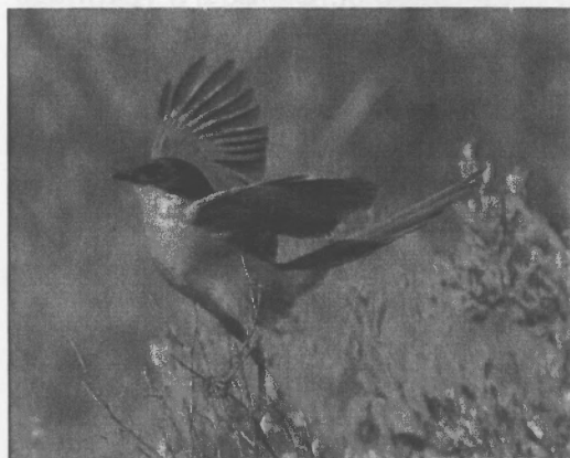
Pioden las yn ceisio cydbwysol!

Bydd teuluoedd ohonyn nhw i'w gweld yn aml iawn yn y coed ac ar y lawntiau o gwmpas y filas ac ar gyrrion y meusydd golff cyfagos. Gyda'r nos fe fydd rhai cannoedd ohonynt yn dwad i glwydo mewn coedlan binwydd tua hanner milltir i ffwrdd a haid o ryw 50 yn hedfan drosom ni i gyrraedd yno wrth iddi d'wyllu.