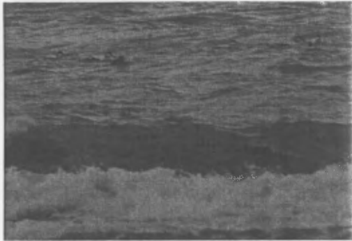
Hwyaid mwythblu y tu hwnt i'r tonnau

Gyda'r golau yn pallu cafwyd diwedd glo arbennig i'r daith. Allan ar y môr 'roedd haid o forhwyaid duon (tua 120) a haid arall yn agos i'r lan o hwyaid mwythblu (tua 50 ohonynt).