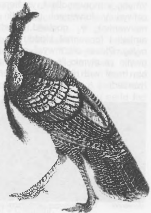
Llun o Louis Figuier, Reptiles and Birds (Llundain: Cassell, Petter and Galpin, 1869)

Roedd indiaid Mecsico eisoes wedi dofi'r twrci pan gyrhaeddodd y Sbaenwyr a rhai o'r adar dof hyn ddaethpwyd i Sbaen yn yr 1520au. Oddi yno aethant i'r Iseldiroedd (oedd dan reolaeth y Sbaenwyr ar y pryd) ac oddiyno i Loegr tua 1542 lle cafodd le anrhydeddus ar fwrdd gwledd Nadolig Harri'r 8fed, ynghyd â'r paun, yr wydd a'r creyr glas!