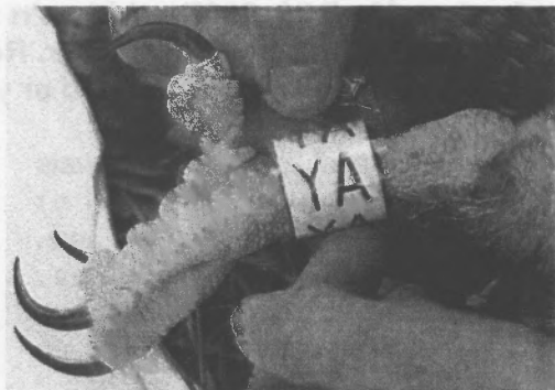
Un o'r modrwyau newydd ar goes un o'r cywion

wedi llwyddo i gael golwg ddigon agos ar y modrwyau hyd yn hyn i fedru cadarnhau hynny.