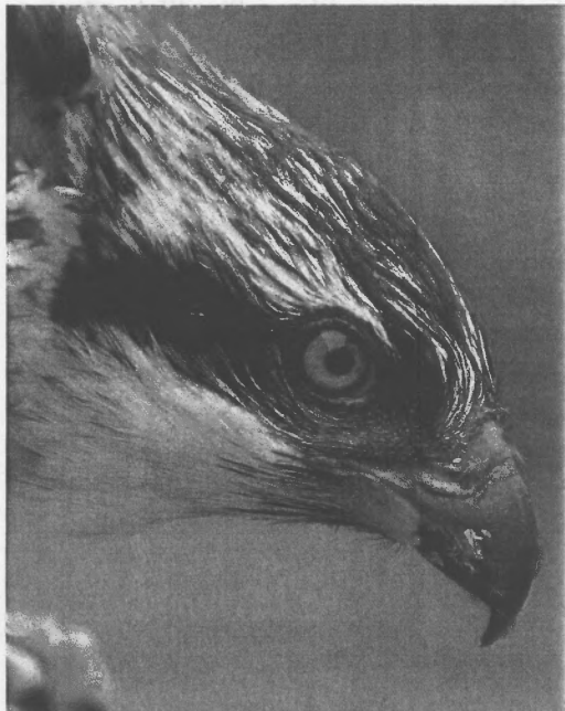
Pen y gwalch, gyda'r pig sydd wedi datblygu'n berffaith i fwyta pysgod

chwe wythnos pan fydd wyau yn y nyth. Dyma'r unig bâr o weilch y pysgod yng Nghymru hyd yn hyn ac mae'r ffaith hon yn unig yn golygu bod eu sefyllfa yma yn eithaf bregus. Cafodd llawer o wyau eu dwyn o nyth Loch Garten yn y dyddiau cynnar.