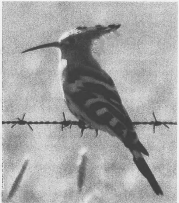
Copog ar weiren bigog

Fe ddaeth dau foi seciwriti ar feic cwad o rywle. Roedden nhw'n gyfeillgar iawn, chwara teg, ddim yn fy nghyhuddo o dresbasu, ond yn tynnu sylw'n barchus iawn at y ffaith mai dim ond golffwyr oedd i fod yno ac ar ôl sgwrsio am dipyn