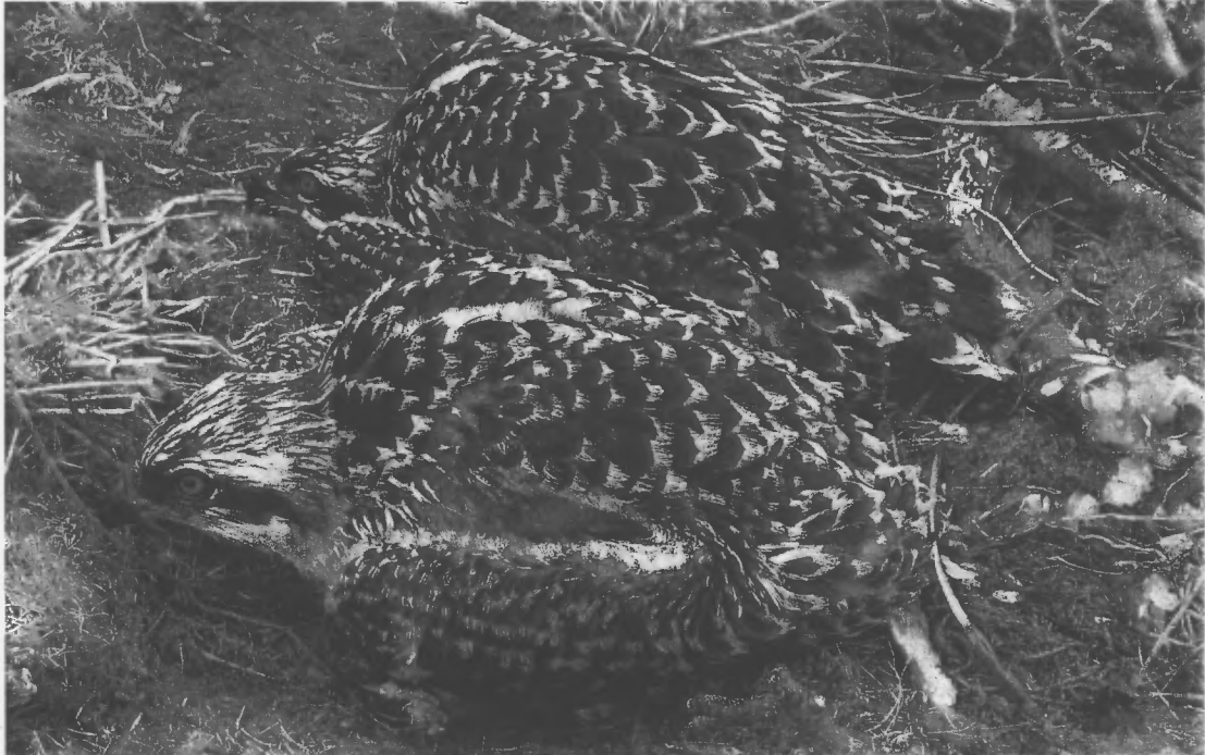
Dau gyw llwyddianus ar y nyth, 2007

Nid oedd unrhyw gofnod o weilch y pysgod yn magu yng Nghymru cyn y ganrif hon nes i bâr nythu yn 2004 yng nghanolbarth Cymru ger y Drenewydd. Yn anffodus, ni ddychwelodd y pâr hwn y flwyddyn ganlynol er iddynt fagu un cyw yn llwyddiannus. Drwy gyd-ddigwyddiad fodd bynnag, nythodd pâr arall o weilch y pysgod ar y Traeth Mawr ar lan yr Afon Glaslyn yn yr un flwyddyn ac mae'r pâr yma wedi dychwelyd i'r un safle bob blwyddyn ers hynny.