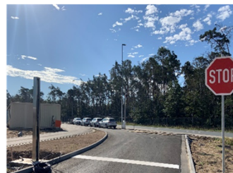
Swissport Cargo Services Deutschland GmbH, 544 CCS épület, Cargo City Süd, 60549 Frankfurt/Main

Booking Confirmation at SCS SLOT START: 02.10.20 12:15 PIN: XXXXXXXXXX DOOR: Rampe 1 Please arrive on time, or slot will expire. Swissport Cargo Services