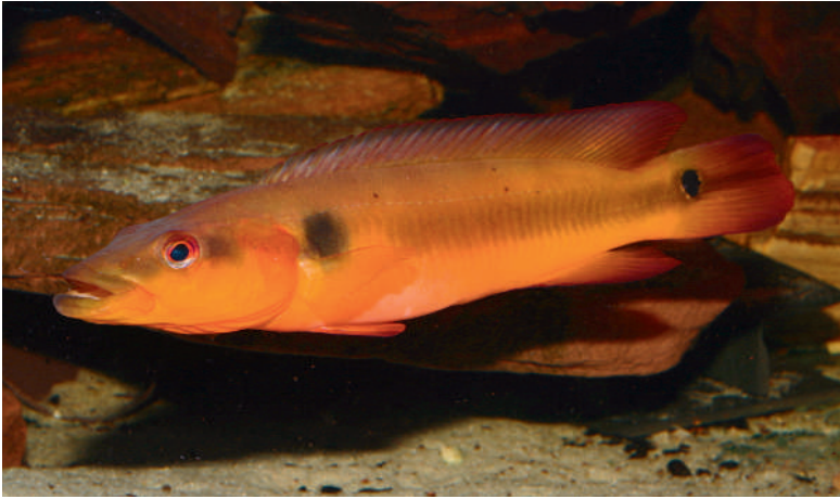
Adultes Männchen von C. sp. aff. lugubris „Tapajós“. Die Weibchen sind noch etwas roter und haben eine weißen Streifen in der Rückenflosse.

Seite 59: Weibchen von Crenicichla sp. aff. lugubris „Tapajós“ mit etwa 15 Zentimeter Gesamtlänge.