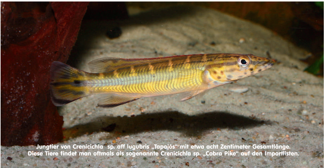
Jungtier von Crenicichla sp. aff. lugubris „Tapajós“ mit etwa acht Zentimeter Gesamtlänge. Diese Tiere findet man oftmals als sogenannte Crenicichla sp. „Cobra Pike“ auf den Importlisten.