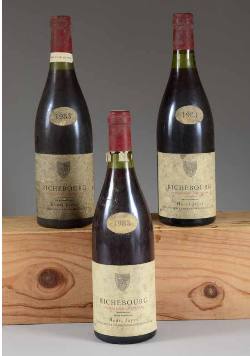
416 3 bouteilles RICHEBOURG, Henri Jaye 1983 (es, petites taches sur les étiquettes, 1 bandeau abîmé, 1 tombé)