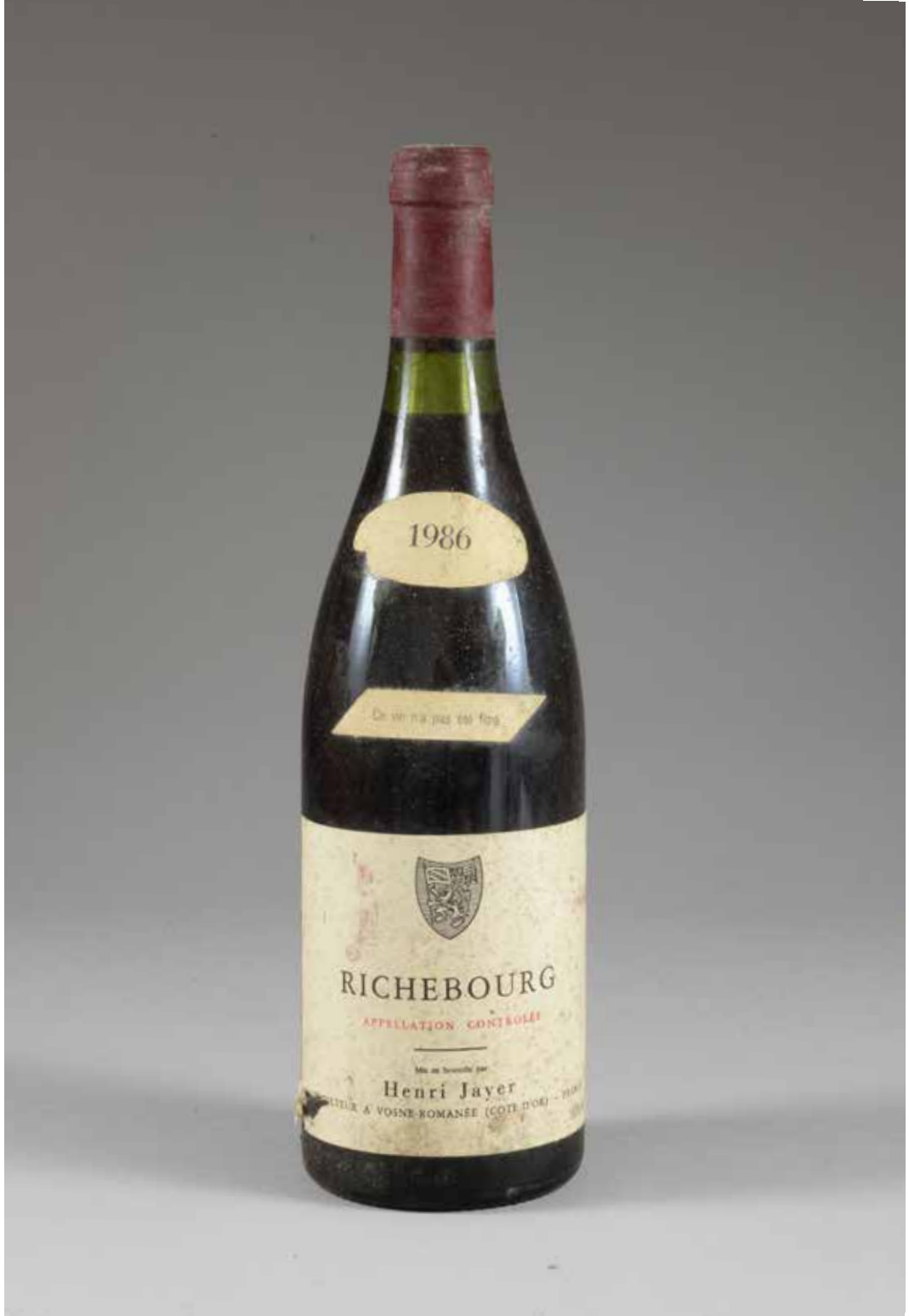
432 1 bouteille RICHEBOURG, Henri Jay 1986 (ela, tachée, macaron légèrement abîmé)