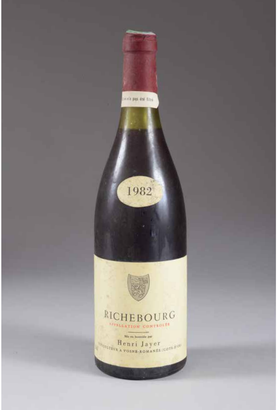
409 1 bouteille RICHEBOURG, Henri Jayer 1982 (elt, els, TLB)