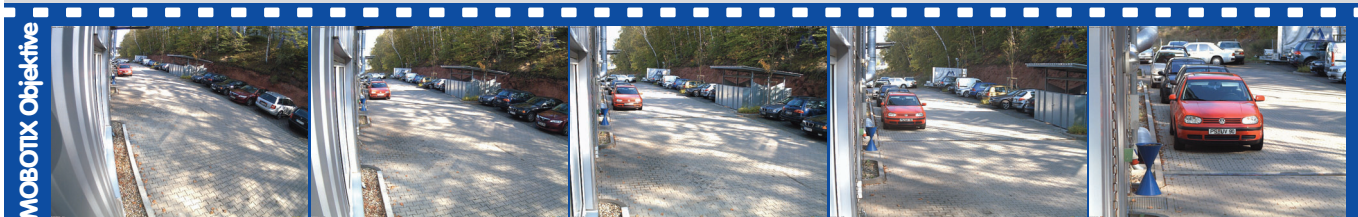
ca. 90°H x 67°V in 10 m ca: 20,0 x 13,3 m